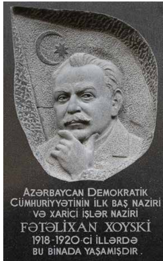
Plaque commémorative sur la maison de Fətəli Xan Xoyski à Bakou

soviétique, occupant le poste de commissaire du peuple aux affaires étrangères de 1918 à 1930.