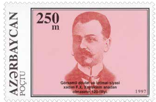
Timbre-poste de la République d'Azerbaïdjan émis à la mémoire de Fatali Khan Khoyski

seul contrepoids au Soviet de Bakou, qui, en tant que bastion bolchevik-dachnak 5 , ayant pris le pouvoir par le biais de pogroms sanglants et massifs contre une population azérie pacifique. Un témoignage éloquent, du poids politique et du prestige de Fatali Khan Khoyski, est la dépêche du président du Conseil des commissaires