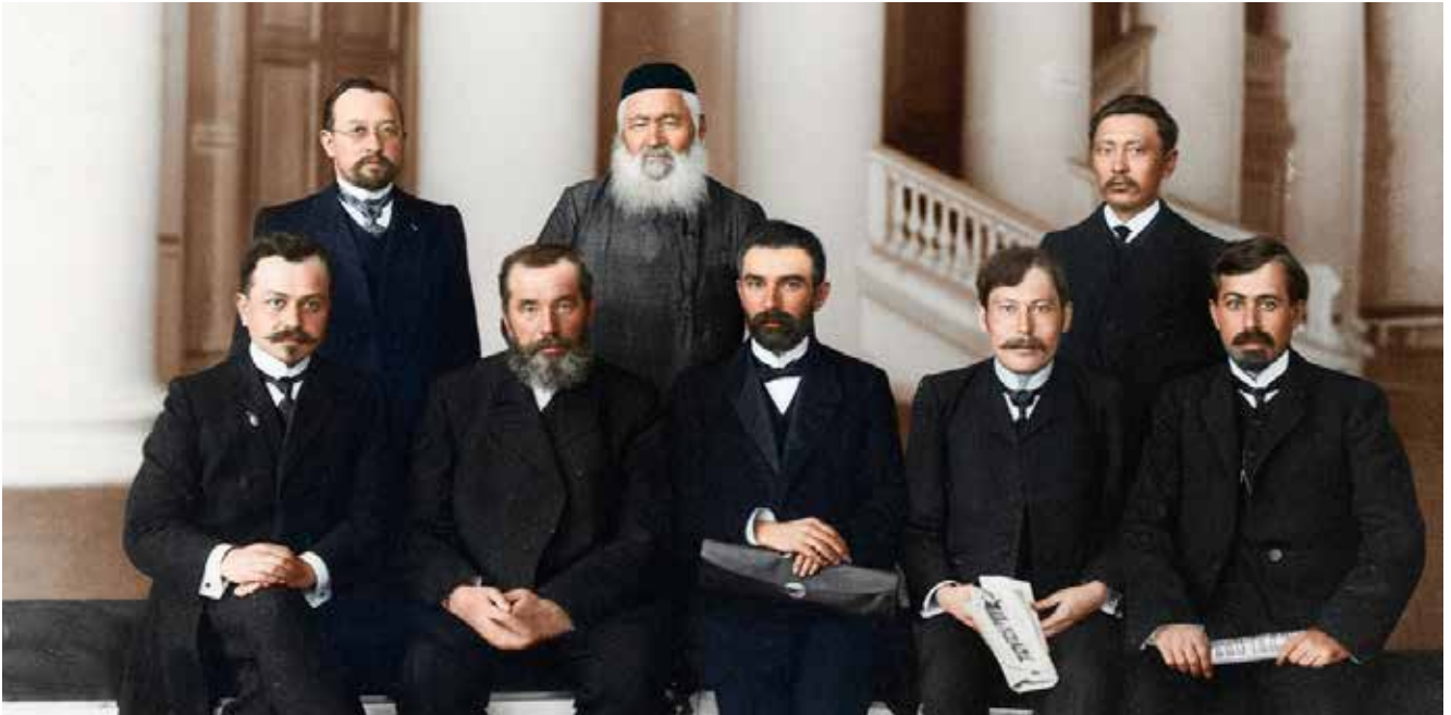
Khoyski (assis à gauche) avec un groupe de députés de la Deuxième Douma d'État de l'Empire russe

Il déclara à Tcheidze et aux autres leaders géorgiens que, si la Géorgie proclamait son indépendance, les Azerbaïdjanais prendraient une mesure similaire (4, p. 113). Il s'agissait de la dernière réunion de la faction musulmane au sein du Sejm transcaucasien. Le 27 mai, lors d'une session extraordinaire, les députés azerbaïdjanais se déclarèrent membres du Conseil national provisoire d'Azerbaïdjan et élurent à l'unanimité Fatali Khan Khoyski en tant que président. Il est important de noter que Khoyski adoptait une position modérée en ce qui concerne l'indépendance. Il estimait qu'il était nécessaire d'abord de préparer le terrain au niveau international.