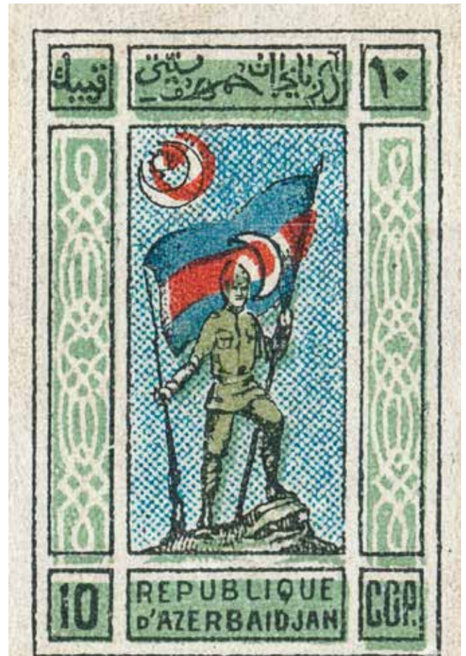
Timbre-poste de la République démocratique d'Azerbaïdjan émis à l'initiative de Fatali Khan Khoyski en 1919

seul contrepoids au Soviet de Bakou, qui, en tant que bastion bolchevik-dachnak 5 , ayant pris le pouvoir par le biais de pogroms sanglants et massifs contre une population azérie pacifique. Un témoignage éloquent, du poids politique et du prestige de Fatali Khan Khoyski, est la dépêche du président du Conseil des commissaires