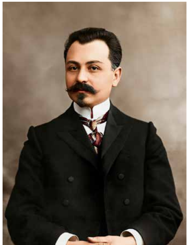
Fatali Khan Khoyski, 1905

La biographie politique de Fatali Khan Khoyski peut, grosso modo, se diviser en deux périodes : celle d'avant le début du mouvement de libération nationale, et celle durant ce mouvement.