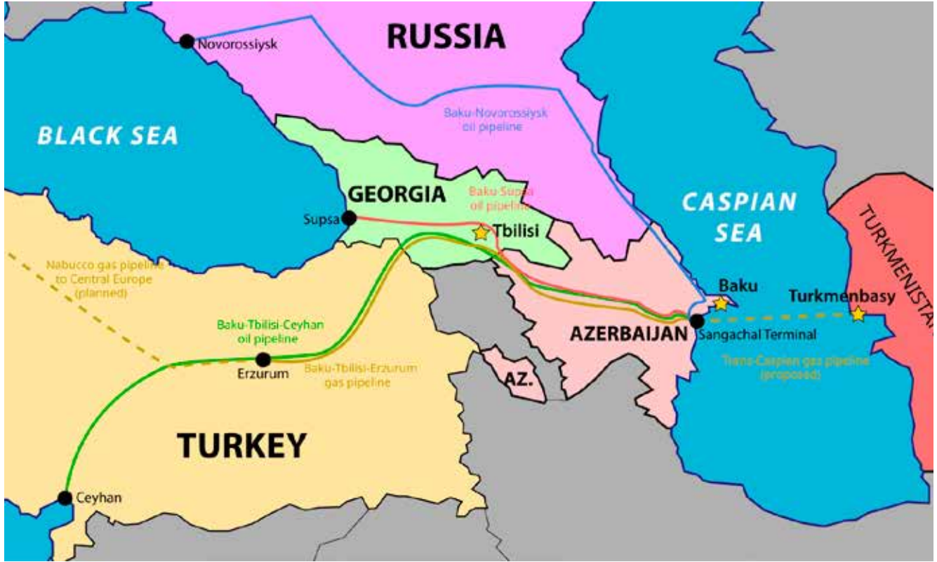
Bakü-Tiflis-Ceyhan Boru Hattı ve diğer enerji projelerinin haritası

inşaatı meselesidir. Bu ise iki ülke arasındaki ulaştırma-iletişim ilişkilerinin yoğunlaştırılmasına önemli katkı sağlayacaktır.