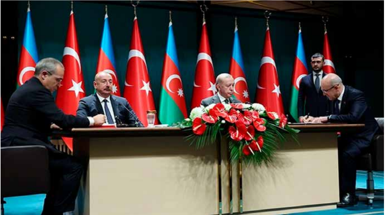
Türkiye ve Azerbaycan Arasında Stratejik İşbirliği. Türkiye ve Azerbaycan, vergilendirme, veterinerlik ve yükseköğretim alanlarında önemli adımlar atmaya üzere üç ayrı anlaşma

rını ifade etmişler. Türkiye ve Azerbaycan, bölgenin ve Avrupa'nın enerji güvenliğine katkı veren, doğal gaz kaynak ve güzergâh çeşitlendirmesi sağlayan stratejik Güney Gaz Koridorunun hayata geçirilmesinde Türkiye ve Azerbaycan'ın öncü rolünü bir daha ortaya koymuş, Güney Gaz Koridorunun etkili biçimde kullanılması ve daha da geliştirilmesine yönelik çabaları koordineli şekilde sürdüreceklerini belirtmişler. Her iki kardeş ülke ayrıca küresel enerji sektöründeki gelişmeleri de dikkate alarak, bölgenin enerji arz güvenliğinin pekiştirilmesini teminen elektrik alanında da bölgesel işbirliğine katkı sağlayacak çabaların artırılarak sürdürülmesi konusundaki niyetlerini ortaya koydular. İki ülke topraklarından geçen Doğu-Batı/Orta uluslararası ulaştırma koridorunun rekabet kabiliyetinin artırılması amacıyla karşılıklı işbirliği daha da pekiştirecektir. Türkiye ve Azerbaycan akıllı ulaşım sistemleri teknolojilerinden istifade ederek, uluslararası ulaştırma koridorlarının Türkiye ve Azerbaycan bölgelerinde transit-ulaştırma potansiyelini daha da geliştirmek için gereken adımları atmaktadırlar. En önemli konulardan biri ise, Türkiye ve Azerbaycan'ı birleştiren Azerbaycan Cumhuriyeti Batı rayonları ile Azerbaycan Cumhuriyeti'nin Nahçıvan Özerk Cumhuriyeti arasındaki koridorun (Zengezur Koridoru) açılması ve söz konusu koridorun devamı olarak Nahçıvan-Kars demiryolunun