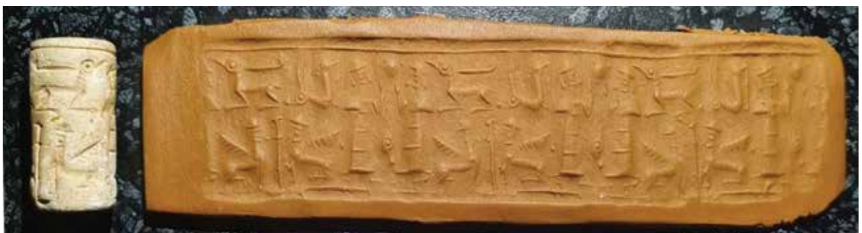
Митаннийская цилиндрическая печать. Эпоха поздней бронзы – раннего железа. Сары-Йохуш, курган № 2

касового дерева. Рядом с останками умершего в могиле были бронзовый меч, обсидиановые наконечники стрел и бронзовый колчан с украшениями, а также кувшин с крышкой. При обследовании останков умершего в области шеи были