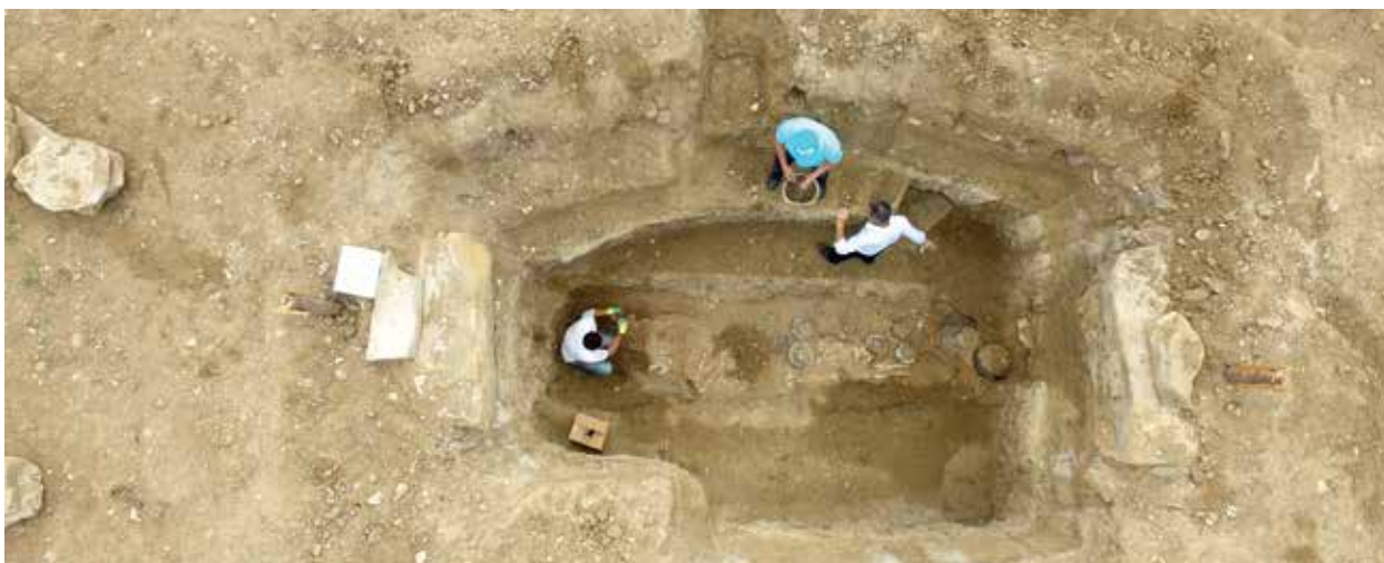
Погребальная камера племенного вождя. Эпоха поздней бронзы – раннего железа. Сары-Йохуш, курган № 2

Начиная с 2000-х годов, сотрудниками Института археологии, этнографии и антропологии Национальной академии наук Азербайджана проводятся археологические исследования, охватывающие главным образом курганы бронзового века . Следует особо отметить нештатную ситуацию в связи с начавшимся осенью 2020 года строительством новой автодороги, на трассе которой оказались 6 курганных захоронений . С конца декабря 2020 года и до конца февраля 2021 г. члены археологической экспедиции в трудных условиях, вызванных зимними холодами и усугубленными условиями каран-