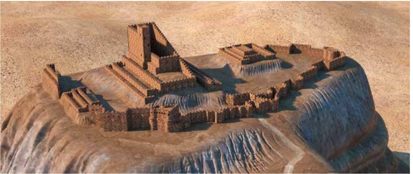
Ricostruzione della fortezza di Oghlangala