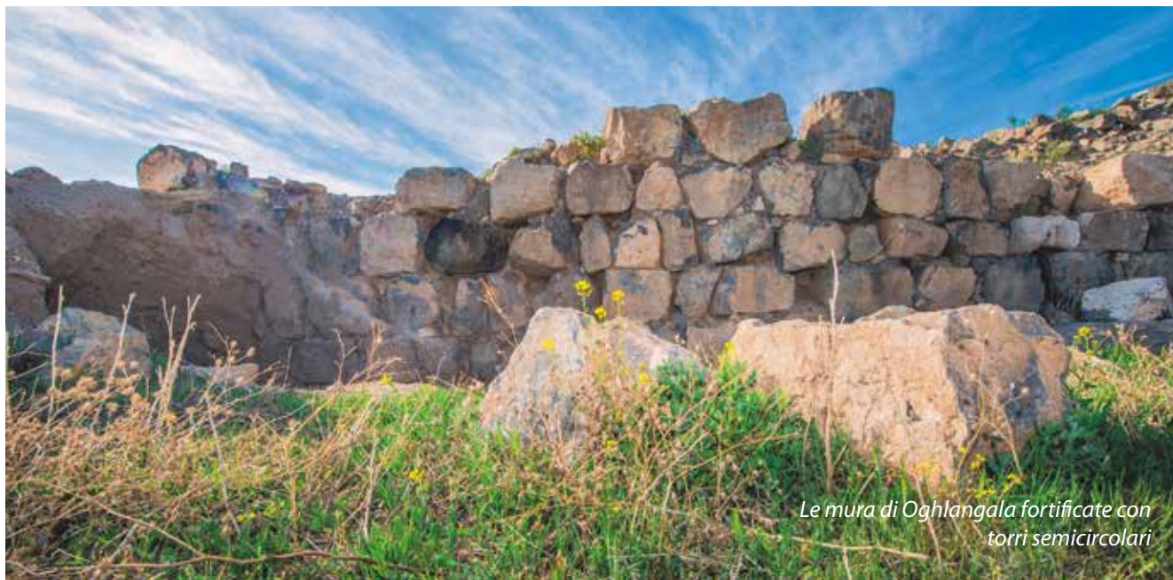
Le mura di Oghlangala fortificate con torri semicircolari

Successivamente, nel periodo 1960-2003, nei siti sopra elencati, sono state effettuate ricerche archeologi-