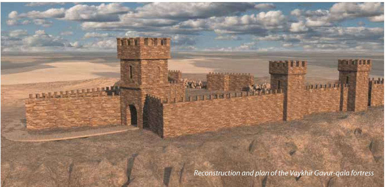
Reconstruction and plan of the Vaykhir Gavur-qala fortress

Nel 1934-1936 sono state scoperte le prime antiche città-fortezze sul territorio della Repubblica Autonoma di Nakhchivan da parte del famoso archeologo ed etnografo azerbaijano A.K. Alakbarov, che scoprì gli insediamenti di Gavurgala e Oghlangala. Sulla base dello studio delle potenti fortificazioni difensive della fortezza di Oghlangala, sono stati presentati da parte dello studioso, interessanti conclusioni scientifiche sull'architettura