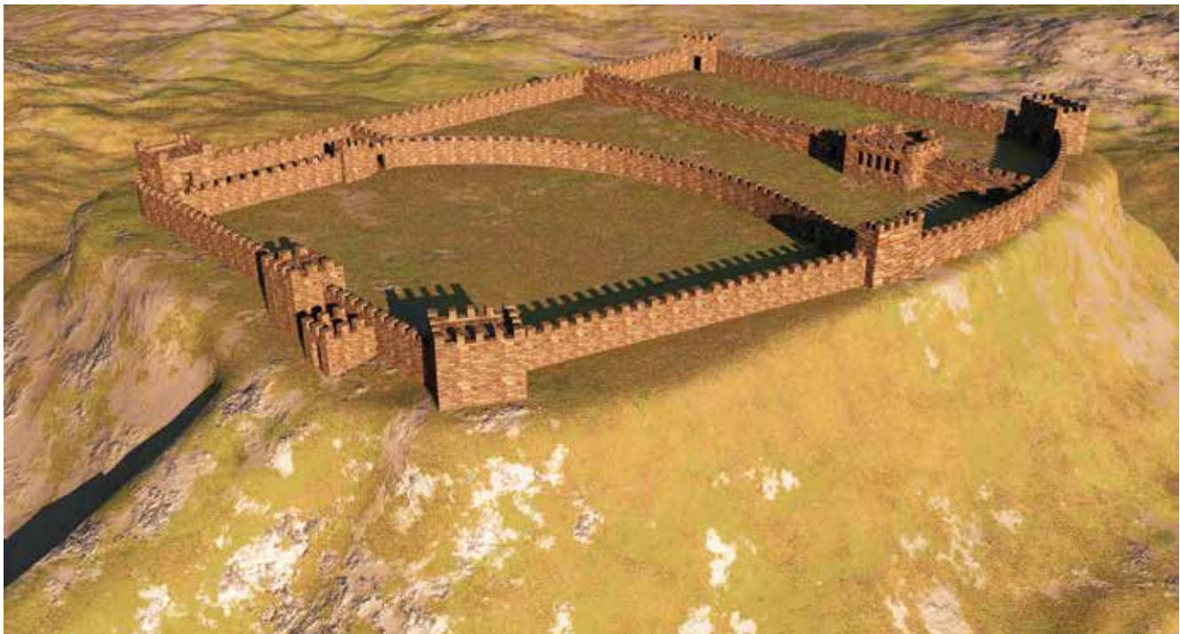
Ricostruzione e pianta della fortezza Kultapa 2

La fine del III - II millennio a.C fu segnata da una nuova fase nello sviluppo economico e culturale delle regioni di Urmiye, Nakhchivan e Karabakh, dove in questo periodo, sorsero città-fortezze. In queste regioni, adiacenti al Caucaso Meridionale, con le favorevoli condizioni naturali e climatiche, insieme a un significativo accrescimento della popolazione, aumentò notevolmente anche la produttività del lavoro, sorsero importanti centri artigianali e culturali lungo importanti rotte commerciali, in cui si svilupparono la produzione tessile, la lavorazione dei metalli, ceramica e intaglio su pietra e su osso e altri mestieri. Gli abitanti di queste regioni, essendo principalmente impegnati nell'allevamento del bestiame e nell'agricoltura, stabilirono attivi legami commerciali, economici e culturali con le vicine regioni del Caucaso, del Medio Oriente e dell'Asia Occidentale.