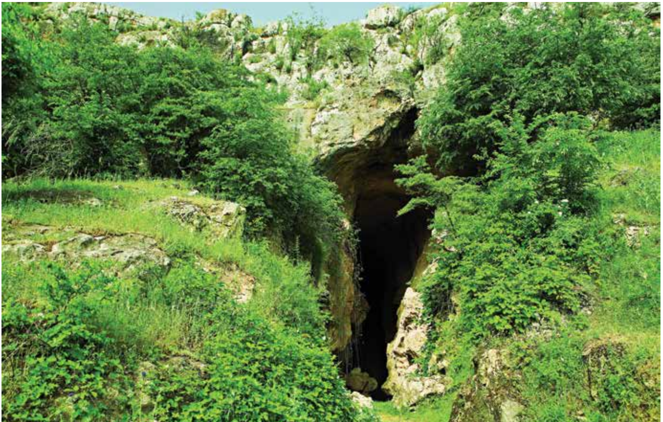
Shpella e lashtë Azikh. Rajoni ekonomik i Karabakut, Azerbajxhan

ka shërbyer dhe shërben si kryqëzim gjeografiko-ekonomik dhe si shtrat identitetesh dhe kulturash të ndryshme, por në thelb të njëjta, të njohura në botë si kaukaziane. Mes këtyre identiteteve dhe kulturave shquan populli dhe kultura azerbajxhanase, nga më të vjetrat në rajon. Një inkursion i shkurtër në historinë e Azerbajxhanit hedh dritë në mënyrë të pashmangshme