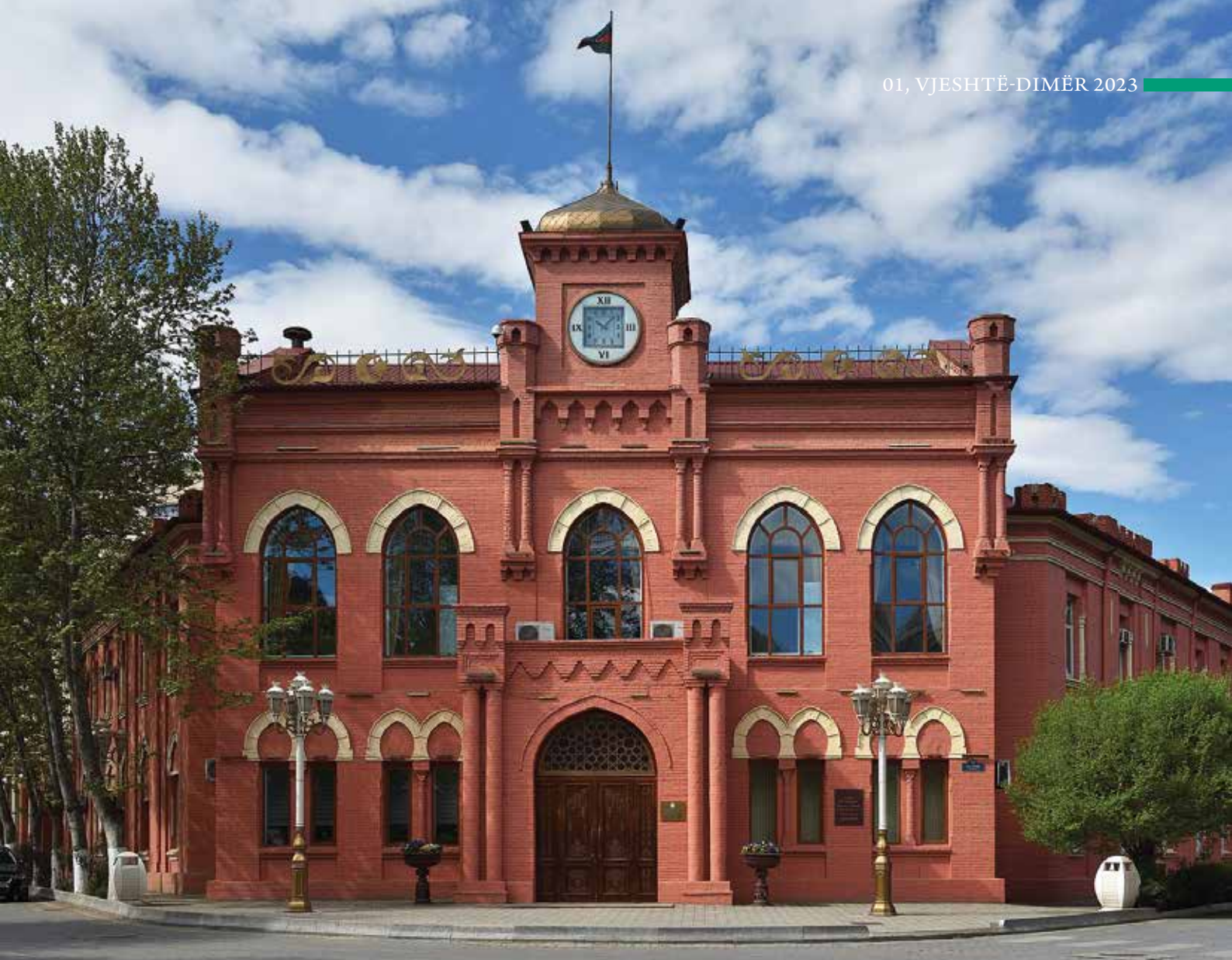
Ndërtesa e parë administrative e Republikës Demokratike të Azerbajxhanit. Ganja, Azerbajxhan

Azerbajxhanin historik në atë të republikës (1918-1920) dhe në periudhën kur Azerbajxhani u përfshi në Bashkimin Sovjetik janë trajtuar në mënyrë sipërfaqësore, duke i dhënë rëndësi një faktori social ose një tjetri dhe jo duke i trajtuar si një tërësi faktorësh të rëndësishëm socialë që krijuan sinergjinë e nevojshme për të gdhendur identitetin kulturor e kombëtar azerbajxhanas. Mjafton të përmendim faktin se identitetit fetar të azerbajxhanasve i është dhënë një rëndësi më e madhe duke analizuar detaje të ndryshme kulturore që lidhen me të dhe duke i vendosur Azerbajxhanin dhe azerbajxhanasit në hartat imagjinare të ndarjeve sipas diskursit orientalist. Nga viti 1920-1991, Azerbajxhani u shpall Republikë Socialiste Sovjetike. Kjo periudhë historike ndahet në dy periudha të rëndësishme që transformuan shoqërinë dhe jetën publike në Azerbajxhan. Periudha e parë fillon nga vitet 1920 deri në vdekjen e Stalinit dhe në Kongresin XX të PKBS, më 1956, ndërsa periudha e dytë nga viti 1956 deri në rrëzimin e komunizmit dhe