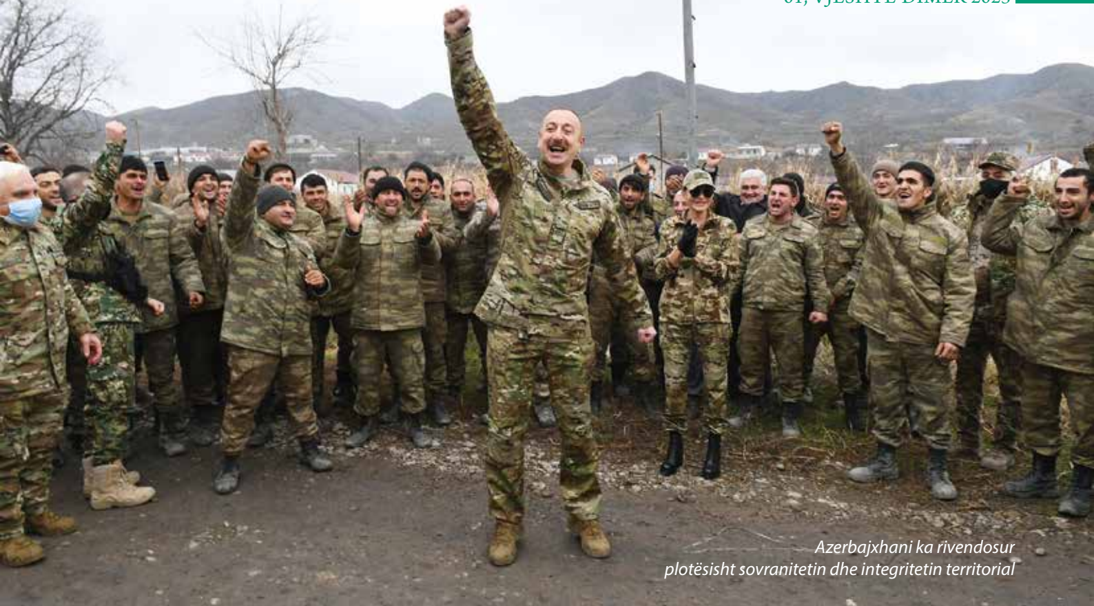
Azerbajxhani ka rivendosur plotësisht sovranitetin dhe integritetin territorial

OSBE-së. (Deklarata tripalëshe e nënshkruar më 10 nëntor 2020 midis Azerbajxhanit, Armenisë dhe Rusisë). 8