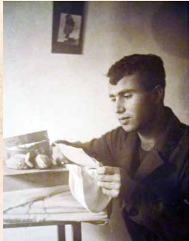
Керим Керимов в первые годы работы

Старший брат моего отца - герой Социалистического Труда, лауреат Сталинской, Ленинской и Государственной премий, обладатель двух орденов Ленина, двух – Трудового Красного Знамени, ряда медалей, кавалер азербайджанского ордена «Шохрат» (слава) генерал-лейтенант Керим Керимов (14.11.1917–29.03.2003) стоял у истоков советской космонавтики, 25 лет был председателем Государственной комиссии СССР по летным испытаниям пилотируемых и беспилотных кораблей и станций. Его заслуги в освоении космоса неосценимы . Его с уверенностью можно назвать гордостью