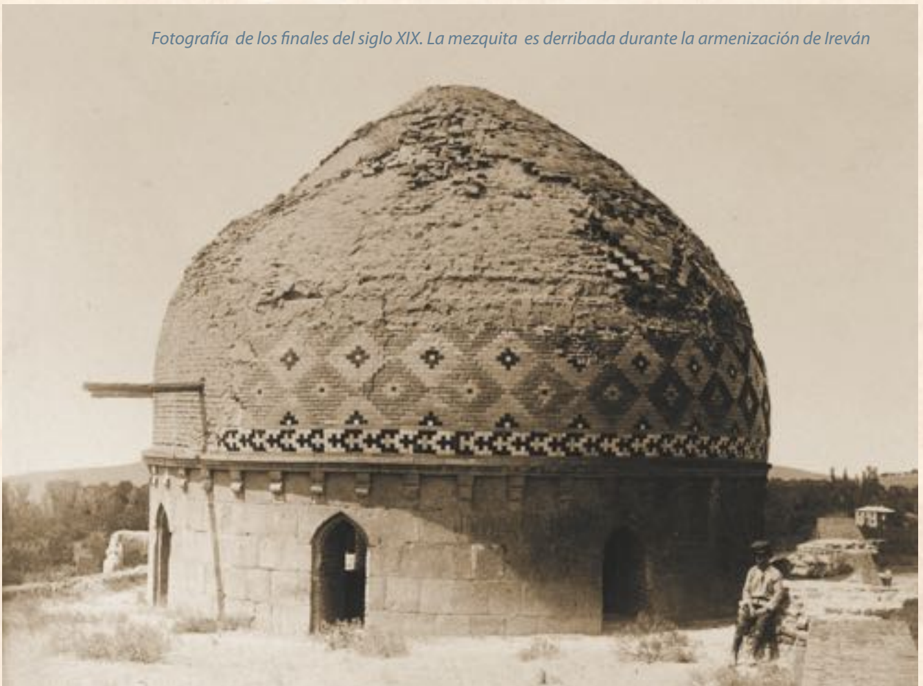
Fotografía de los finales del siglo XIX. La mezquita es derribada durante la armenización de Ireván

Además, el Bakú oficial manifestó sus planes relacionados con el retorno de los azerbaiyanos a Zanguezúr y a otras regiones de Armenia, de donde los autóctonos azerbaiyanos fueron forzosamente expulsados, a finales de 1980. En Azerbaiyán, va creciendo el interés por el estudio del patrimonio histórico-arquitectónico y el legado cultural azerbaiyano del Medioevo, recientemente exterminado en Armenia. Se otorga gran importancia al estudio del trágico destino de la ciudad medieval azerbaiyana de Ierevan (Erivan), exterminada completamente en actualidad. En su lugar, ha aparecido la actual capital de Armenia, denominada "Ereván". Basándose en las fuentes europeas, rusas, otomanas y armenias se puede hacer seguimiento exacto del destino de Ierevan. Tras exterminación de esta ciudad por las autoridades armenias, en 1960, fue inventado el mito sobre el antiguo Erebuni, que cumplió 28 siglos. Además, usaban como documentos acreditativos hallados cerca de Ierevan los restos del castillo de Urarta. La comunidad internacional y la Ciencia no deben pasar de alto de esta falsificación de la Historia, destinada a encubrir el vandalismo extremo.