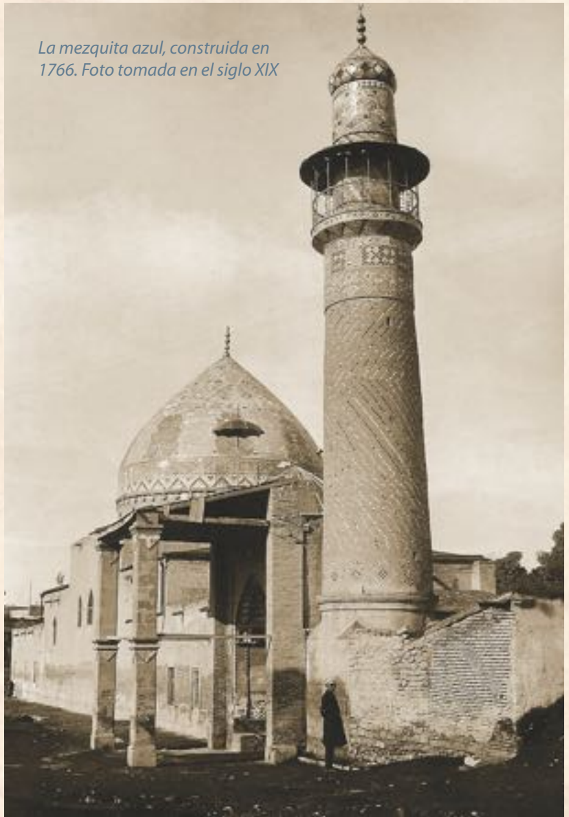
La mezquita azul, construida en 1766. Foto tomada en el siglo XIX

Tamerlán (a finales del siglo XVI), convirtiéndose en la ciudad solo en el siglo XV durante el reinado de Sha Ismail - es cuando recibió su denominación actual."