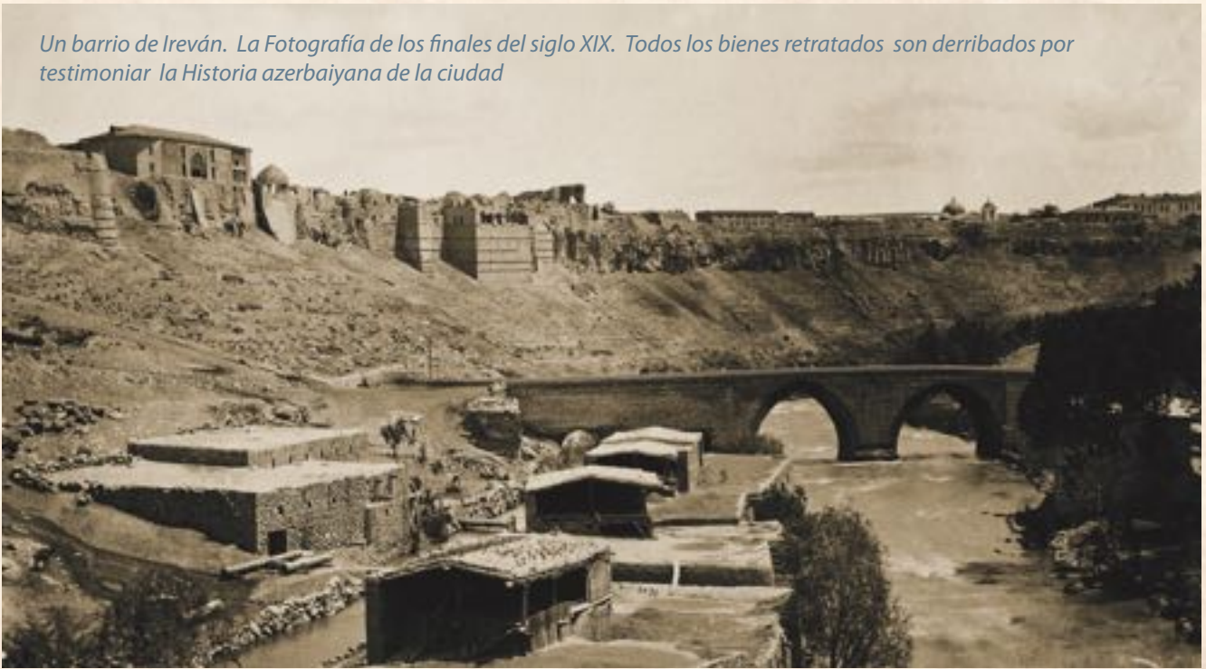
Un barrio de Ireván. La Fotografía de los finales del siglo XIX. Todos los bienes retratados son derribados por testimoniar la Historia azerbaiyana de la ciudad

siglo XIV. Al espectador le dicen que las monedas demostradas están elaboradas en Ereván, pero el estudio revela lo contrario. Así, al estudiar la moneda acuñada durante la época de Anushirván (Anushirován) del XIV se pone en evidencia que como lugar de su elaboración no figura Ireván, sino Maraván, ubicado en el territorio del Irán actual. En el documental también figura la moneda acuñada en la época de Abu Said, indicando como lugar de su elaboración Ereván, pero en la propia moneda está indicada la ciudad de Royan que también se encuentra en el territorio del Irán actual. Además, las fuentes también indican directamente que Ireván