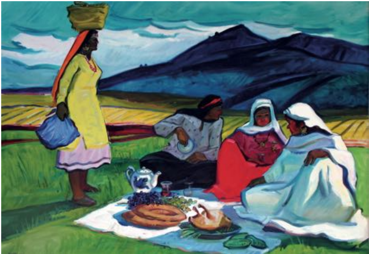
"На полях Азербайджана", 1968 г. Холст, масло, 160x220

по костюмам к съемкам фильма «Фатали хан» на тему событий в Азербайджане XVIII столетия. Подобного рода работам по духу соответствует и оформление исторического спектакля «Нушаба» по одноименному произведению видного азербайджанского писателя и драматурга Абдуллы Шаика.