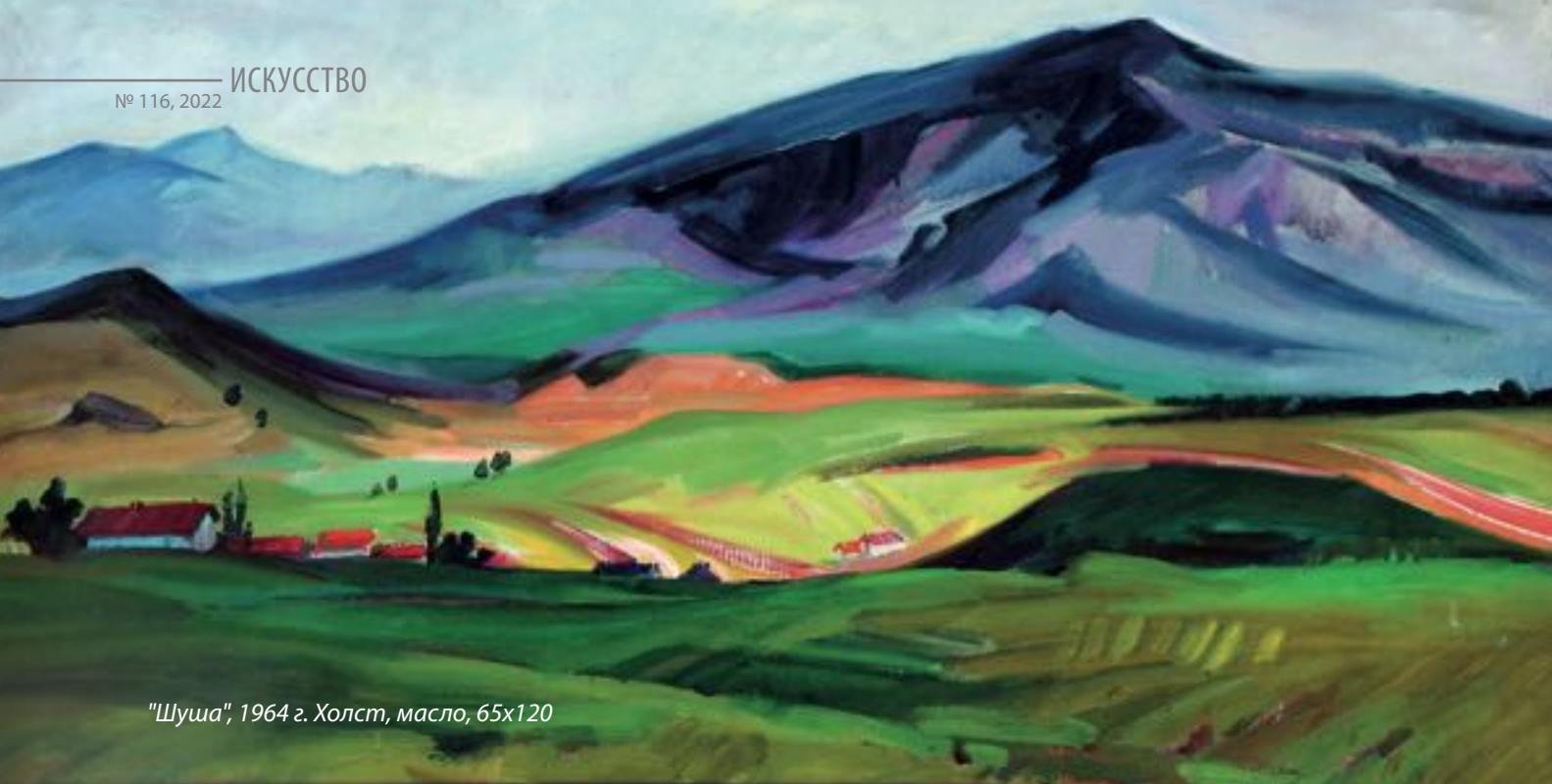
"Шуша", 1964 г. Холст, масло, 65x120

их сквозь призму собственных излюбленных стилистических приемов - главные художественные черты этой серии, а среди наиболее интересных работ можно назвать «Памятник Яну Гусу», «Золотая башня в Праге», «Утро в Праге».