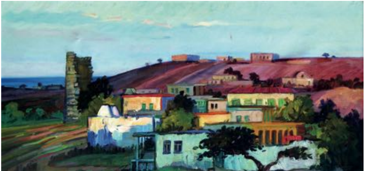
"Вечер в Бильгя", 1964 г. Холст, масло, 118x59

красочная палитра художника является своего рода творческим отражением рисунка традиционных азербайджанских ковров, в которых, как и в полотнах К.Ханларова, композиция строится на основе жесткого графического ритма повторяющихся форм, заполненных яркими цветовыми пятнами. У К.Ханларова своеобразный ритм контрастных цветовых решений одинаковой интенсивности уравнивается и гармонизируется общим колористическим решением. Наиболее отчетливо это видно в работах, посвященных родному Абшерону, - «Шаган», «Улица в Бильгя» и др. На многих пейзажных полотнах Кямила Ханларова изображены различные проявления водной стихии, будь то море, озеро, река, и художник часто помещает водоем в центр композиции, подчеркивая таким образом простор и глубину пейзажа. Нередко складывается впечатление, что автор придает водной глади некое символическое значение.