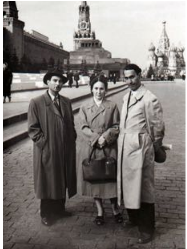
К.Ханларов с супругой и певцом Г.Мамедовым в Москве на Красной площади.1981 г.

The article briefly describes the legacy of a prominent Azerbaijani artist and teacher of the 20th century, a remarkable master of landscape painting Kamil Khanlarov.