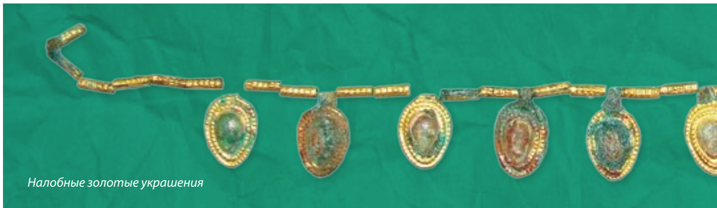
Налобные золотые украшения

Шамкирчайского кургана эпохи ранней бронзы в Шамкирском районе было найдено 10 золотых бусинок, а в 2011 г. при раскопках впускного погребения периода ранней бронзы на неолитическом поселении Гасансу в Агстафинском районе – золотые и серебряные спиралевидные украшения для волос и серебряный браслет.