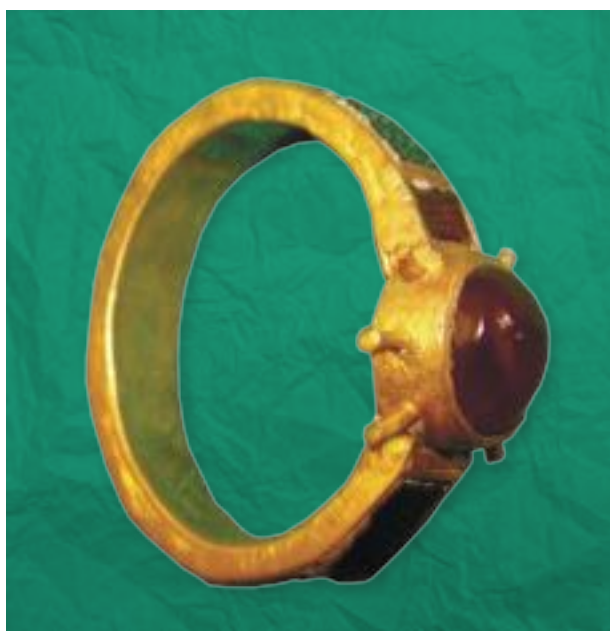
Золотое кольцо, инкрустированное агатом

Археологам известно, сколь сложно бывает установить время и назначение золотых изделий, найденных не в культурном слое или погребении. Другая трудность состоит в том, что золотых украшений изготовлялось значительно меньше, чем других археологических материалов, для их производства характерен консерватизм. Некоторые виды украшений сохраняли свои типологические особенности на протяжении 1500 лет. Наряду с этим, некоторые украшения отличаются особенностями, присущими тем или иным историческим периодам. Из 52 украшений 32 составляют мелкие трубчатые бусы, ближайšie аналоги которых из золота и бронзы известны из памятников Азербайджана периода поздней бронзы - раннего железа. Листьевидные подвески (числом 11 штук) инкрустированы стеклопастой и выстраиваются посредством тех же трубчатых бус. Из памятников Ходжалы-Гедабейской археологической