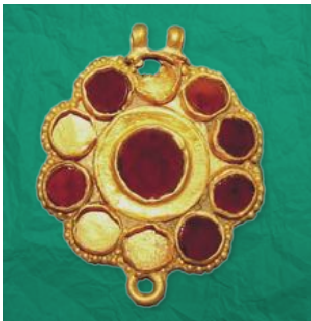
Золотой медальон, инкрустированный агатом

Основная масса золотых изделий поздней античности и раннего средневековья – эпохи Кавказской Албании выявлена при раскопках в окрестностях г. Мингечевира. Наряду с этим, в 2004 г. в ходе исследований в рамках проекта основного экспортного нефтепровода Баку – Тбилиси – Джейхан на территории Самухского района Азербайджана из грунтового погребения V – IV