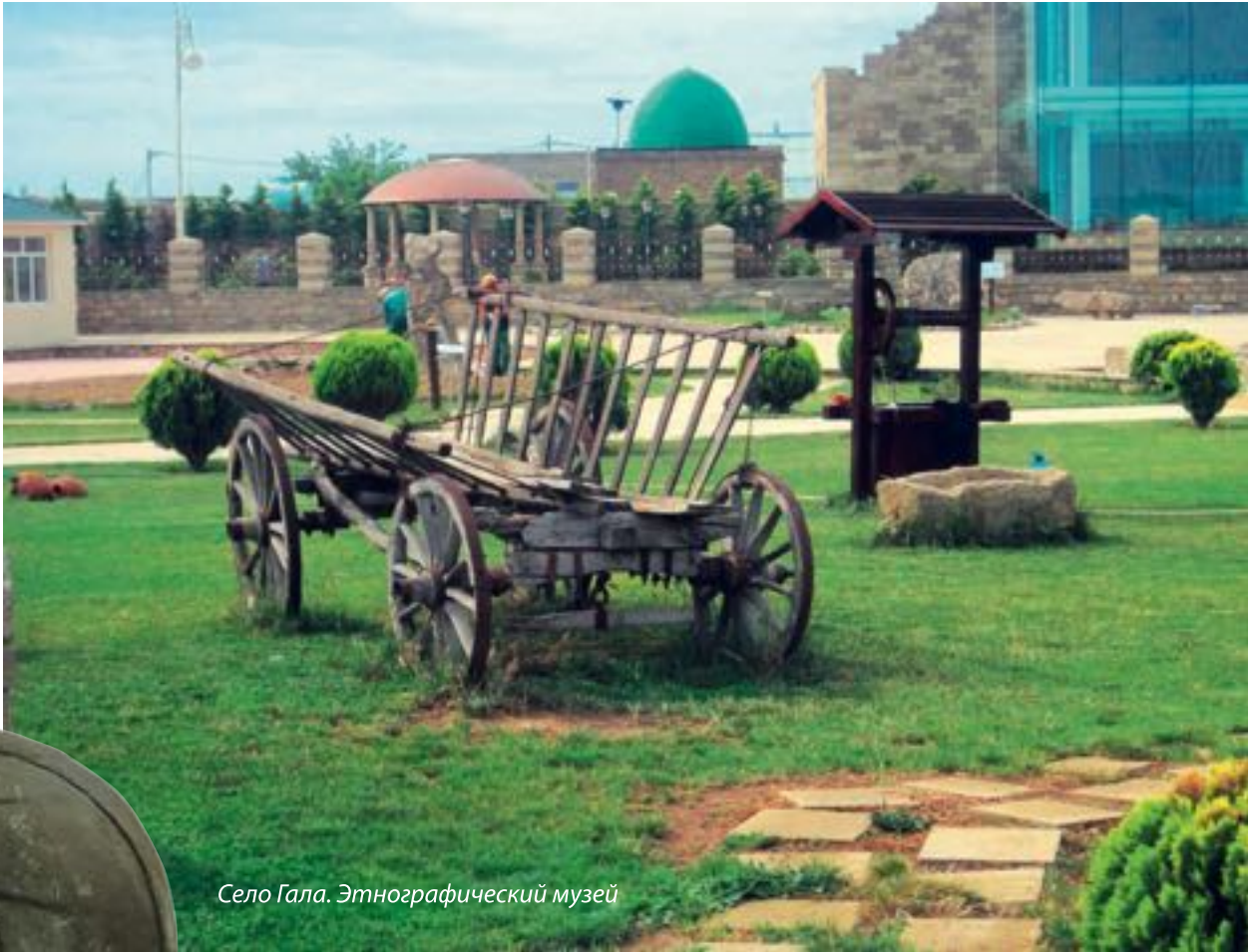
Село Гала. Этнографический музей

Государственный историко-этнографический заповедник Гала Заповедник охватывает старую, историческую часть поселка Гала и имеет площадь в 81,5 га. Здесь под охраной находится в общей сложности 216 памятников национального и местного значения, старейший из которых – поселение, относящееся к III тысячелетию до н.э. Среди архитектурных памятников – 5 мечетей, 3 бани, 4 овдана (подземные хранилища пресной воды), подземные кяризы (водотоки), развалины замка, усыпальница, захоронения, жилые дома. На территории заповедника также функционируют музей антиквариата и археолого-этнографический музейный комплекс. Музей антиквариата был учрежден в 2011 году на основе личной коллекции инженера и реставратора, филантропа, инвалида карабахской войны Шахида Хабибуллаева. Экспозиция музея в настоящее время состоит из почти 3 тыс. предметов. Археолого-этнографический музейный комплекс был создан в 2008 г. по инициативе и под руководством Фонда Гейдара Алиева. Здесь на тер-