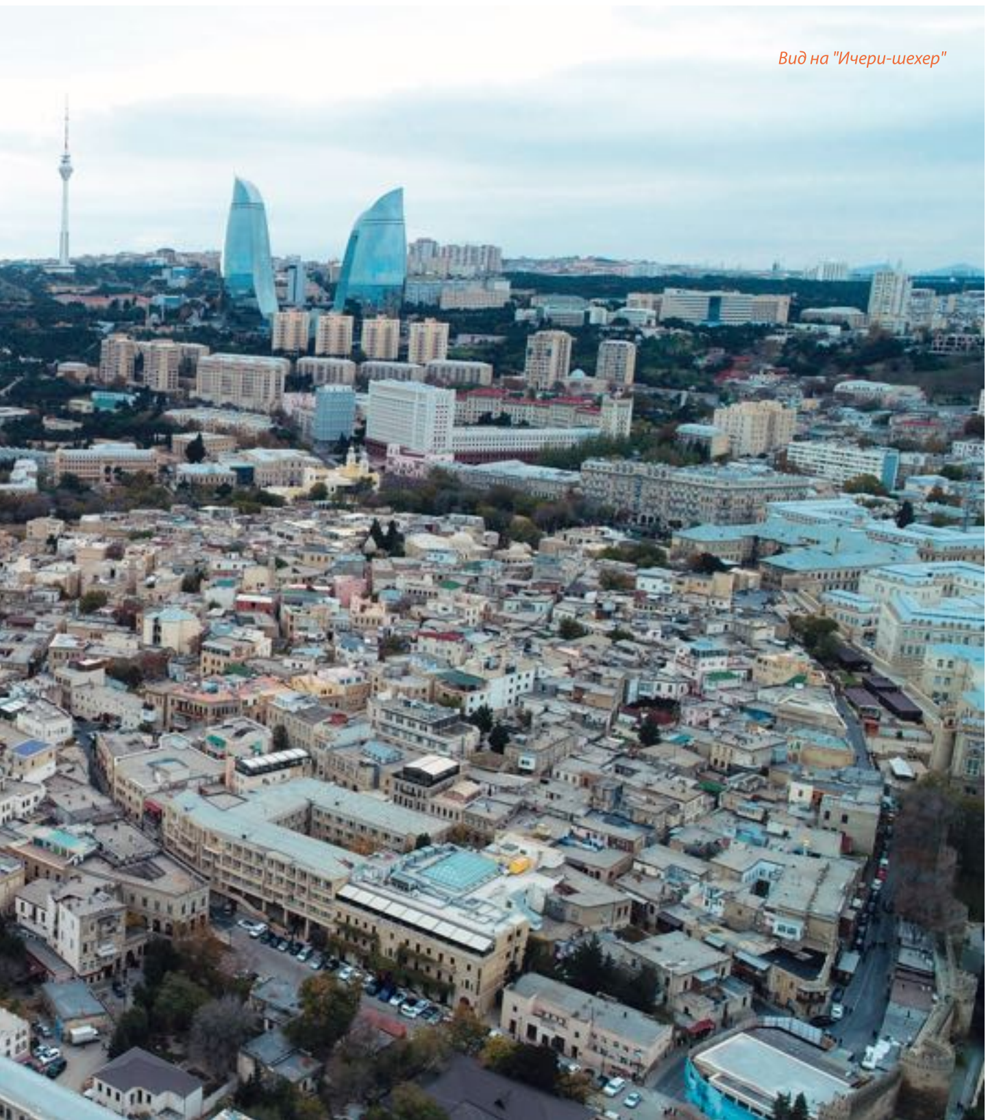
Вид на "Ичери-шехер"

включены в Список всемирного наследия. В настоящее время на территории государственного историко-архитектурного заповедника «Ичери-шехер» под охраной находятся 3 исторических