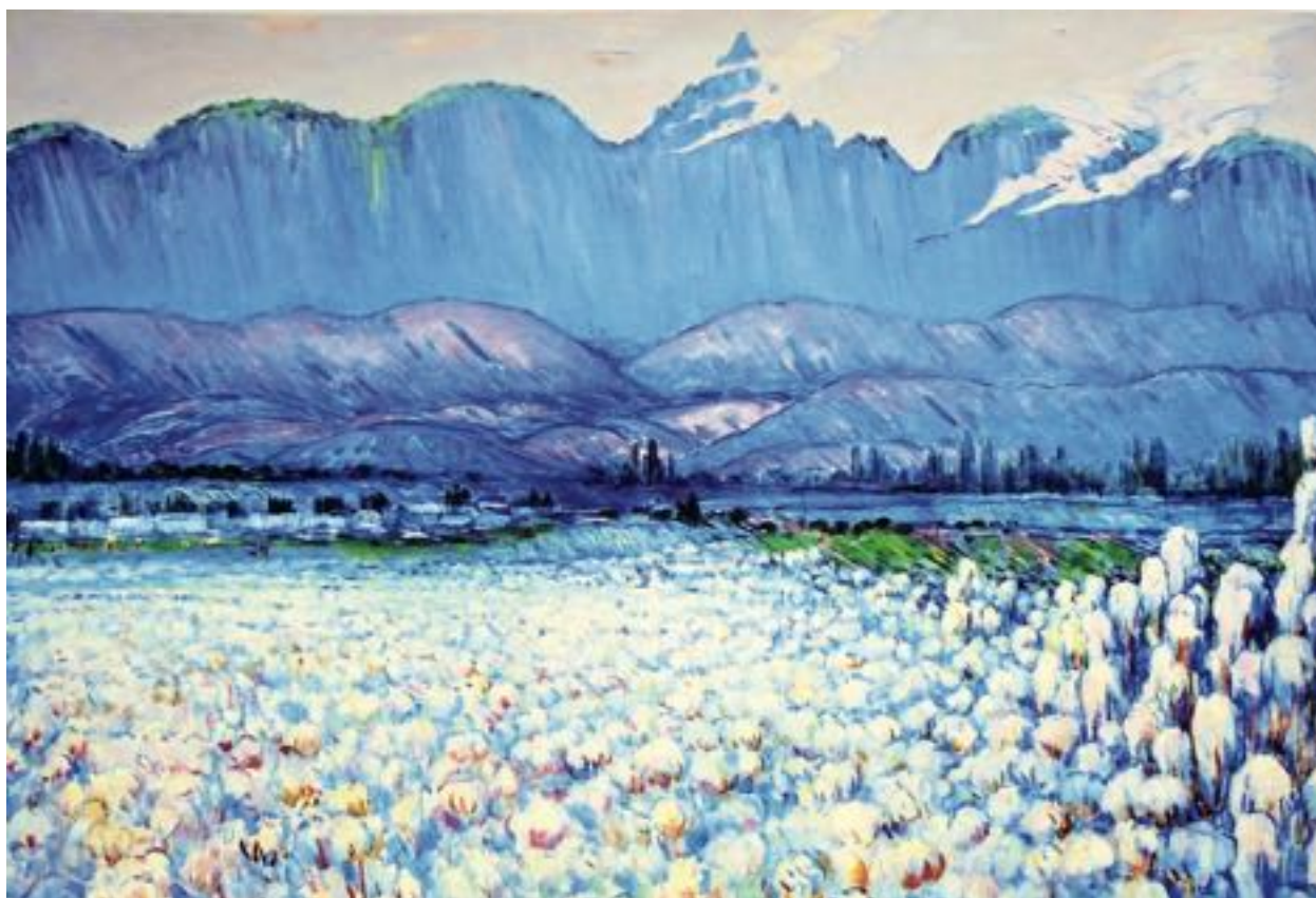
У подножия Боздага. 104 x 150 см. 1965 г.

Sattar Bahlulzade presented his people with a unique vision of nature, which embodied the traditions of Azerbaijan. Throughout his life, he drew inspiration from the landscapes of his native country, and this helped him find his own style. The nature is imbued with emotions in all his works. Sattar is the creator and prophet of oriental impressionism with its soft colors.