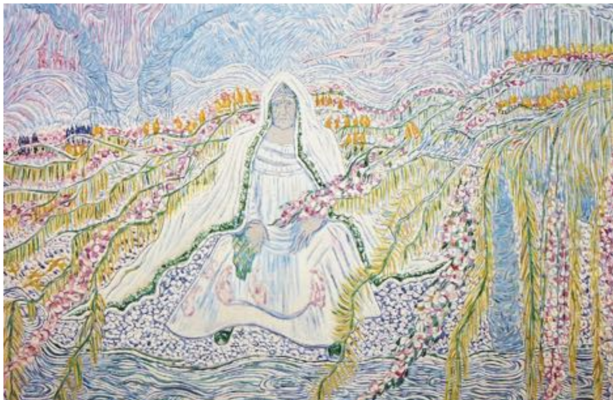
Моя мать. 200 x 230 см. 1972 г.