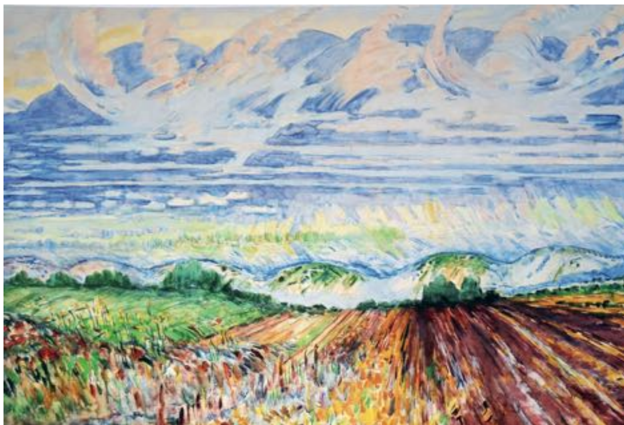
Исмаиллы. 103 x 150 см. 1964 г.