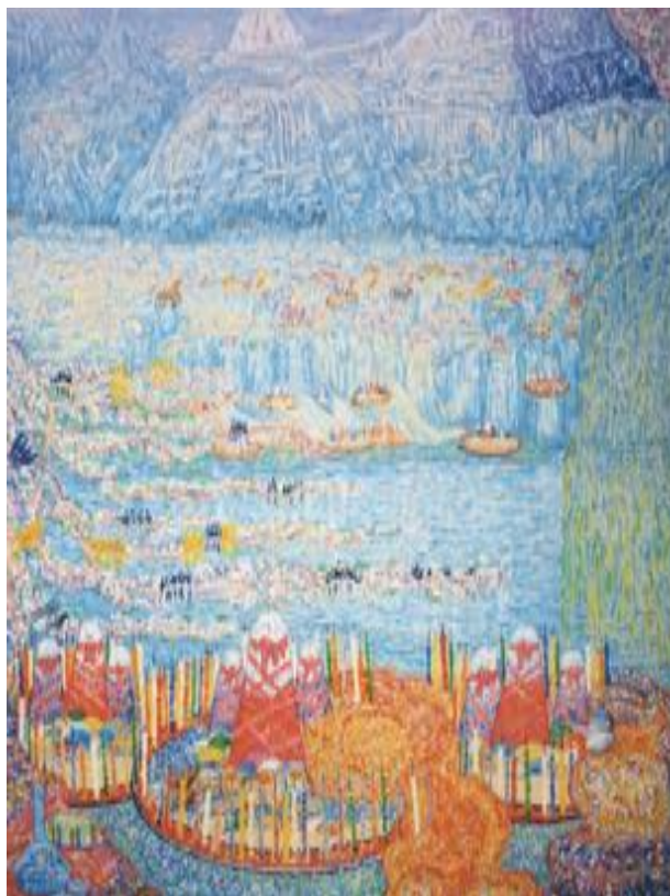
Азербайджанская сказка. 250 x 180 см. 1973 г.

Саттар Бахлулзаде подарил своему народу уникальное видение природы, воплощающее в себе традиции Азербайджана. Всю свою жизнь он черпал вдохновение от пейзажей родной страны, и это помогло ему найти собственный стиль. Природа в его изображении проникнута эмоциями. Саттар - создатель и пророк восточного импрессионизма с присущими ему мягкими красками. Азербайджанский импрессионизм - это очень мягкие цвета и свет, который исходит не только от солнца, но и из глубин земли, и от нас самих.