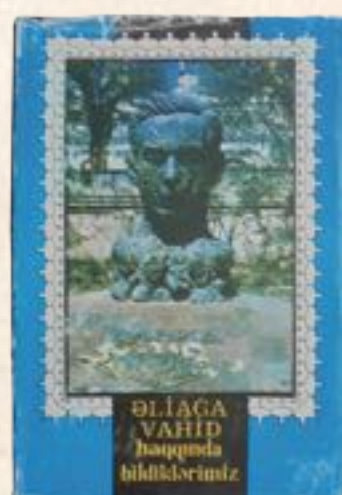
Обложки сборников стихов поэта и книги воспоминаний