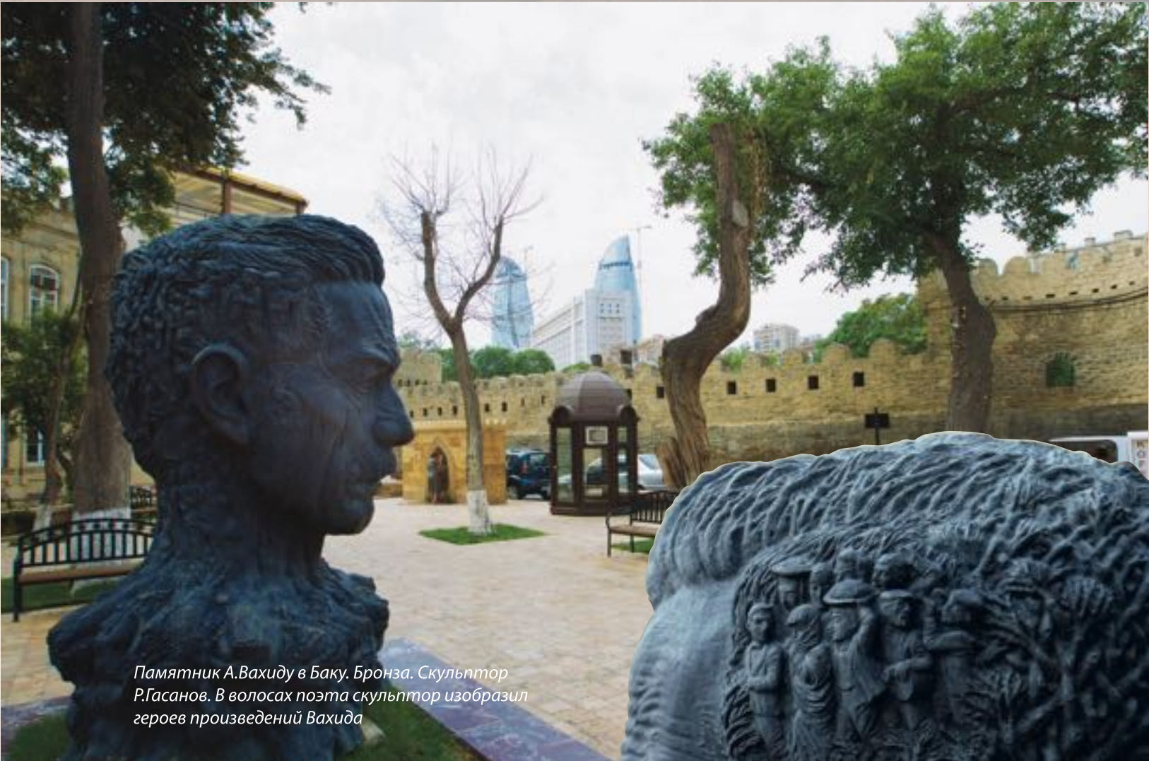
Памятник А.Вахиду в Баку. Бронза. Скульптор Р.Гасанов. В волосах поэта скульптор изобразил героев произведений Вахида

Mir Cəlal, Pənah Xəlilov. Ədəbiyyatşünaslığın əsasları. Ali məktəblər üçün dərslik. Bakı: Maarif, 1972. 280 s.