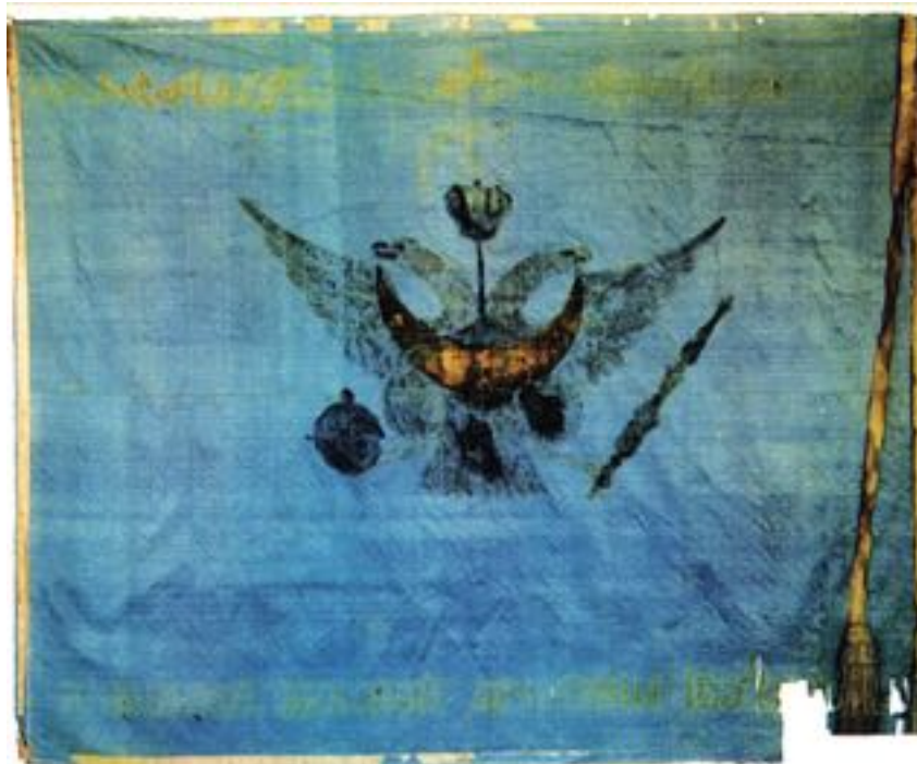
Боевое знамя Нахчыванской бекской дружины. НМИА