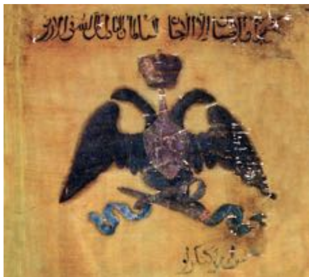
Боевое знамя конницы Кенгерли. НМИА