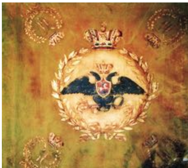
Почетное знамя конницы Кенгерли. Национальный музей истории Азербайджана (НМИА)

кампанию 1853 г. – победы под Ахалцихом и Башкадыкларом; в кампанию 1854 г. – победы на реке Чорох, на Чингильских высотах и при селе Кюрук-Дара; в кампанию 1855 г. – взятие Карса , с падением которого в ноябре 1855 г. прекратила существование Анатолийская армия Османской Турции.