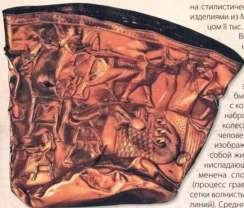
Знаменитая золотая чаша из Хасанлу дошла до нашего времени в расплюсненном виде. Левая сторона чаши

или же перекрытие башни обрушилось и погребло под собой захватчиков?