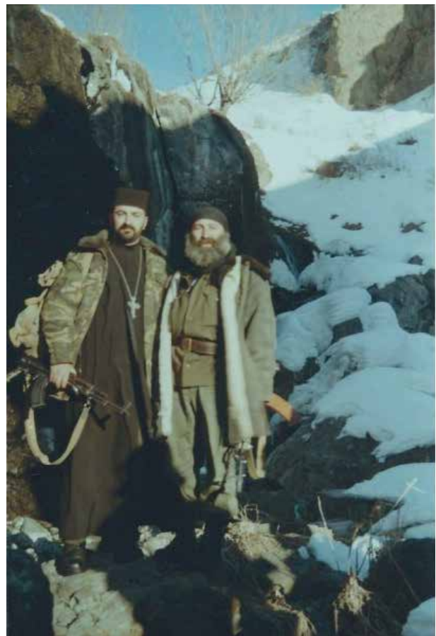
Армянский священник в горах Карабаха - с оружием в руках

Во второй половине 80-х годов прошлого века в СССР начались процессы дестабилизации и межнациональной розни. Одним из главных очагов напряженности стал Южный Кавказ, что обуславливалось главным образом территориальными притязаниями Армении к Азербайджану относительно Нагорно-Карабахской автономной области. Армянская церковь играла в этих событиях активную организаторскую и подстрекательскую роль. Согласно документам, вскоре после трагических февральских событий 1988 г. в Сумгайыте, 8-10 марта дьякон армянской церкви в Баку С.Давитян отправился в Эчмиадзин и побывал на приеме у католикоса Вазгена I, а затем имел встречу с иеромонахами Исаханяном и Мкртычяном, дьяконом Матевосяном. Последний из них интересовался обстановкой в Баку и Сумгайыте, причинами нейтральной позиции бакинских армян по карабахскому вопросу и заявил: "Они не способны на большие