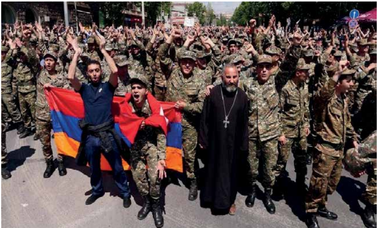
Армянские священники в первых рядах политических событий. Ереван, май 2018 года

Характерным фактом может служить создание непосредственно при Эчмиадзинском католикосате – руководящем органе армяно-григорианской церкви организации "Паторик", тесно связанной с дашнаками и призванной направлять религиозные чувства армян в