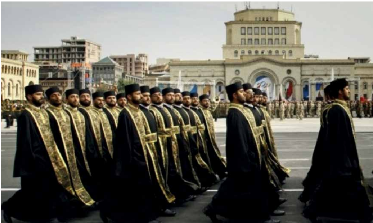
Армянские священники на военном параде в Ереване

16. Зав. особым отделом полицейской части канцелярии наместника на Кавказе полковник Бабушкин – начальникам губернских и областных