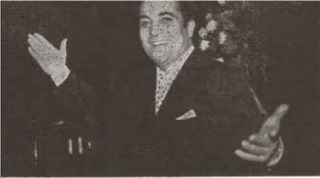
Azerbaycan'ın ünlü ses sanatçısı Reşid Bey Ankara'daki son konserinde.