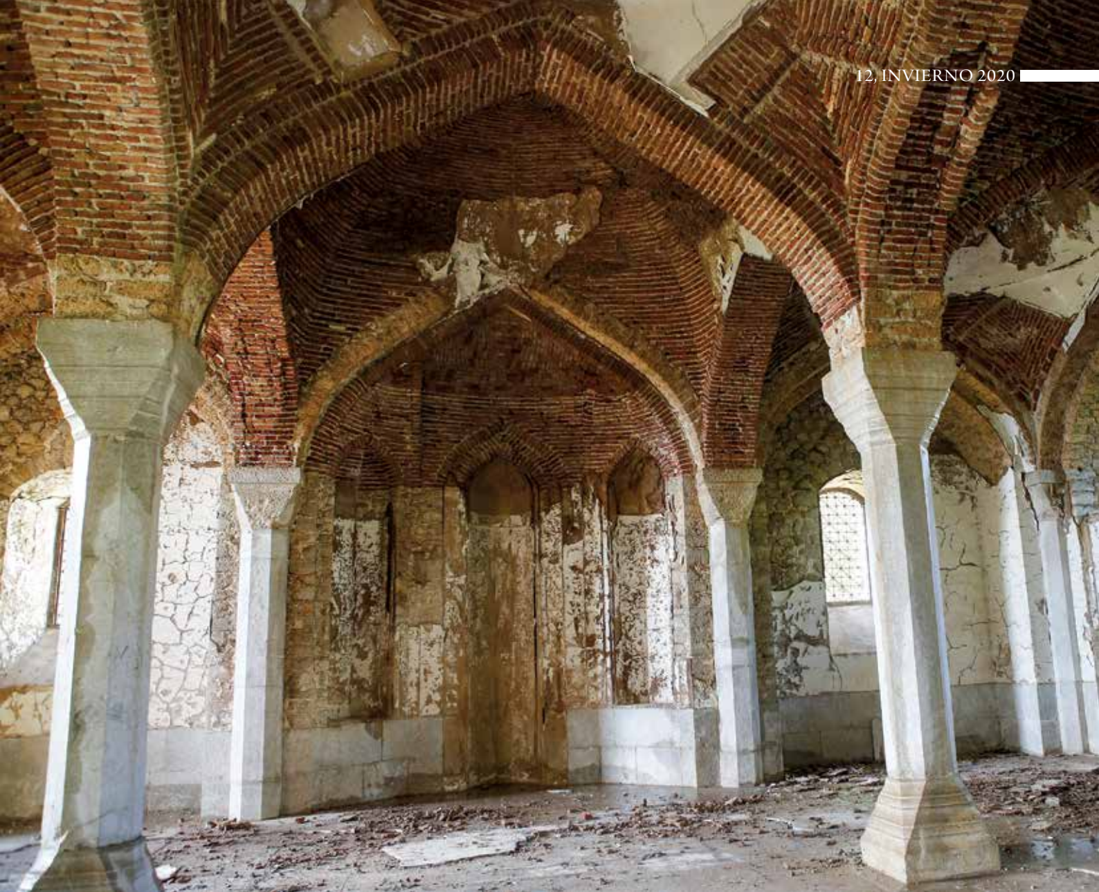
Mezquita Saatlı, destruida por los ocupantes armenios. Foto: 2005

A. E. Simonyan, al describir este monumento, distorsiona deliberadamente los datos. Escribe: “Los muros de la estructura, que son de planta hexagonal, se van estrechando gradualmente hacia arriba y terminan en una simple cornisa de losas planas” . De hecho, este mausoleo tiene una planta octaédrica, claramente visible incluso a simple vista en el dibujo publicado del monumento. Un enfoque subjetivo y sesgado llevó a A. E. Simonyan a declarar que «... los creadores de monumentos arquitectónicos musulmanes, en Armenia, fueron principalmente maestros armenios que combinaron los logros centenarios de la escuela de arquitectura armenia con los principios y requisitos de los clientes musulmanes» . Esta afirmación es pura falsificación de la Historia de Azerbaiyán, porque este territorio no formaba parte de Armenia y los armenios no vivían aquí. En segundo lugar, tanto en términos de la solución de pla-