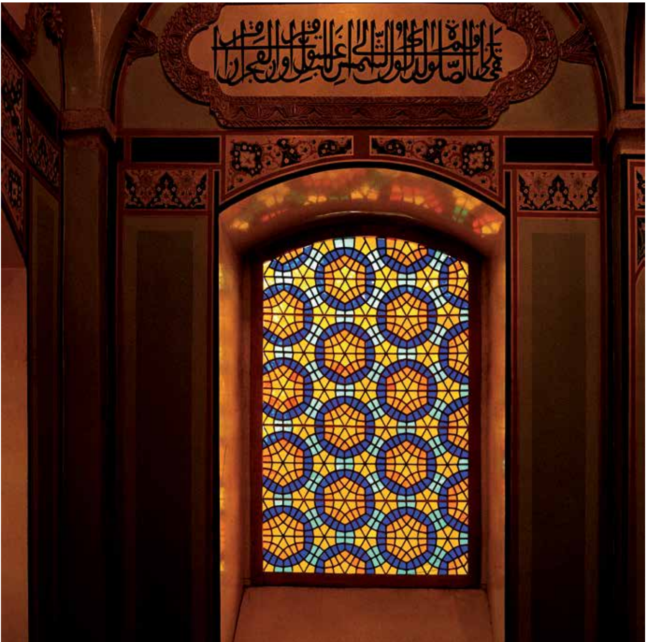
Mezquita de Saatlí en la ciudad de Shushá. Finales del siglo XVIII- comienzos del siglo XIX. Foto: finales de 1980

siguiente conclusión: “Las monedas de cobre representadas en la revista “Nuevo Oriente” se presentan de manera completamente incorrecta como unidades monetarias del siglo XIX a. C. De hecho, estas monedas (con inscripciones desgastadas) de los siglos XII-XIII. D. C., fueron emitidas por los atabeks de Azerbaiyán de la dinastía de los Idelguizidas (1133-1225 d. C.) y estaban muy extendidas en la Armenia medieval y las regiones adyacentes de la región Transcaucásica.