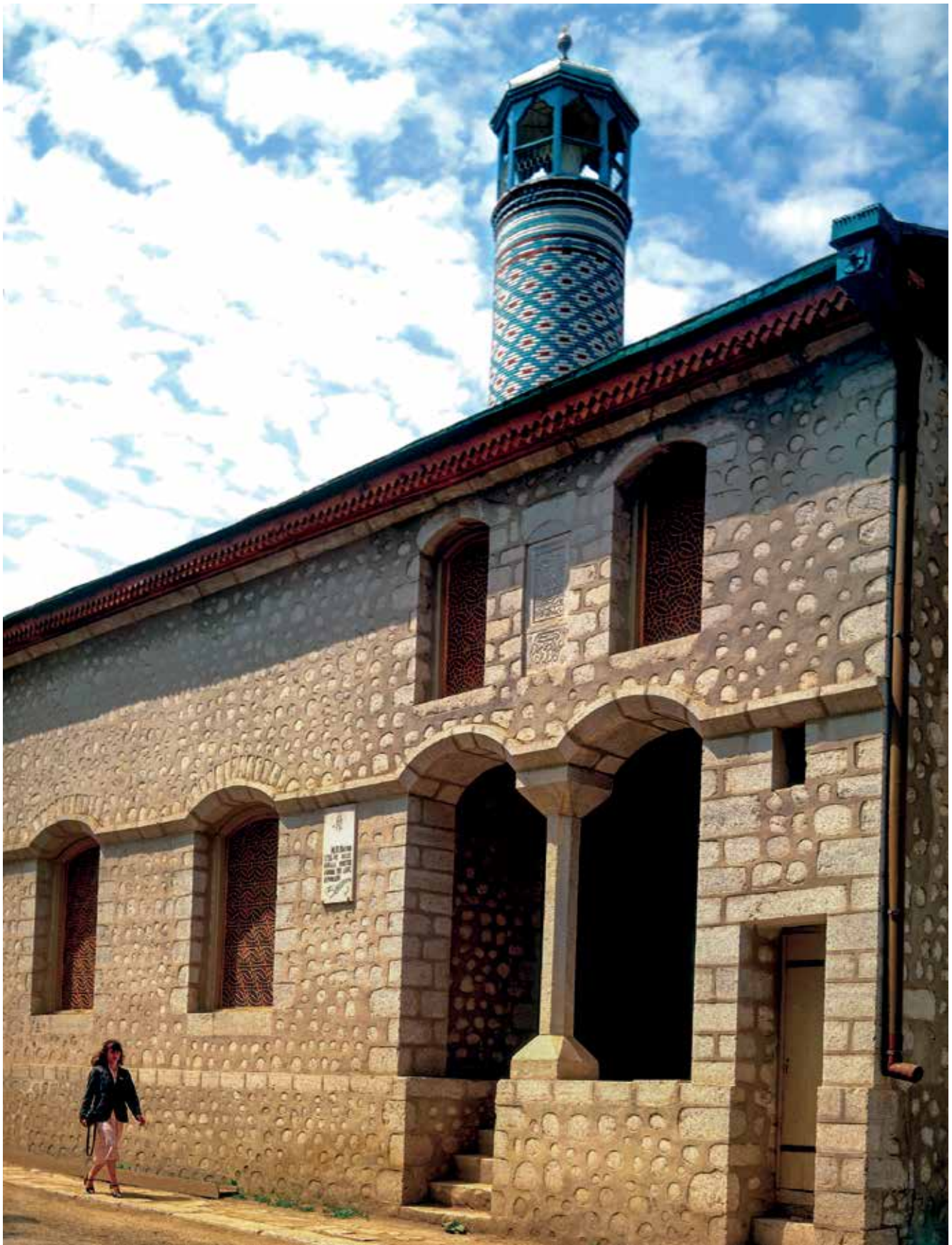
Mezquita de Saatlı en la ciudad de Shushá. Finales del siglo XVIII - comienzos del siglo XIX. Foto: finales de 1980