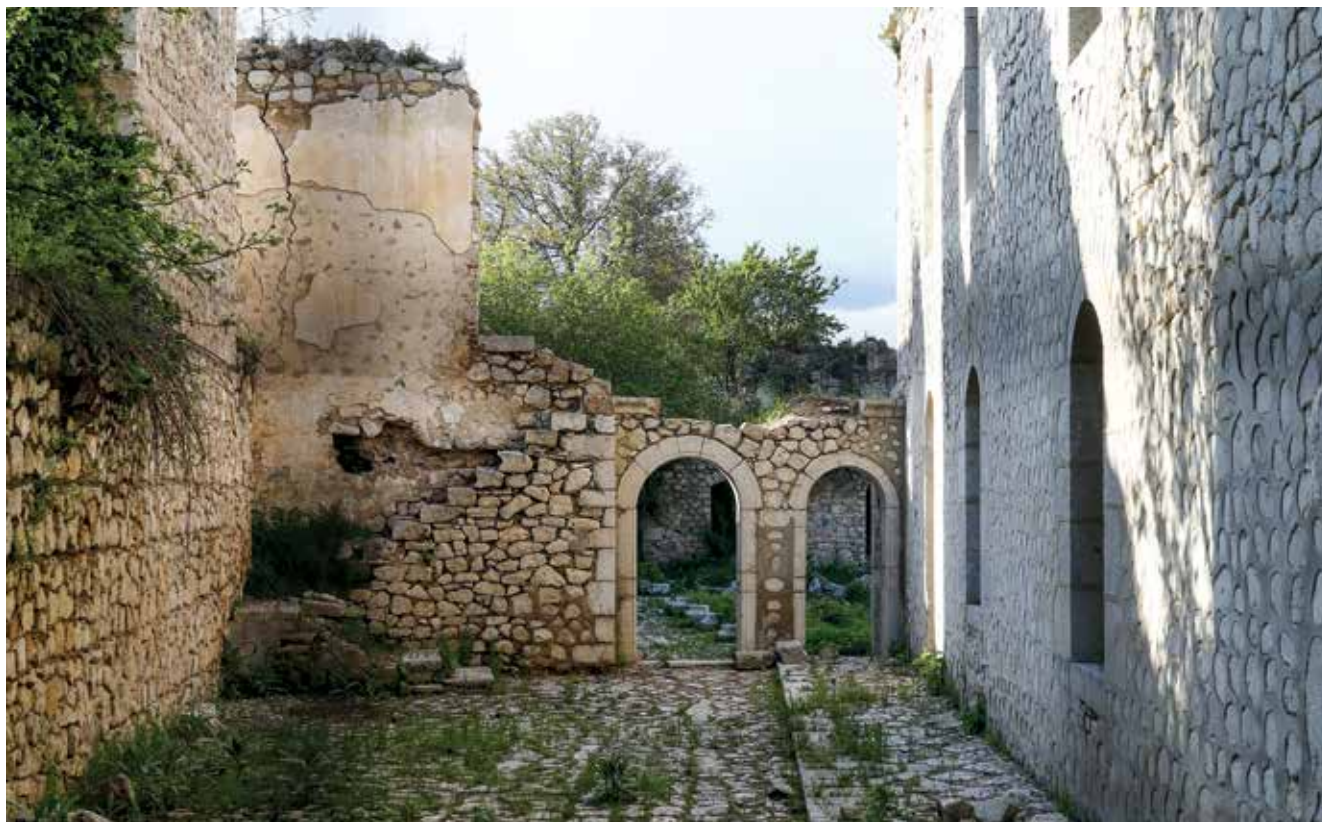
Médrese (escuela) ante la mezquita de Govjer-agá en la ciudad de Shushá- La primera mitad del siglo XIX. Foto: finales de los años 1980

prohibir, prevenir, detener y castigar cualquier acción para la destrucción deliberada de dicho patrimonio cultural es responsable de tal destrucción en la medida en que lo disponga el Derecho Internacional «. Por tanto, la destrucción deliberada de los monumentos histórico-culturales es contraria a las convenciones y declaraciones de la UNESCO. Sin embargo, la comunidad internacional no toma medidas para prevenir tales atrocidades.