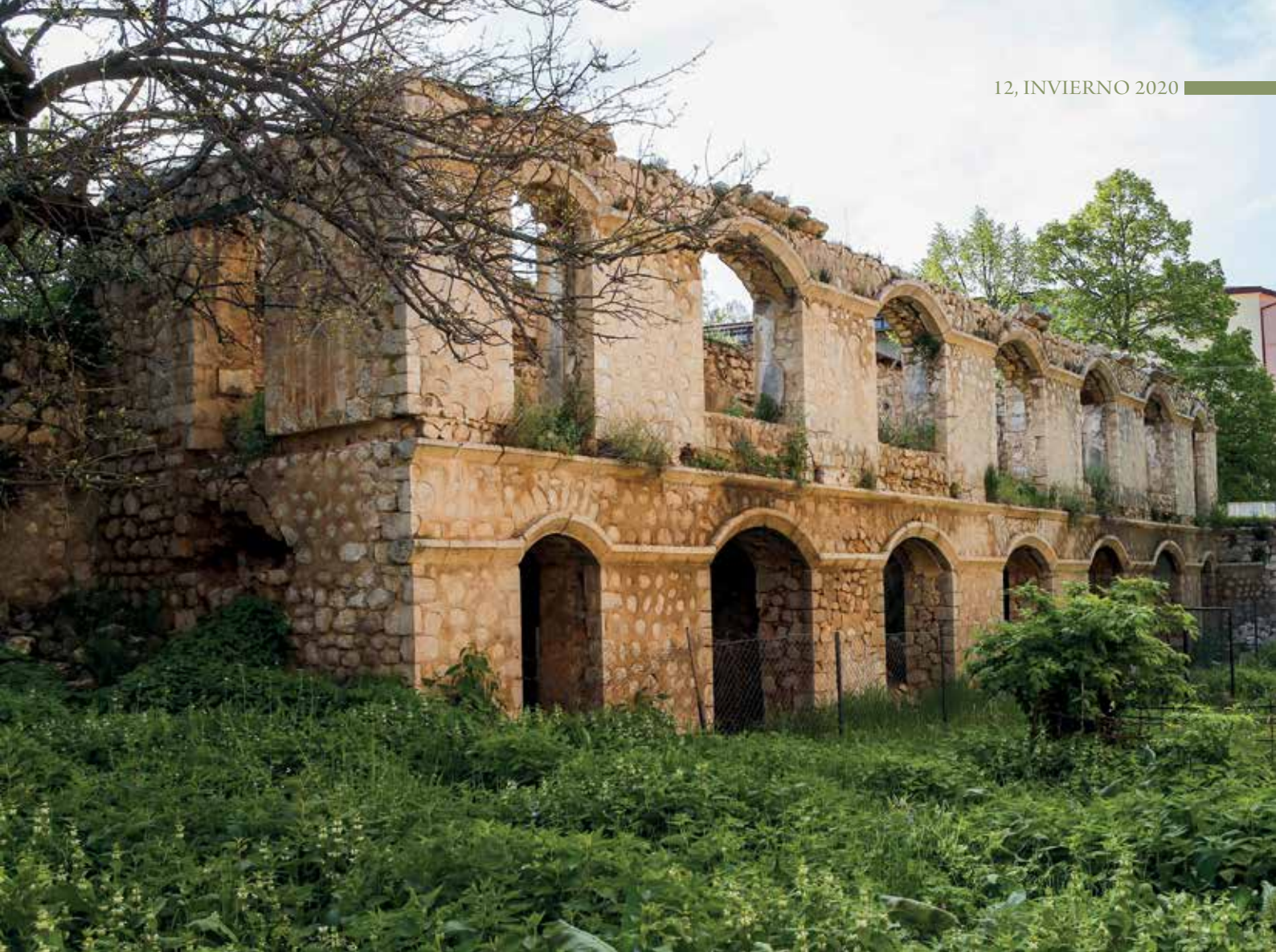
Médrese (escuela) ante la mezquita de Gevjar-agá, destruida por los ocupantes armenios . Foto del 2005