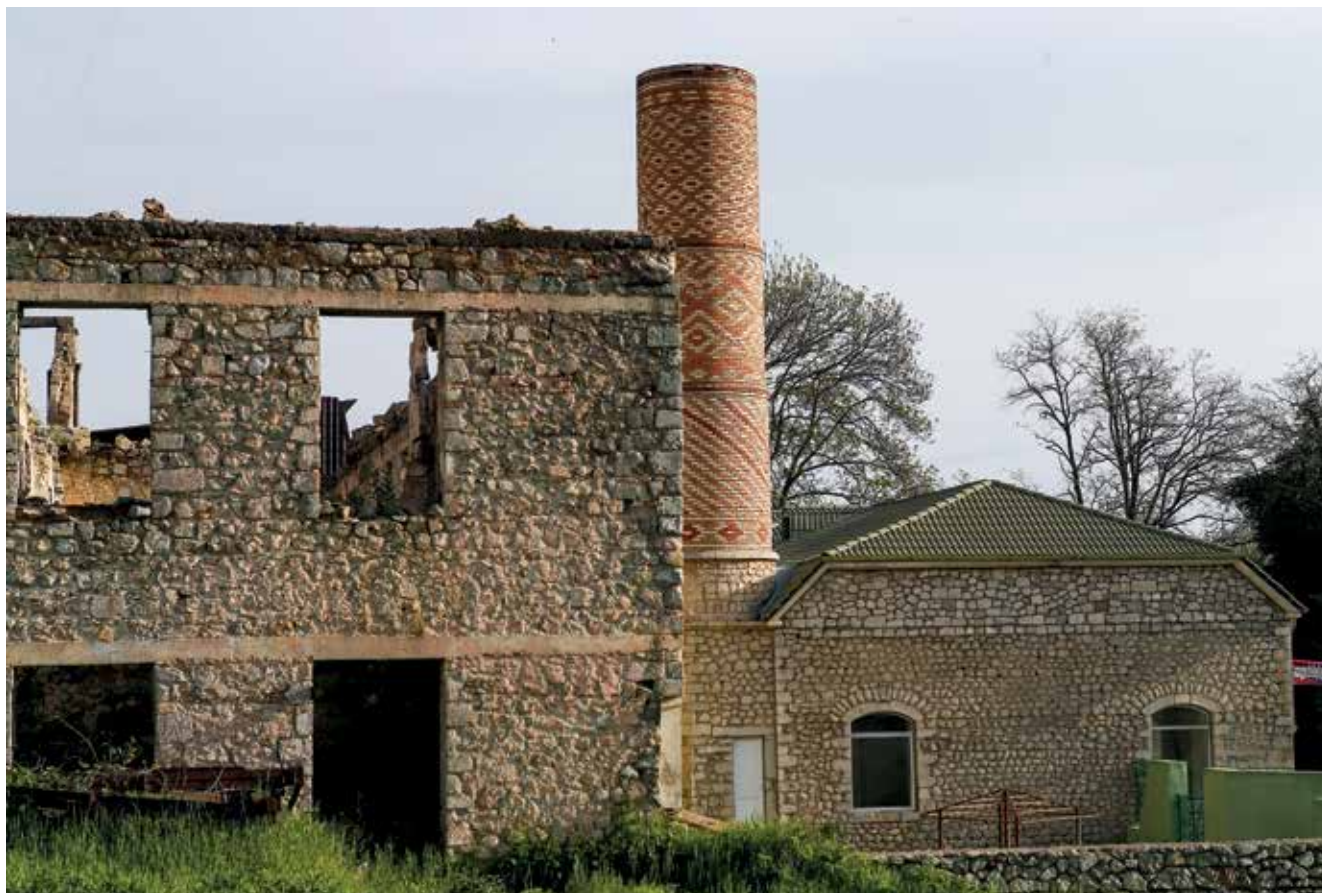
Mezquita Saatlı, destruida por los ocupantes armenios. Foto: 2005