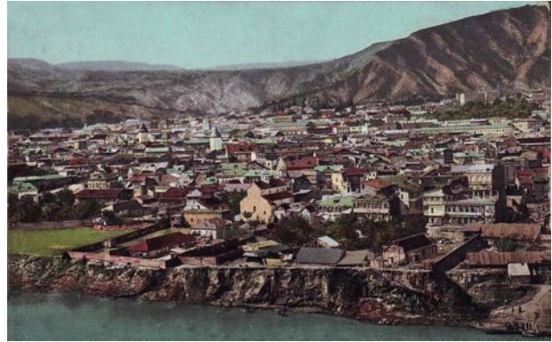
Тбилисский район Авлабари армянские авторы объявляют исконно армянским