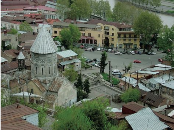
Армянская церковь в Тбилиси

занятиями населения Восточной Грузии. Время многое изменило: многие из различных классов грузинского населения превратились в известный элемент буржуазии. Теперь можно встретить грузин коммерсантов, людей свободных профессий. Но их очень мало. Многие из них даже не имели в Тифлисе избирательного ценза» (9, с. 5).