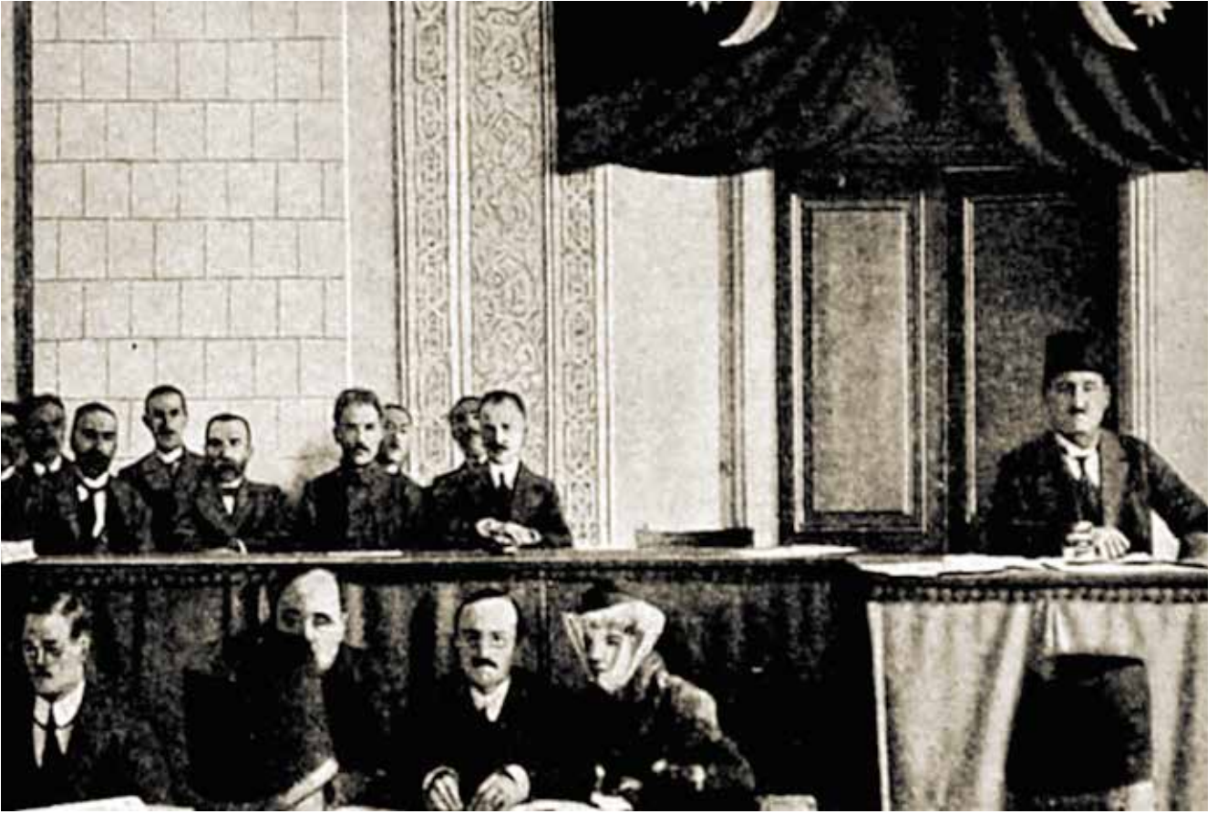
Azerbaycan Cumhuriyeti Parlamentosu'nun açılışı. 7 Aralık 1918

evini okul olarak kullanmakla başlar. 1896 yılında kız okulu açmak için yaptığı müracaat kabul edilmez. Fakat Zerdabi'nin önderliğinde Taçiyev, 1901 yılında Müslümanlar için kız okulu açmak üzere izin almayı başarır (Yeşilot, Zerdabi, 2012; 107, Başiroğlu, 2012; 11). Bu okul Zakafkasya'da (Güney Kafkasya) ilk kız okulu olarak tarihte yerini alır. Hanife hanım bu okulun ilk müdiresidir. Halk bu çalışmalarından dolayı Zerdabi'yi Kafkasya Müslüman Kadınlarının Manevi atası olarak anmaktadır (Yeşilot, 2010;107, Bünyadov, Yusifov, 2011; 645). XX. yüzyıl Azerbaycan edebiyatının seçkin yazarı, doğu dünyasının Şekispiri "Molla Nasreddin" edebi okulunun önderi Celil Mammedgluzade'nin (Celil Mammedguluzade-Azerbaycan'lı yazar, araştırmacı, gazetacı ve 'Molla Nesreddin' dergisinin editörü). Müslüman Türk kadınının o zaman ki hayatını ele alan mizahi şiirlerinde, makalelerinde kız çocuklarının erken yaşta evlendirilmeye, onların dokuz yaşlarından sonra eğitim almasının gereksiz görülmesi, evden dışarı çıkmalarının yasaklanması, kadın haklarının çiğnenmesi gibi durumları eleştirmiştir. Celil Memmedguluzade Azerbaycan kadının durumunu tiyatro sah-