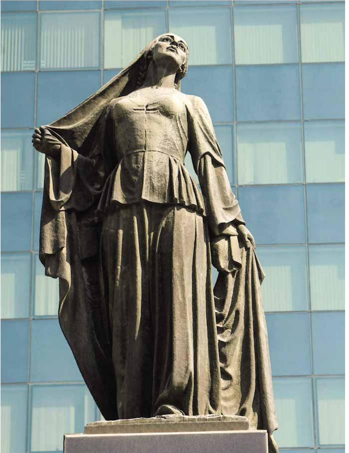
Özgür Kadın Heykeli. Heykeltıraş Fuad Abdurrahmanov. Bakü