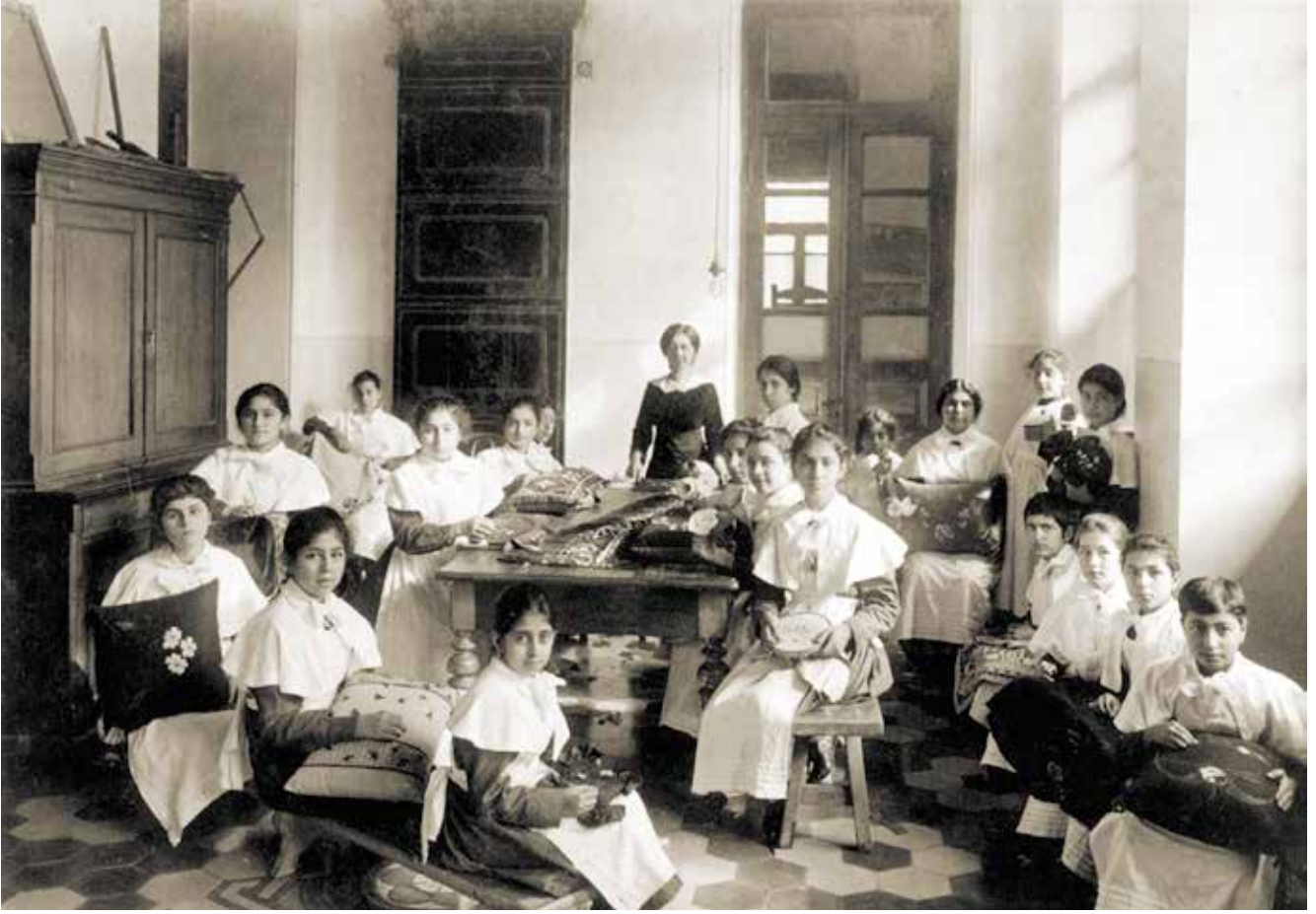
Müslüman Doğu'daki ilk kız okulunda ders anlatımı. Bakü, 1901