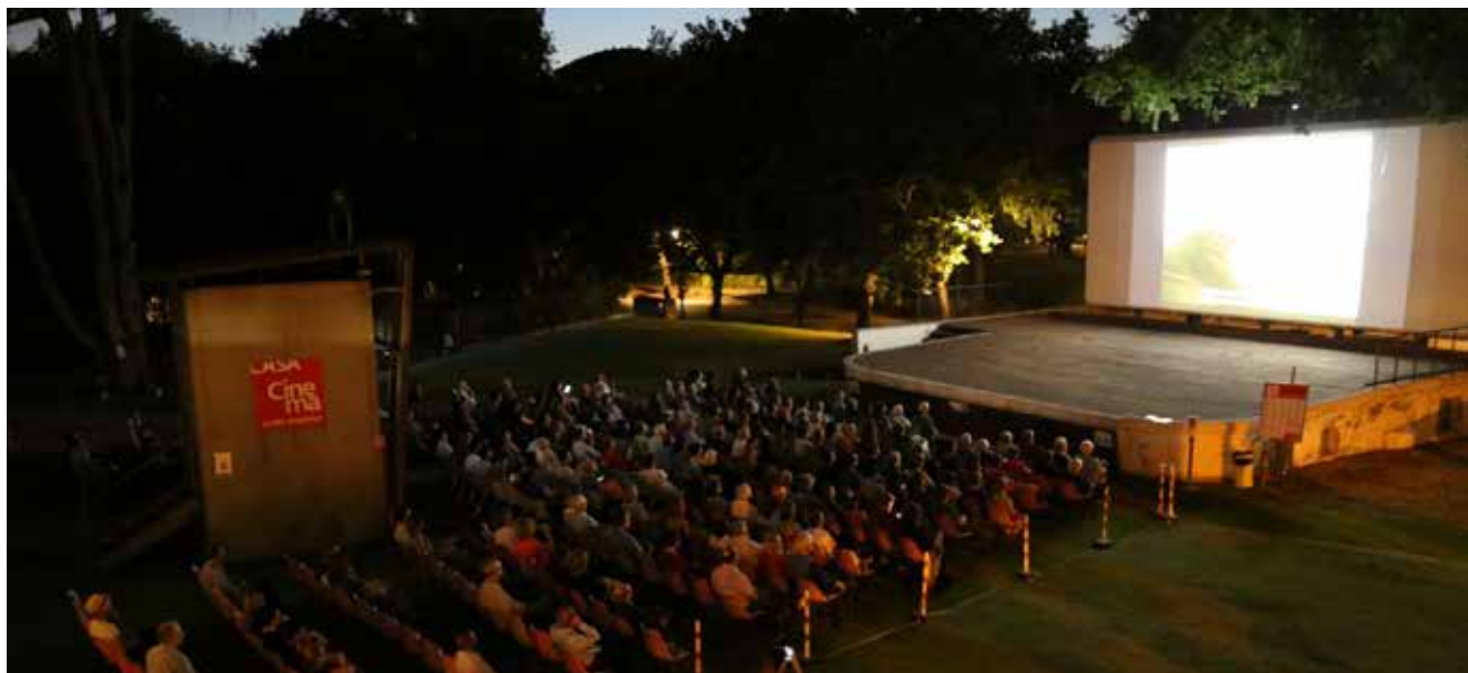
Seconda edizione del Festival del Cinema Azerbaigiano, Villa Borghese, Casa del Cinema, Roma, giugno, 2019

giano sono gli atenei romano della “Sapienza” e veneziano di “Ca’ Foscari”, nella cui offerta formativa figurano oggi insegnamenti di Storia dell’Azerbaigiano. Ca’ Foscari ha inoltre istituito una cattedra di lingua e letteratura azerbaigiana, coerentemente con l’ampio spazio tradizionalmente accordato agli studi linguistici e storici sull’area e a testimonianza del crescente investimento effettuato su un partner ritenuto strategico.