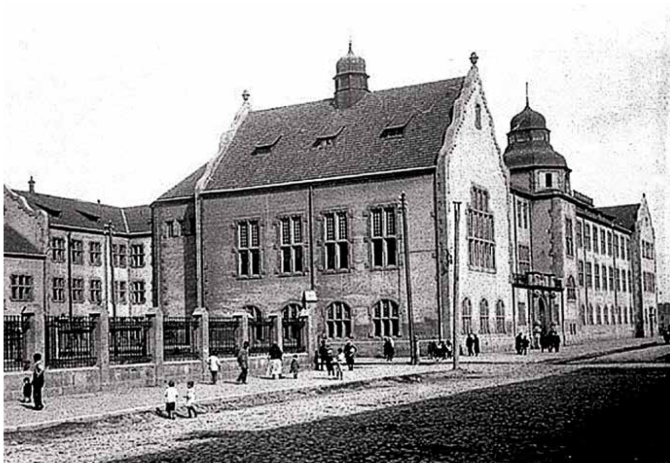
Tòa nhà đầu tiên của BSU - hình ảnh từ 1 bưu thiếp đầu thế kỷ 20

Năm 1918, lễ kỷ niệm 100 năm thành lập Cộng hòa Dân chủ A-đéc-bai-gian (ADR) - nước cộng hòa dân chủ và pháp quyền đầu tiên ở phương Đông và trong thế giới Hồi giáo, đã được tổ chức rộng rãi cấp nhà nước và trên thế giới. Đây là sự kiện lịch sử đặc biệt quan trọng đối với quốc gia chúng tôi. Năm 1918 được tuyên bố là Năm của Cộng hòa Dân chủ A-đéc-bai-gian. Trong những lễ kỷ niệm nhân dịp này, điều được lặp đi lặp lại là việc nhấn mạnh rằng