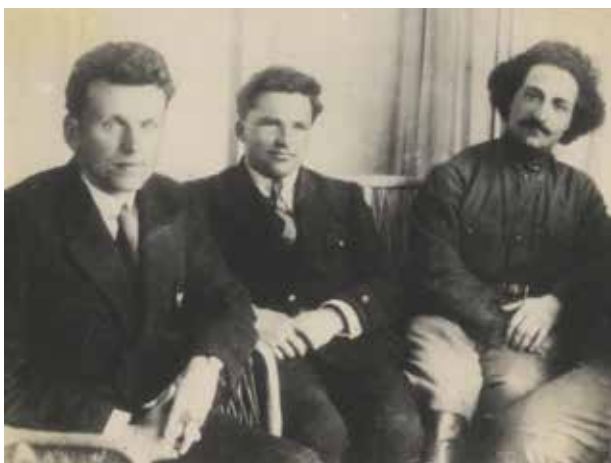
Члены Реввоенсовета XI Красной армии Ф.Ф.Раскольников, С.М.Киров, Г.К.Орджоникидзе. Баку, 1920 год

Захватив Азербайджан в апреле 1920 г., советская Россия продолжила операцию по «экспорту революции» на Южном Кавказе. Фактически Азербайджану была отведена роль плацдарма для распространения большевизма в Грузии и Армении , где тогда у власти еще находились местные национальные группы - соответственно меньшевики и дашнаки. Бакинская нефть была призвана сыграть роль эффективного рычага давления на эти республики.