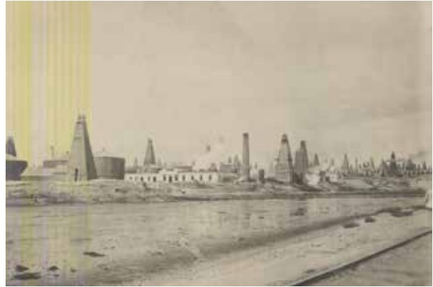
Мазутное озеро в поселке Сабунчи, вблизи Баку

Всего за 1920-1922 г. в Армению и Грузию по железной дороге было отправлено 171.900 т бакинской нефти (13), которая в данном случае обслуживала интересы РСФСР по насаждению в регионе советской власти. Не имея возможности помочь родственным режимам Грузии и Армении непосредственно ввиду собственной экономической слабости, советская Россия делала это с помощью военно-политических рычагов за счет природных богатств Азербайджана. С интересами же самого Азербайджана при этом мало считались. Поставки нефти в Армению, Гру-