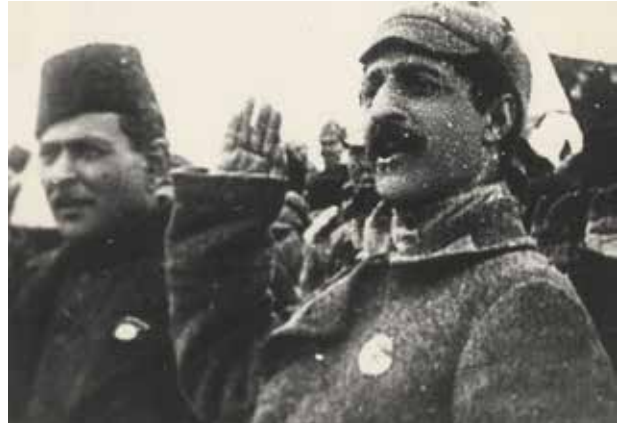
Председатель Совнаркома АзССР Н.Нариманов и член Реввоенсовета Кавказского фронта Г.К.Орджоникидзе на параде войск Красной армии в Баку. 1920 год

В первые годы нефть шла в Армению бесплатно, однако преодолеть топливный голод в стране все не удавалось. Председатель советского правительства Армении А.Мясников в дополнение к отправленным в июне 1921 г. нефтепродуктам просил еще 5 цистерн бензина. Кроме того, постпред Армении в Азербайджане И.Довлатов обратился с письмом в «Азнефть»: «Ввиду переживаемого в Армении острого кризиса с нефтепродуктами, просим Вашего распоряжения об отправке... указанного количества керосина, нефти и бензина в самом срочном порядке, вне всякой очереди» (5). В течение одного только 1921-го года в Армению было бесплатно отгружено 1,6 миллионов тонн нефти (6). В следующем году начальник треста «Азнефть» А.Серебровский подписал с армянским правительством договор сроком до