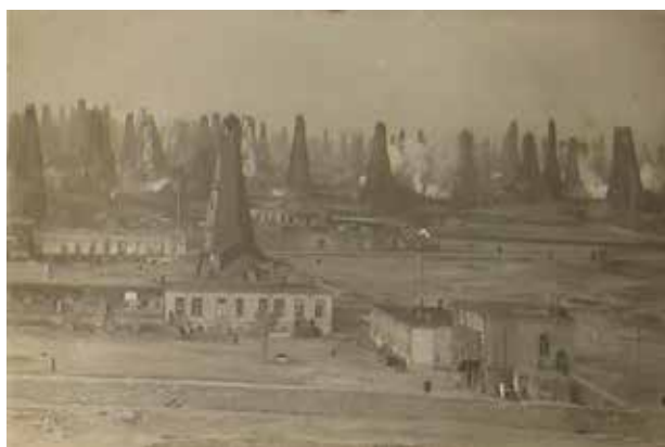
Общий вид нефтепромыслов в поселке Сабунчи, окрестности Баку

ние рынки преимущественно шли в последние две республики. Соглашение также оговаривало передачу всех экспортно-импортных операций в руки Объединенного внешторга, тем самым не позволяя впоследствии Азербайджану самостоятельно продавать нефтепродукты на Южном Кавказе (14).