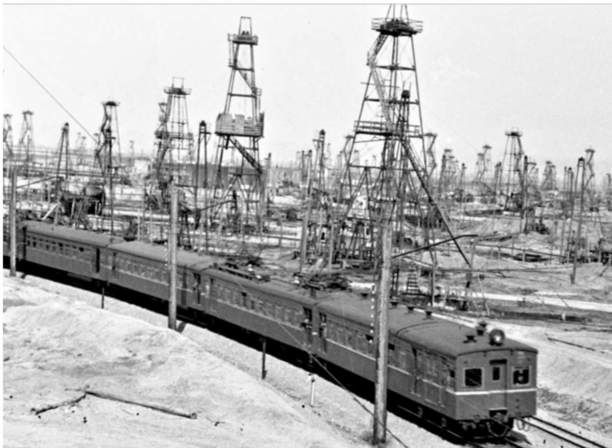
Электропоезд на бакинских нефтепромыслах. Середина 1930-х годов

ской и торговой. Процесс пристегивания республик Южного Кавказа к советской России шел в различных сферах, ведущим же было экономическое направление, в котором Азербайджану с его нефтью отводилась главная роль.