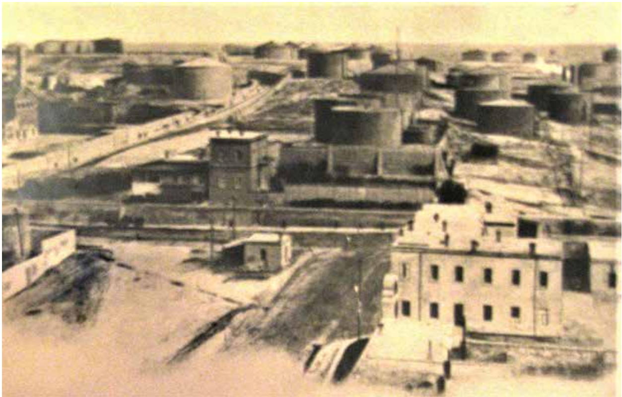
Керосиновые резервуары в "Черном городе" Баку

С целью дальнейшего укрепления контроля над республиками Южного Кавказа большевистское руководство РСФСР поставило задачу объединить их под видом добровольного союза. Еще до советизации Армению и Грузию Россия заключила с советским руководством Азербайджана ряд договоров, предусматривавших слияние различных сфер политической и экономической жизни двух государств. Таким образом, Азербайджан терял и без того урезанную самостоятельность во многих областях, в том числе экономиче-