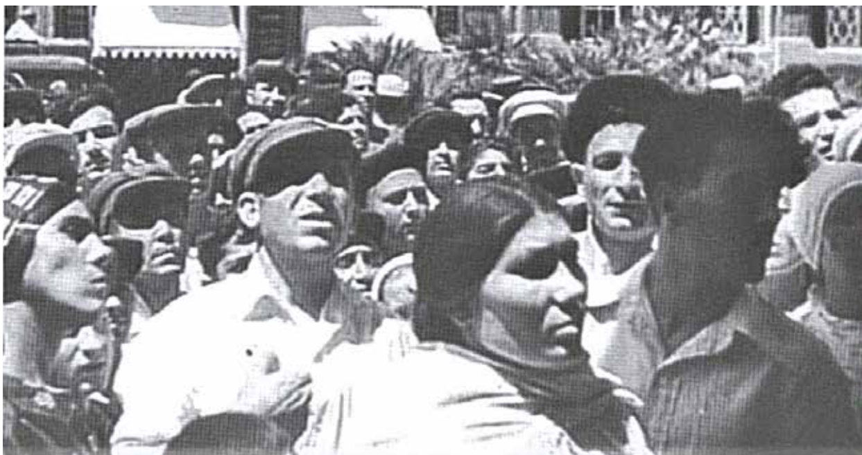
Жители Баку слушают сообщение о начале войны

Сказанным не исчерпываются негативные демографические последствия войны для азербайджанского народа. Нельзя забывать о снижении рождаемости . Из-за недоедания матерей в годы войны