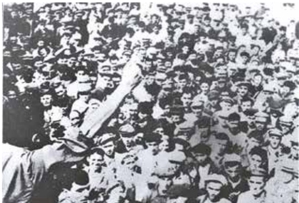
Митинг в Баку в связи с началом войны

В 1941-1945 гг. из Азербайджана на фронт отправилось в общей сложности 681 тыс. человек – каждый пятый житель 3,4-миллионной республики, из них 300 тыс. не вернулись в свои дома, к родным и близким. Помимо этого, в народное ополчение записалось 186,7 тыс. человек, а еще из 15 тыс. человек было сформировано 87 истребительных батальонов и 1124 отряда самообороны, перед которыми ставилась задача бороться с вражескими диверсантами, помогать органам правопорядка в обеспечении стабильности, а главное – привлекать граждан к военному делу и прививать военные навыки.