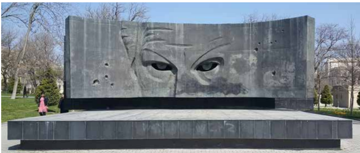
Памятник разведчику, Герою Советского Союза Рихарду Зорге в Баку