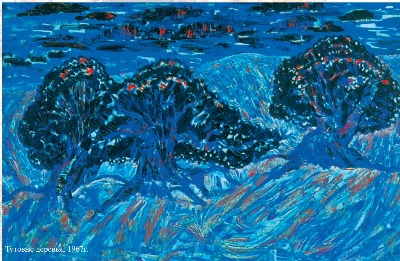
Тутовые деревья, 1967г.

глубины души. Увековеченные на холсте рукой мастера, те же чувства будят они и в зрителе.