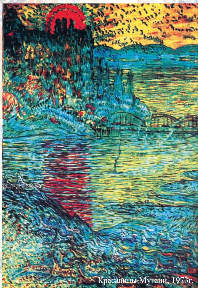
Красавицы Мугани, 1973г.

Натура никогда не была всевластна над Саттаром. Полные аналоги написанных им пейзажей едва ли существуют в реальности. На полотне отображал он не самый предмет, но именно ощущения, при виде этого предмета возникающие. Вот почему в произведениях Саттара природа так чувственно-ярка и фантастична. Изображенные художником горы, водопады, памятники архитектуры под его кистью воплощались в некие символы. Все же произведения его в совокупности являют собой обобщенный поэтический образ нашей Родины.