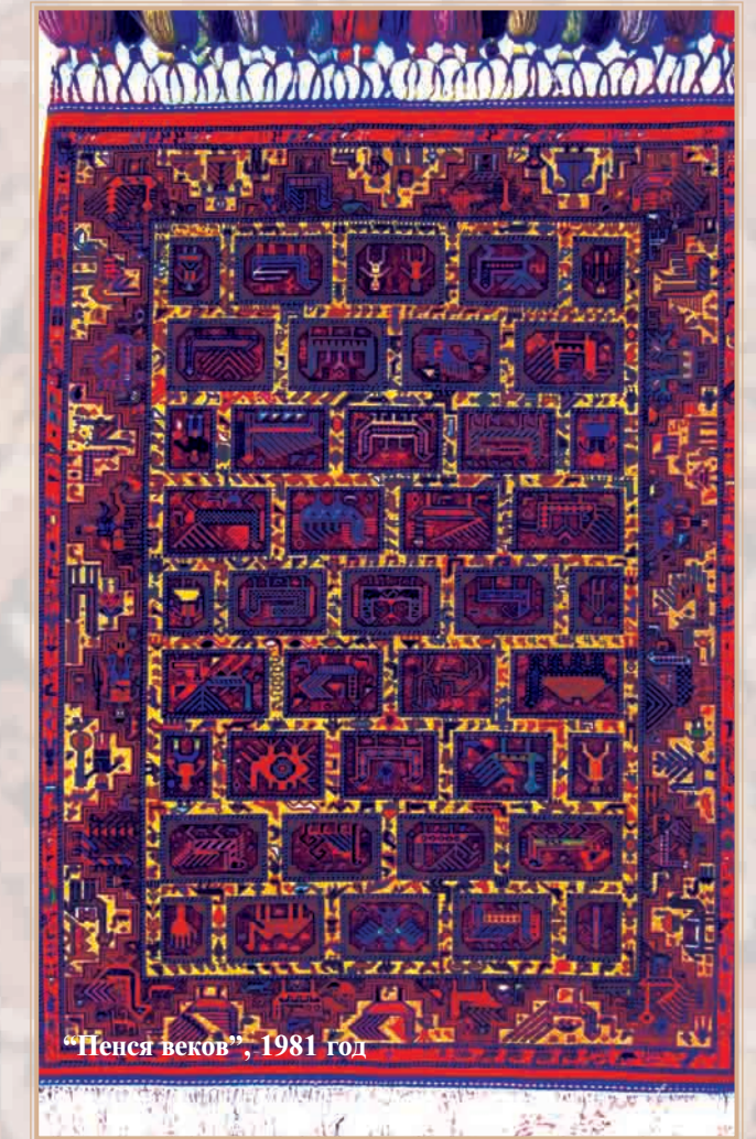
"Пеня веков", 1981 год

Ляtif Керимов сыграл огромную роль в обновлении орнаменталистики ковров. Он, используя уникальное наследие азербайджанского народа, вел упорные творческие поиски новых орнаментальных композиций,