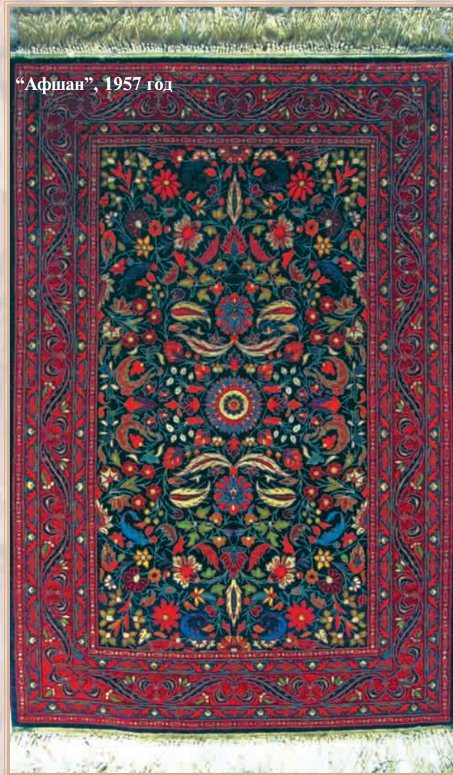
"Афшан", 1957 год