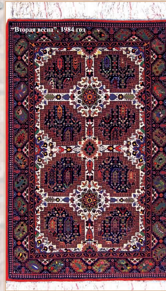
"Вторая весна", 1984 год

байджанской науки о ковроделии. Он прямо и четко высказал мысль о непреходящей ценности коврового искусства, о его глубокой, древней связи с исторической культурой азербайджанского народа, непреходящи заслуги мастера в четкой идентификации азербайджанского ковра.