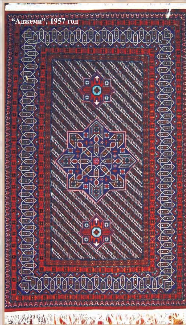
"Аджеми", 1957 год

Л. Керимов по праву считается основателем азербайджанской науки о ковроделии. Он прямо и четко высказал мысль о непреходящей ценности коврового искусства, о его глубокой, древней связи с исторической культурой азербайджанского народа, непреходящи заслуги мастера в четкой идентификации азербайджанского ковра.