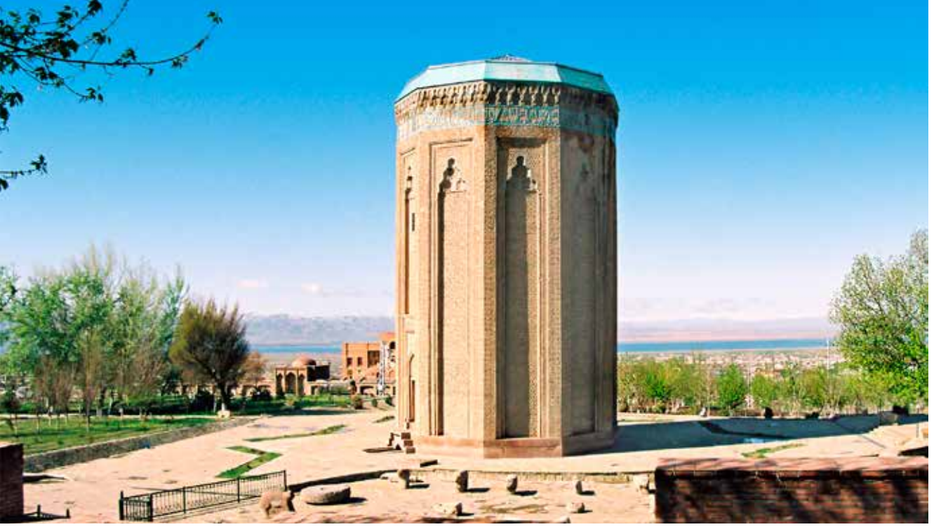
Nahçıvan'da Mömine Hatun türbesi. XII. yy.

Fetihleri sırasında, Selçuklular art arda Horasan, İran, Irak, Anadolu ve Ortadoğu'nun diğer ülkelerini, Alparslan ve Melik Şah döneminde ise Azerbaycan'ı fethetti. Ancak başta, kuzeydeki Şirvan olmakla, ülkenin bazı bölgeleri bağımsızlıklarını korumayı başarmıştı. Söz konusu dönemin kültür gelişmesinde, ortak kültür gelenekleriyle belirlenen ortak eğilimler açıkça görülmektedir. Siyasi istikrar, ekonomik yaşamın iyileşmesi ve kültürel faaliyetin sürdürülmesi için ortaya çıkan koşullar, ülkede mimari ve sanatsal yaratıcılığın geliştirilmesine itici güç oldu (1). Selçuklular dönemi toplumsal ve ideolojik gelişme, Azerbaycan'ın ortak mimari çizgisinde ortaya çıkan sanatsal eğilimlere yansımıştır. Bu dönemin elverişli kültürel ortamı, önceki yüzyılların sanatsal ve teknik deneyimin ve geleneklerinin yerel mimari ve sanat okulları şeklinde kalıplaşmasına olanak sağladı.