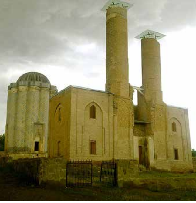
Nahçıvan'da "Karabağlar" mimari külliyesi. XII. yy.

ki, bu dönemden savunma, sosyal ve dini karakterli mimari anıtlar – camiler, kuleler, kaleler, kervansaraylar, evler, odanlar- günümüze kadar korunmuştur (2). Ortak tarih ve kültür sayesinde Azerbaycan'ın mimarlık abidelerinin benzeri Orta Asya, Gürcistan, İran anıtları arasında sadece mimari ve planlama açısından değil, aynı zamanda, inşa tekniği, inşaat malzemeleri ve yapı olarak da bulunuyor. Azerbaycan, Orta Asya ve İran ustaları, kendi ülkelerinin dekoratif el sanatları geleneklerini sentez ederek, mimaride seramik kaplama yöntemlerini yaratıcı şekilde uyguluyorlardı . Desenlerin ortaya çıkması – ilk bakışta görünmeyen bir gizemdir. Desenlerin bağımsız olmadıkları, süsleme yoluyla hizmet ettiği için sanatın arka planında kaldığı söylenir ve bu kabul edilebilir. Ancak, eğer desen gerçekten canlı ve dolgun ise, üstelik herhangi bir yüksek sembolü taşıyorsa, o zaman o, sanat eserine yeni bir soluk vermektedir (3).