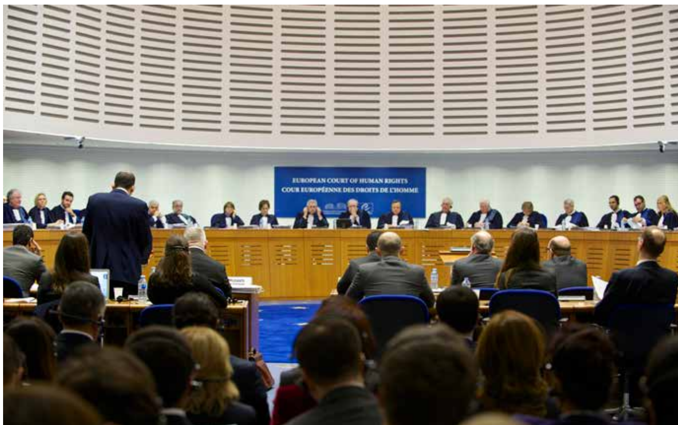
Vista sobre el caso “Chiragov y los demás contra Armenia”

Un elemento esencial de vital importancia para este asunto es la responsabilidad estatal que reside en la obligación de cesar las violaciones, garantizar que estas no vuelvan a suceder, y finalmente reparar íntegramente los perjuicios causados. En consecuencia, Armenia tiene la obligación de, en primer lugar, poner fin a la ocupación de los territorios de Azerbaiyán y retirar inmediata, completa e incondicionalmente sus fuerzas armadas de esos territorios. El cumplimiento de dicha obligación, con la que se crearían las condiciones necesarias para el retorno de los azerbaiyanos desplazados a sus hogares, de ninguna manera puede ser considerado o introducido como un compromiso con el objetivo de que pueda ser utilizado como moneda de cambio en el proceso de arreglo del conflicto.