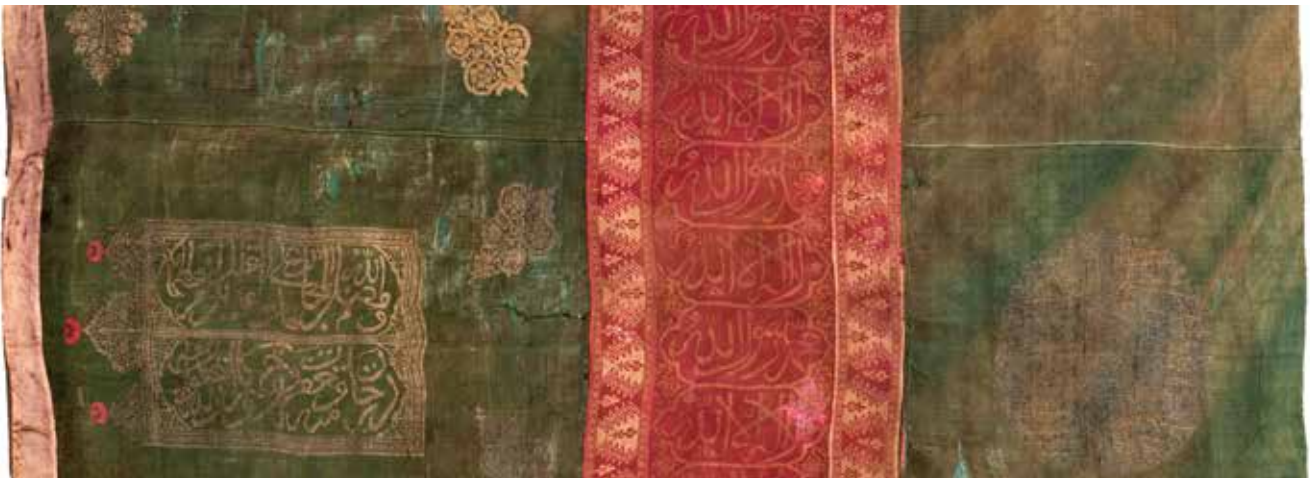
Gence Hanlığının bayrağı. Azərbaycan Milli Tarih Müzesi

Mızrağın alt kısmında bir delik bulunuyor, muhtemelen, buraya bileğe takılan deri kordon takılıyordu. Uç kısım, mızraktan 2 cm. dışarıya çıkan figürlü altı kanattan oluşuyor. Şeşperin üst kısmı döküm küre ile tamamlanıyor. Kanatlar ve küre de yaldızla işlenmiş desenle kaplıdır. Küçük ve zarif işleme, şeşperin başlangıçta bir savaş silahı değil, bir hakimiyet sembolü olarak yapıldığını göstermektedir. ❁