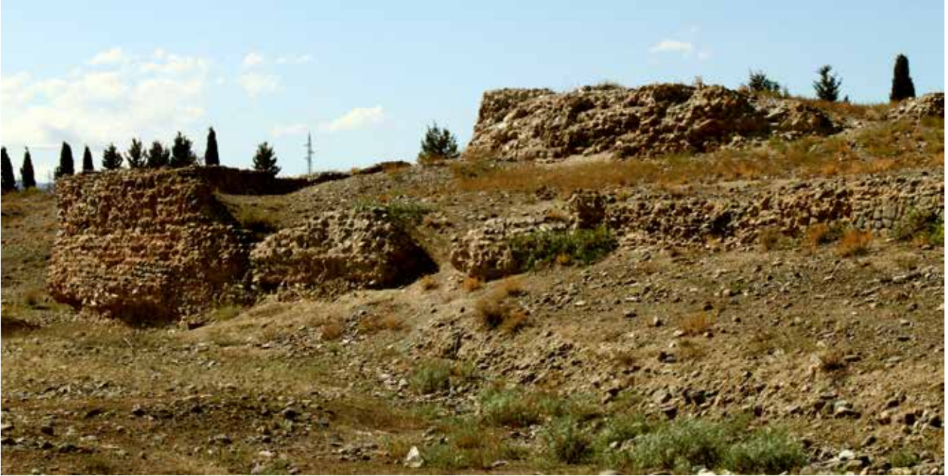
Eski Gence kale duvarlarının kalıntıları. Mevcut durumu

G ence şehri önemine göre Azerbaycan'ın ikinci büyük kenti, ülkenin batısında yer alan büyük sanayi ve kültür merkezidir. Bu eski kentte insanlığın ne zamandan beri meskun olduğu bilinmemektedir. Genceçay vadisinin olumlu coğrafi koşulları sayesinde insanların bu bölgede Neolit çağından itibaren iskan etmişlerdir (M.Ö. 7-6. yy.). Gillidağ adlı ilkel