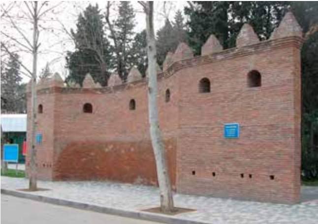
XVI yüzyıla ait kale surlarının korunmuş kısmı. Güncel foto

Gencevi'nin eserleri de o döneme tesadüf eder.