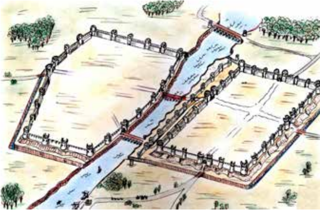
Gence XIII yüzyılda. İ.Caferzade'nin planı üzerine S.Ahmetov'un tablosu

letler meydana geldi. 944 yılında Arran'ın merkezi olan Berde şehri Slav saldırıları sonucu dağıtıldı. Gence şehri o tarihten itibaren Arran'ın başkenti oldu. Başkent olduktan sonra şehir daha da genişledi ve daha güçlü kale duvarlarıyla çevrelendi.