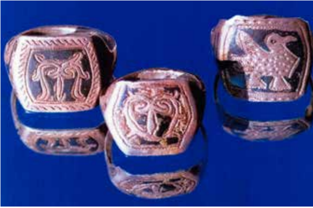
Zanaat örnekleri: yüzük

(12, s.35). Devrimden önce, Kazan kabilesinin (12, s.35) adına ilişkin olarak Kafkasya'da 24 yer adı, Nahçıvan'da Kazancı köyün de dahil olmak üzere Azerbaycan'ın guberniyalarında 10 oykonim mevcuttu.