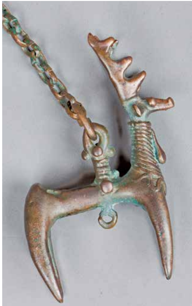
Бронзовая подвеска I тыс. до н.э., найденная в Азербайджане НМИА. Такие стилизованные животные часто встречаются на азербайджанских коврах

« Парча-палас » – материя, широко использовавшаяся дервишами, которые, в соответствии с суфийским верованием, вели нищенскую и от-