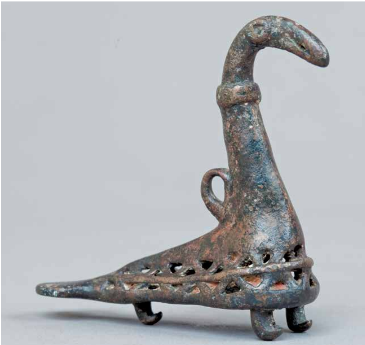
Бронзовая птица – колокольчик I тыс. до н.э., найденный в Азербайджане. НМИА. Стилизованные птицы часто встречаются на азербайджанских коврах

на целую неделю оставляли под открытым небом для того, чтобы он «увидел» небо и звезды и исполнил желание.