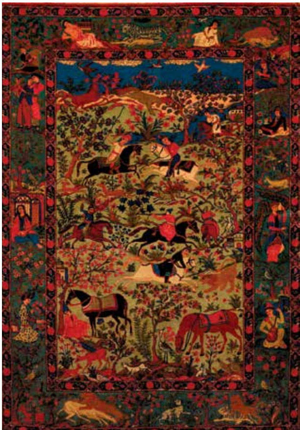
На азербайджанских коврах сюжеты бывают как простыми, так и многофигурными. Тебризский ковер XIX века «Хосров и Ширин». НМИА

воспринимался как символ зарождения жизни, плодородия, процветания, долголетия, здоровья. В Передней Азии уже в I тысячелетии до н.э. широкое распространение получают медальоны, розетки, орнаменты с изображением лотоса. Геометрические изображения лотоса часто встречаются в орнаментации азербайджанских ковров в виде мотива, называемого «буйнуз» (рог). Их аналоги мы видим на древнем Пазырыкском войлочном ковре.