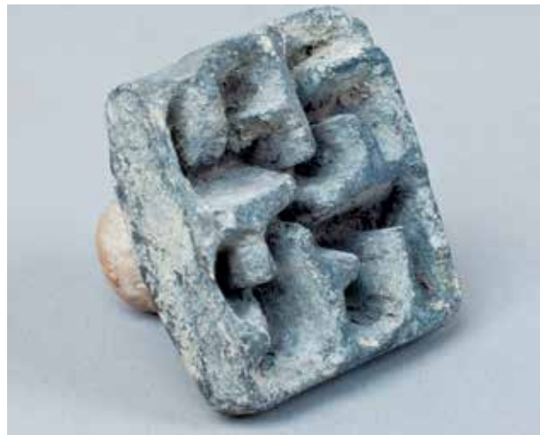
Глиняная печать II тыс. до н.э., найденная в Азербайджане. Национальный музей истории Азербайджана (НМИА). Свастика – один из древнейших символов, встречающихся в Азербайджане

Следует отметить, что, как и в случае с геометрическими орнаментами, мотив дерева чаще встречается на ковровых изделиях домашнего обихода, изготовленных на дому для собствен-