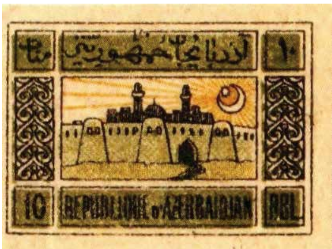
Un des timbres de la série «La citadelle». Musée national d'histoire d'Azerbaïdjan

plusieurs teintes, du blanc au brun sale. La couche de colle pouvait être régulière, en bande ou avec des cloques. Les nuances des timbres présentaient des variations sur l'ensemble des séries, ainsi que des altérations des couleurs complémentaires. On constate des défauts et des fautes d'impression (2, p. 14; 3, p. 20)