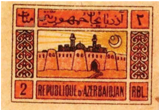
Un des timbres de la série «La citadelle». Musée national d'histoire d'Azerbaïdjan

rues Samed Vourgoun et Azi Aslanov). L'ancienne Lithographie, par la suite imprimerie Orient rouge, poursuivit ses activités jusqu'en 1991 (5, p. 20; 7, p. 42).