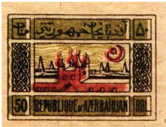
Série « L'Atechgakh de Soukharani ». 1919. Musée national d'histoire d'Azerbaïdjan

25 roubles (2, p. 15) et fut repris plus tard sur le timbre de 50 roubles, dont nous rappellerons ci-dessous la naissance.