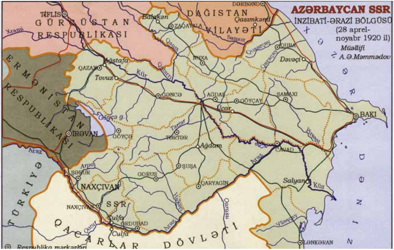
1920-1921 yıllarına ait Sovyet haritalarında Zengezur Azerbaycan sınırları dahilinde yer almıştır

Karabağ ve Zengazur'a yönelik askeri operasyonlarla tamamlanacaktı.