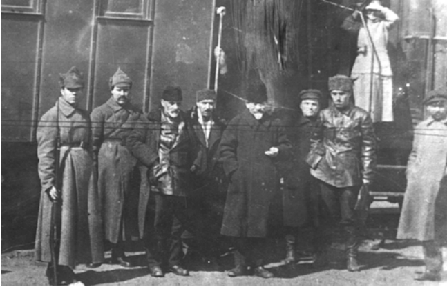
Her defasında Azerbaycan'na karşı alınacak karar öncesi Bakü'ye çok sayıda üst düzey devlet görevlileri gönderilmekteydi. Onlardan biri olan M.Kalinin Bakü Garı'nda. 1924.

tanımak zorunda kaldılar 16 . Zengezur sorununun ise 1921 yılının yazına kadar ertelemek zorunluluğu ortaya çıktı. Zira bu dönemde Njde'nin birlikleri harekete geçmiş, 25 Kasım 1920 tarihinde bu bölgede Sünik Özerk Cumhuriyeti kurmuş, 27 Nisan 1921 yılında bu cumhuriyetinin ismini Dağlık Ermenistan Cumhuriyeti olarak değiştirmiştir. Şubat sonuna doğru Gürcistan'da Sovyet hakimiyetinin kurulması ve 1921 yılı Nisan ayı başlarında İrevan'da Bolşevik hakimiyetinin yeniden tesis edilmesi sonrasında Zengezur Güney Kafkasya'da Sovyet karşıtı tek ada olarak kalmıştır.