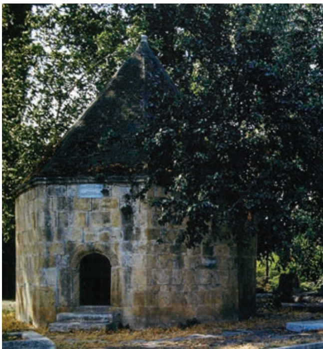
Il Mausoleo ottagonale di Hubyarly. XVII secolo d.C.

di Juma; nel Nagorno Karabakh si trovano le fortezze di Askaran ed il mausoleo dedicato a Hankendi; nella regione di Dgiabrail si può osservare il "Gyz Galasy" (la "Torre della Vergine"); Nella regione di Agdam ci sono i seguenti monumenti: il tempio a 12 angoli nei pressi del villaggio di Hacin-Turbatly, la fortezza Shahbulag, la moschea Shahbulag, la moschea Giuma (XIX sec.), il mausoleo dedicato a Panah-Ali-Han e ai suoi discendenti ed il bagno nel villaggio Abdal-Giulably (l'inizio del XX secolo.); a Barda - il mausoleo Barda, il mausoleo di Ahsadan Baba (XIV c), la moschea Imamzade (XIX c) ed il mausoleo di Bahman Mirza; a Shusha si trovano il mausoleo ottagonale, la fortezza Panahabad (Shusha), la casa della poetessa Natavan, la moschea Mamai, la moschea e caravanserraglio di Meshedi Shukiur Mirsiyab, e moschee di Dgiulfalar, Gagi Yusifli, Saatli, luhari Ghievharaga, Ashagy Ghievharaga (XIX sec.), Han Evi (Palazzo del Re), il palazzo del Ginnasio; nella zona di Lachin sono presenti gli edifici di Garasaggal, di Soltan Baba, dello Sciecco Ahmed, di Sary Ashiq (XV sec); nei villaggi di Dgimli e Gushciu si trovano i monumenti di Ushag Galasy ed di Beyuk bulag (XV secolo); ad Agdgiabedi ci sono la fortezza di Bayat (XVIII sec.) ed il Palazzo del Sultano Hamza (XVIII sec.) (10).