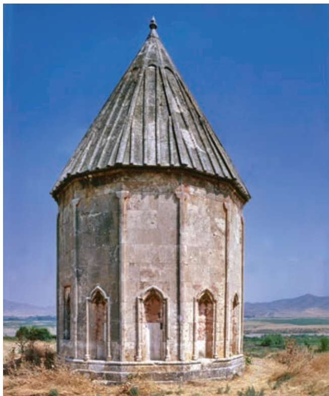
Il mausoleo Kutlu Musa, del 1314 d.C.. Villaggio di Hachynderbetli

della tradizione cristiana albanese che quelli musulmani, ci permettono di tracciare un collegamento evolutivo storico tra la cultura, la scienza delle costruzioni, le forme dell'architettura e l'arte del passato. Gli studi ci dimostrano che c'è stato un processo di incrocio tra l'architettura e l'arte tradizionale musulmana e le antiche tradizioni degli indigeni abitanti di questi luoghi.