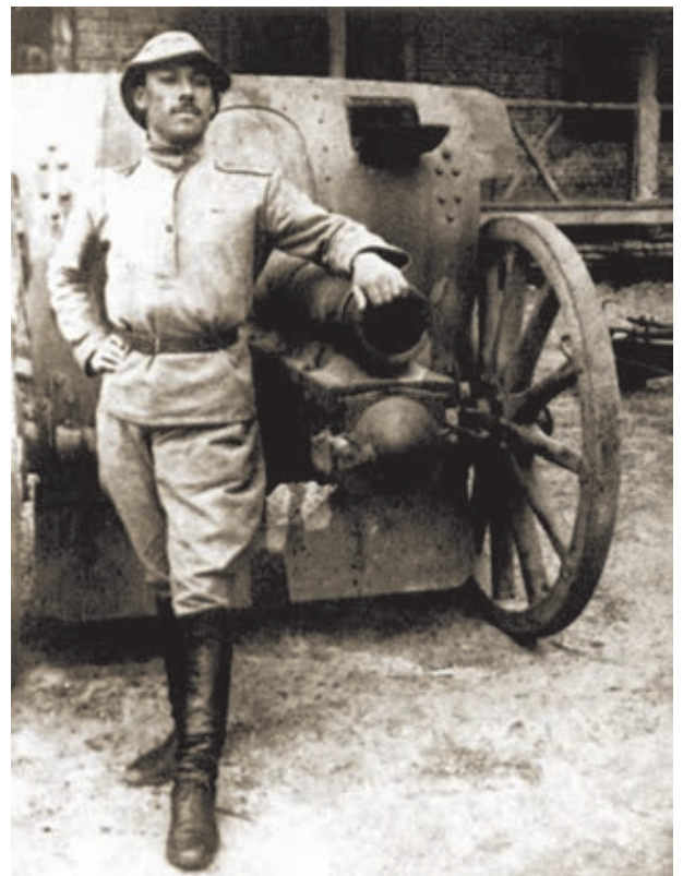
Artileris tentara RDA. Tahun 1919

Menjelang didirikannya RDA, di Kaukasia Selatan orang-orang Azerbaijan secara kompak bermukim di wilayah yang luasnya kira-kira 150.000 km 2 . Luas RDA