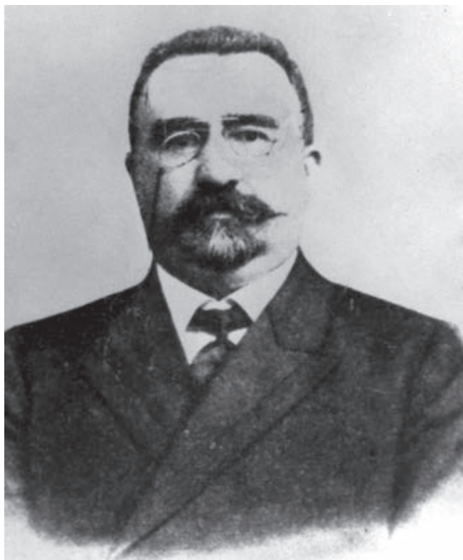
Ketua Parlemen RDA A.M. Topcubasyov

114.000 km 2 , dengan jumlah penduduk 3,3 juta jiwa [1, jilid 1, hal.11]. Untuk sementara Ganja ditetapkan sebagai ibu kotanya, karena pada masa itu Baku sedang dikuasai oleh pemerintah kaum bolsyewik-dasynak yang dikenal sebagai "Dewan Komisaris Rakyat Baku".