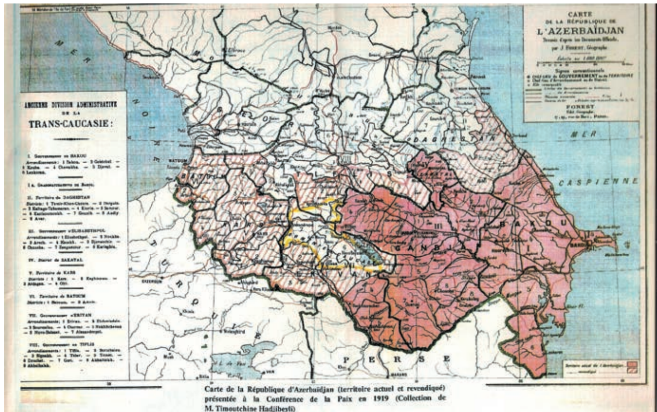
Carte de la République d'Azerbaïdjan (territoire actuel et revendiqué) présentée à la Conférence de la Paix en 1919 (Collection de M. Timoutchine Hadjibeyli)

rah, budaya dan sastra Azerbaijan. Pada awal tahun 1920 Kementerian Pendidikan Rakyat membuka jurusan Arkeologi. Persatuan sastra “ Yasyil gelem ”, Lembaga Perlindungan Seni dan Budaya Muslim, “ Turk ojagi ”, lembaga dan sanggar-sanggar seni yang lain juga tetap aktif. Museum kemerdekaan juga diresmikan pada Desember 1919. Hal tersebut di atas merupakan salah satu pencapaian penting yang dicapai oleh RDA dalam bidang Kebudayaan [1, jilid 1, hal.77]. Museum tersebut diresmikan bertepatan dengan hari peringatan parlemen. Supaya secara simbolis memiliki arti. Selain itu juga dibentuk sebuah komisi untuk menyesuaikan abjad Azerbaijan dengan abjad Arab. Pemerintah telah mencabut penyensoran pers, mengeluarkan surat keputusan tentang peringatan peristiwa-peristiwa bersejarah.