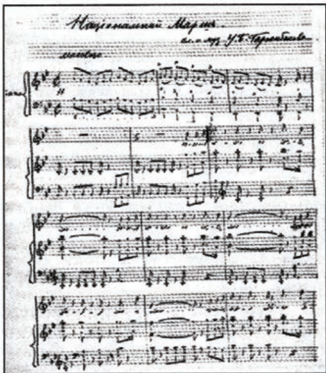
Not lagu kebangsaan Republik Azerbaijan. Tahun 1919

Perlu dicatat juga, pencapaian di bidang pembangunan budaya yang memainkan peranan penting yaitu di bidang pers. Yaitu adanya surat kabar "Iqbal". Surat kabar inilah yang pertama kali mempropagandakan maksud dan tujuan sosial-politik RDA secara konseptual. Penggagas utama "Iqbal" dan surat kabar "Dirilik" adalah para jurnalis dan kru surat kabar "Acig soz" – organ resmi partai "Musawat" yang memimpin gerakan pembebasan nasional di Azerbaijan. Di samping itu selama adanya RDA untuk propaganda ideologi nasional banyak dilakukan surat kabar "Istiglal", "Azerbaijan", "Owraginafise", "Muselmanlig", "Gurtulusy", "Medeniyet", "Genjler yurdu", "Syeypur", "Zanbur". Pada waktu itu juga kehidupan sosial-politik, ekonomi dan budaya dicerminkan dalam halaman-halaman surat kabar resmi "Azerbaijan". 4 edisi pertama surat kabar tersebut diterbitkan di Ganja. Kemudian surat kabar "Azerbaijan" mulai terbit di Baku dalam bahasa Azerbaijan dan Rusia. Dalam edisi yang terbit pada 15 September 1918, di situ dimuat