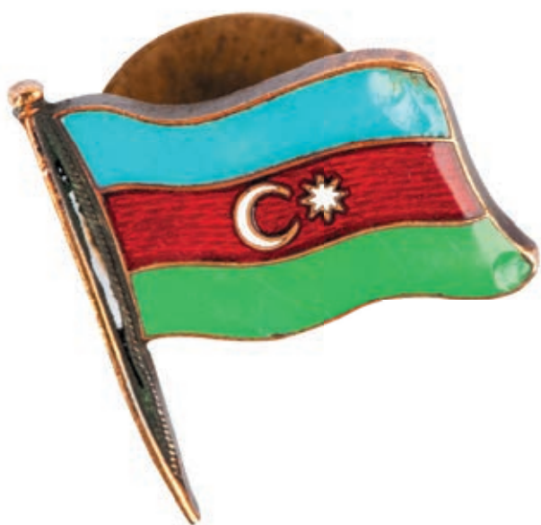
Lencana anggota Parlemen RDA. Lencana ini milik ketua Parlemen A.M.Topcubasyov, disimpan di Museum Sejarah Nasional Azerbaijan.