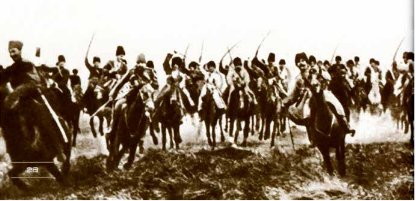
Azerbaycan gönüllüleri toplu halde Kafkas İslam Ordusu'na katılıyorlar.

Çarlık sonrası Rusya'yı yöneten Geçici Hükümetin 7 Kasım 1917'de Petersburg'da Bolşevikler tarafından yıkılmasından sonra Kafkasya'da çifte egemenlik sorunu ortaya çıkmıştı. 1. Yeni kurulmuş Maverai Kafkas Hükümeti. Tiflis'te toplanan ve Maverai-i Kafkas Seymi" olarak bilinen parlamentoda Gürcü, Azerbaycanlı ve Ermeni milletvekilleri temsil olunmuştu. 2. ise 15 Kasım'da Bakü'de Bolşevikler tarafından oluşturulan Bakü İşçi, Köylü ve Asker Vekilleri Sovyeti, kısa adıyla Bakü Sovyeti idi. Bakü Sovyeti'nin başında Bolşevik Stepan Şaumyan vardı. Bakü Sovyeti doğrudan Rusya Komünistlerine bağlıyken temel görevi Rus Bolşeviklerini petrol, pamuk ve buğday gibi hammaddeyle temin etmekte (1, s. 94-98). Ayrıca, temel görevlerinden biri de Azerbaycan'ı Bolşevik devletinin bir sömürgesi haline getirmektir. Bu ise Azerbaycan hal-