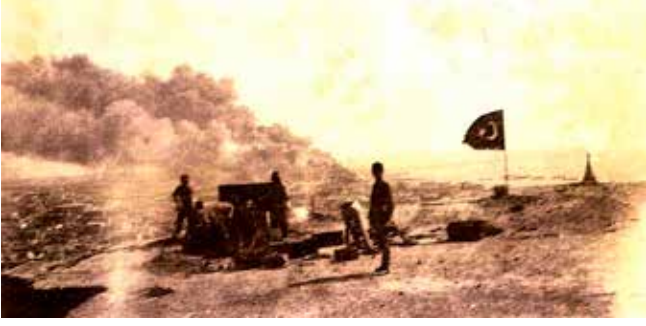
Türk topçuları Bakü etrafındaki bir mevzide. Eylül, 1918.

27 Ağustos 1918'de Rusya ve Almanya arasında Brest-Litovsk Anlaşmasına ek bir anlaşma imzalandı: «...Almanya Kafkasya'da üçüncü bir devletin aşağıda gösterilen sınırları geçmemesi (sınırlar belirtilmiştir) için etkisini kullanacaktır. ... Rusya gücü ölçüsünde Bakü vilayetinde petrol ve petrol ürünleri üretimine yardım edecek ve toplam üretimin dörtte birini, fakat her ay daha sonradan belirlenecek belli bir tonun altında olmamak kaydıyla Almanya'ya tedarik edecektir» (16). Buna rağmen Türk ordusu Bakü'ye doğru hareketini devam ettirmiştir.