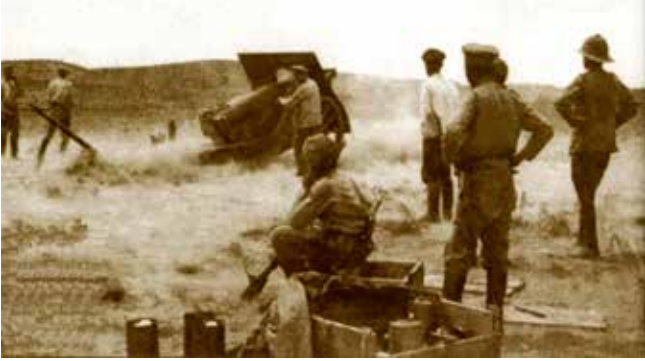
İngilizler Bakü'de Ermeni topçularını eğitiyorlar. 1918.

manlı devletinin "ülkede asayiş ve güvenliği sağlamak zarureti doğarsa Azerbaycan Cumhuriyeti hükümetine askeri yardımda bulunacağı yükümlülüğü" öngörülmüştü. Türk tarafının açıklamasına göre Bakü ve çevresinde yüz binlerce Türk ve Müslüman kendilerini devrimci adlandıran eşkıyaların boyunduruğu altında kalmaya mahkum edilmiştir (6, s. 16). Türk askeri birliklerinin planına göre (5. Kafkas ve 15. Çanakkale orduları) Azerbaycan'ın Müslüman Tümeni ve gönüllü birlikleriyle birleşerek Kafkas İslam Ordusu adı altında birleşecekti. Kafkas İslam Ordusu'nun komutanı ise Enver Paşanın kardeşi Nuri Paşa Killigil idi.