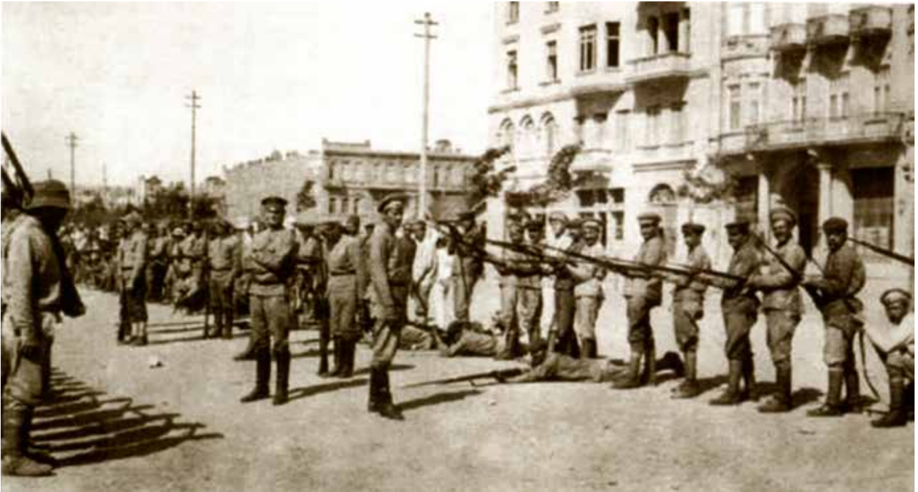
Rus subaylar Bakü'de Ermenilere askeri eğitim veriyorlar. 1918.

Azerbaycan Demokratik Cumhuriyeti'nin silahlı birlikleri ise onlarla kıyaslanmayacak kadar azdı. 18 Aralık 1917 yılında Korgeneral Ali Ağa Şihlinski'nin komutasında Müslüman Tümeni oluşturulmuştu (7, s. 36). Tümen karargahı Tiflis'te, daha sonra ise Gence'de idi. Burada silahlı kuvvetlerin oluşturulması süreci başlamıştı. Şamahı'da Halil Paşa Talişinski'nin komutasında 1. Müslüman piyade tugayı oluşturulmuştu. Tugayın görevi Bolşeviklerin saldırılarına karşı koymaktı (8, s. 53-55). Subay kadrolarının azlığı tümenin oluşumu önündeki en büyük engellerdendi. A.Şihlinski anılarında şöyle yazıyordu: "Azerbaycanca konuşabilen yeterli kadar subayımız yoktu. Seferber edilecek askerler ise kesinlikle Rusça bilmiyorlardı. Yeni birliklerin örnek alabileceği hiçbir astsubayımız ve eskiden hizmet etmiş bir askerimiz bile