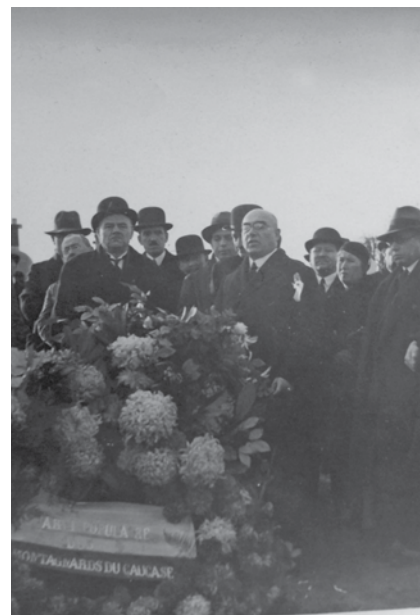
Beerdigung 1934 in Paris

grundlegenden emanzipatorischen Idee Toptschubaschov anhing. In einem kurzen Überblick über die verschiedenen Interpretationen der Forschung seien neben der bereits erwähnten Teilautonomie innerhalb des Russischen Reiches und der aserbaidischen Separation