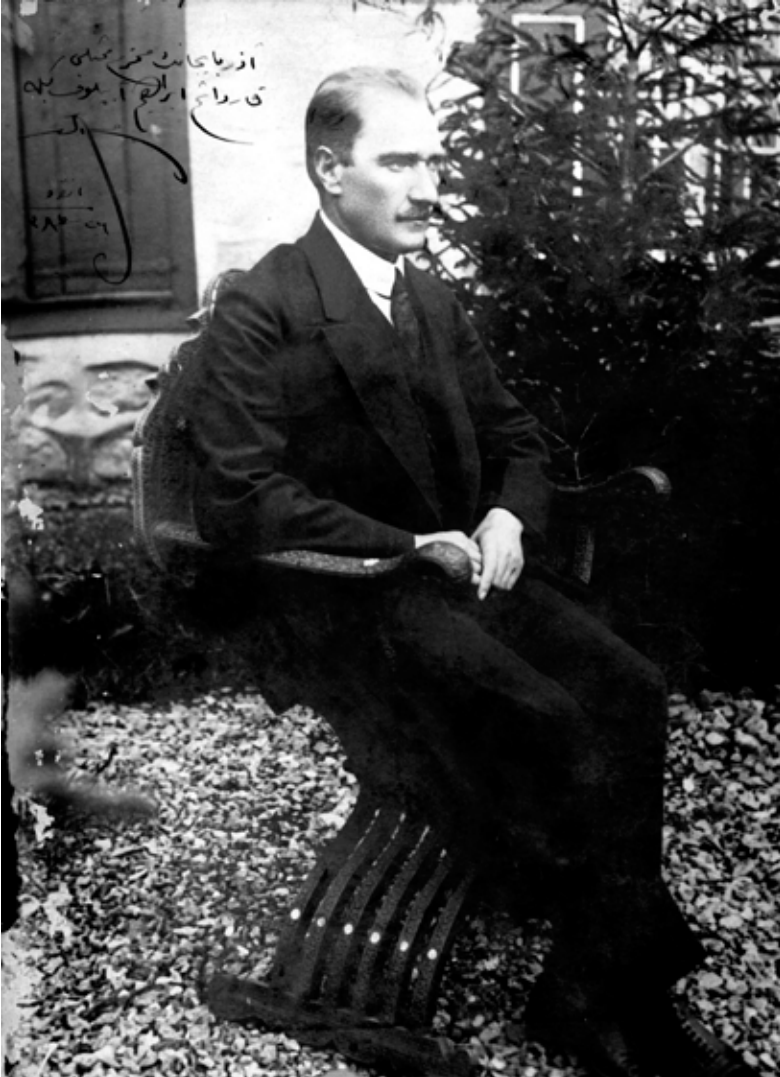
Atatürk'ün imzalı fotoğrafı. Azerbaycan Milli Tarih Müzesi.

Azerbaycan Milli Tarih Müzesi'nde Türkiye Cumhuriyeti'nin kurucusu Mustafa Kemal Atatürk'ün üzerine kendi eliyle yazdığı "«Azerbaycan'ın Sayın Büyükelçisine, kardeşim İbrahim Abilov'a. 28 Ekim 1921 y." imzalı fotoğrafı muhafaza edilmektedir (1).