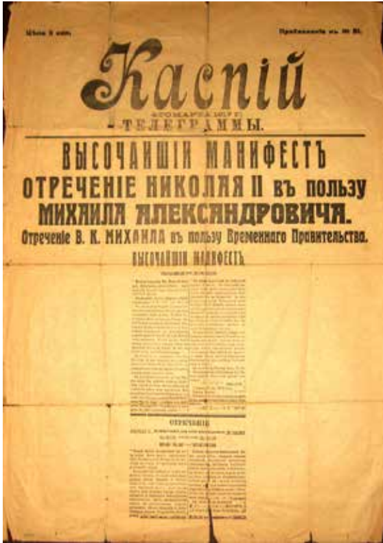
A. Topçubaşov'un editörü olduğu "Kaspi" gazetesi. Azərbaycan Milli Tarih Müzesi

Alimerdan Bey Topçubaşov'un (Topçubaşı) tarihteki rolü öncelikli olarak, gerek 19. yüzyılın sonu ve 20. yüzyılın başlarında Rusya İmparatorluğu Müslüman halklarının hayatında, gerekse 1918-20'li yıllar bağımsız Azerbaycan devletinin tarihinde yaptığı hizmetlerle ilgilidir. Onun özellikle imparatorluk döneminde bu halkların yararına gösterdiği çok değişik faaliyetlerin bugün bile her yönüyle incelenmesi gerekmektedir. Bu faaliyetleri onun yazdığı mektuplardan oluşan, gazetecilik faaliyetlerini kapsayan ve bilimsel mirasının zenginliği konusunda algı