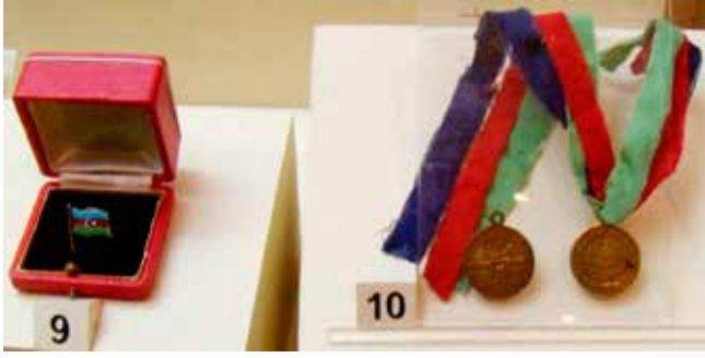
A.Topçubaşov'un eşyaları: milletvekili rozeti, Azerbaycan Parlamento'sunun açılışı şerefine hatıra madalyaları. Azerbaycan Milli Tarih Müzesi

görülen entelektüel tipine uygundu ve kendisiyle ilgili "bani, kurucu" tanımlaması yapılabilir. 1908 yılında kendisine yazılmış bir mektupta şu satırlar yer almaktaydı: "... Tarih Sizin isminizi altın harflerle yazacaktır..." 11 . Topçubaşov o dönemi hatırlarken kendisinin devrimci olmadığını, fakat gücü ve olanakları çerçevesinde Rusya Müslümanlarının, özellikle Kafkasya Müslümanlarının çıkarlarını korumak için çalıştığını yazmıştır. 12