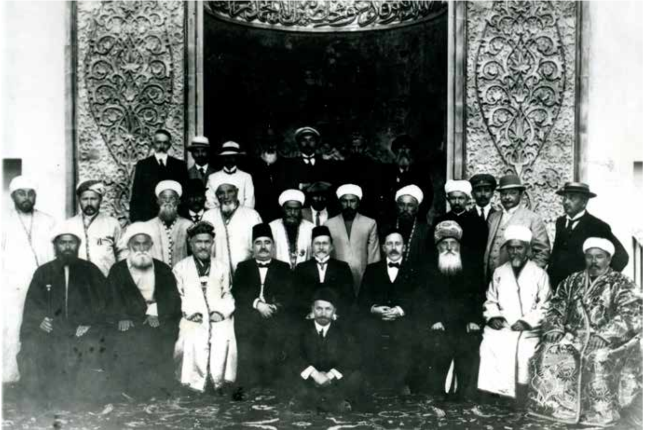
Alimerdan Bey Topçubaşov 4. Rusya Müslümanları Kurultayı'nın milletvekilleri arasında.

iştirak ediyordu. Zira kendisi Müslüman toplumun içinde bulunduğu durumun iç açıcı olmadığını çok iyi biliyordu. Müslümanları ayrımcılıkta suçlarken Rusya'nın toplumsal yaşamına katılımlarını engelliyorlardı. Halkının vatansız evladı olarak Topçubaşov bu dev imparatorluğun diğer Türk ve Müslüman halklarına karşı derin bir sempati duyuyordu.