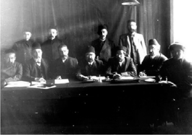
Alimardan Bey Topçubaşov 3. Rusya Müslümanları Kurultayı'nın Başkanlık Divanında.

"Özerklikçi İttifak Parlamento Grubu"nun faaliyetine katılmaları rahatsız ediyordu. Bu ittifakın tesisçileri arasında Müslüman temsilciler de bulunuyordu. Topçubaşov'un kendisi bu grubun büro üyesiydi. Görüldüğü gibi Topçubaşov'un siyasi düşüncesi Kafkaslar bölgesi dahil ayrı ayrı serbest temsili kurumların yer aldığı federatif yapıya sahip bir Rusya İmparatorluğunu öngörüyordu.