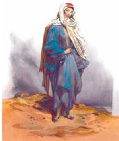
Fürst G.G. Gagarin, Tatare aus Baku (Aquarell aus der Serie „Gewänder Kaukasiens“), 1840er Jahre

Thematische und landschaftliche Zeichnungen, die der Autor später zu der Reihe „Malerischer Kaukasus“ vereinte, bildeten zusammen mit der Aquarellserie „Gewänder des Kaukasus“ die Grundlage für ein künstlerisches Projekt, mit dessen Umsetzung Fürst Grigorij Gagarin zusammen mit dem russischen Botschafter in Paris und Generaladjutanten Graf Ernst Gustav von Stackelberg (1813-1870) im Jahre 1845 in Paris begann. Die Idee des Projektes bestand in der Herausgabe einer Serie von Kunstalben unter dem französischen Titel „Scènes de paysages mœurs et costumes de Caucase“ („Szenen, Landschaften, Sitten und Gewänder des Kaukasus“). Zunächst planten die Partner die Herausgabe von 48 Bänden, die jeweils vier Lithographien mit Texten von Stackelberg sowie sechs Lithographien der Kostüme ohne Text umfassen sollten. 9 Jedoch verhinderte der Krimkrieg (1853-1856), in dem sich Russland und Frankreich auf unterschiedlichen Seiten der Front wiederfanden,