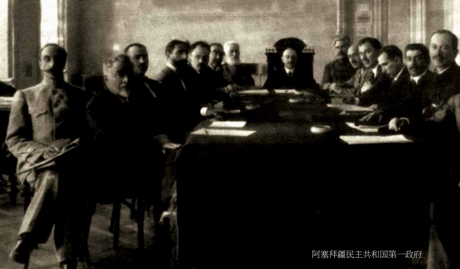
阿塞拜疆民主共和国第一政府

表组成。政治动乱席卷了该地区的主要民族，其中包括阿塞拜疆民众。4月9日在发塔里-汉主持的巴库穆斯林知识界会议上选举出了巴库穆斯林组织联盟国家临时委员会，九月初变更为中央外高加索穆斯林国家委员会。之后将该地区穆斯林的主要政治力量纳入自己的行列。4月15日在甘吉召开了突厥联邦党成立大会，之后于7月3日与木沙瓦特党合并。联邦党人的任务是在民主联邦俄罗斯共和国的框架内实现阿塞拜疆地区自治。阿塞拜疆运动的领导人—马灭达敏·拉苏尔扎杰，阿里马尔丹·别克·托普其巴沙夫，发塔里汉·霍斯基在本地区内并且在全俄范围内坚持该原则，尤其是5月1