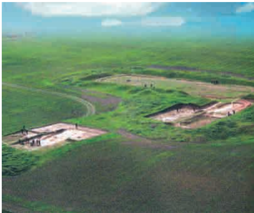
La struttura ovale del II-I secolo a.C.