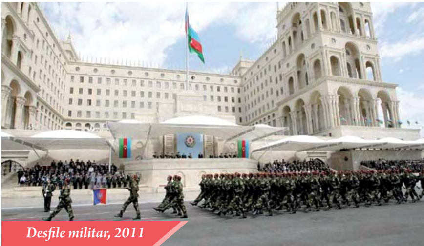
Desfile militar, 2011