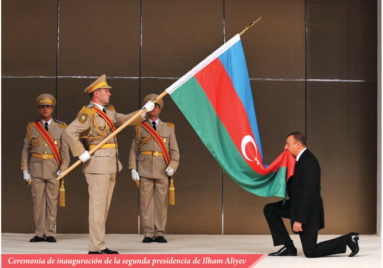
Ceremonia de inauguración de la segunda presidencia de Ilham Aliyev

el año 2007 la Concepción Nacional de Seguridad de Azerbaiyán, que proclamó oficialmente la estrategia multidimensional y el equilibrio como los principios fundamentales de la política exterior del país 1 .