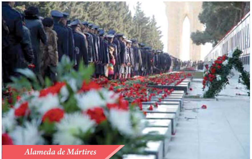
Alameda de Mártires

H an transcurrido 20 años desde que se aprobó la Declaración de la Restauración de la Independencia de la República de Azerbaiyán. Proclamada su independencia, pero no ingresada en la etapa de formación del Estado, se encontró con desafíos muy serios, incluso con reales amenazas sobre la integridad territorial del país. El país tuvo muchos desafíos de tal magnitud, como cualquier estado de reciente formación, tal como la elaboración y la aprobación de leyes fundamentales, la formación de la estructura del estado, la formación de nuevas instituciones estatales, la definición del rumbo de la política exterior y de la planificación económica, la provisión de la seguridad nacional y etc. El principal problema era el conflicto en Nagorno-Karabaj, generado por los grupos nacionalistas de