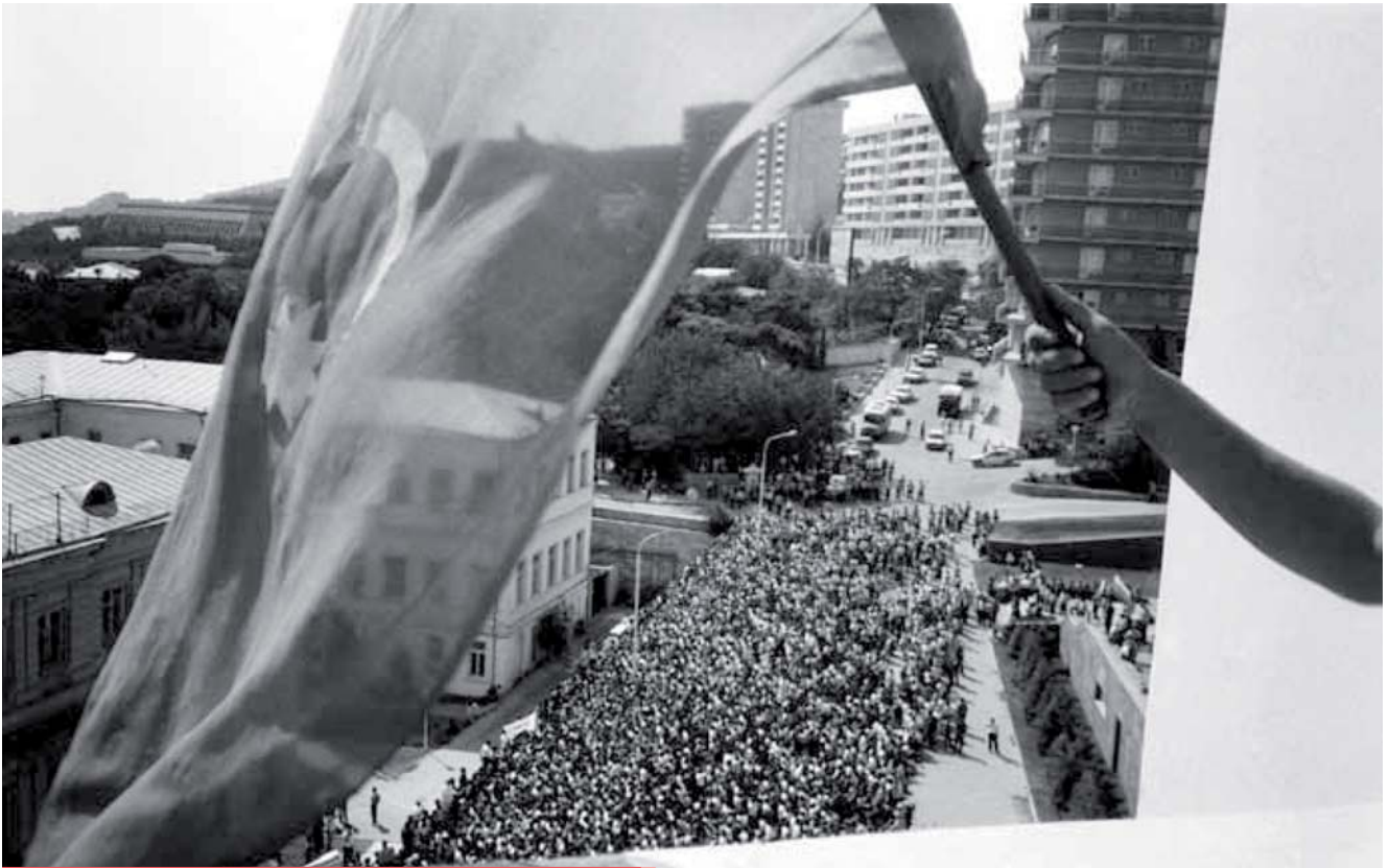
La nación exige la independencia, 1989

H an transcurrido 20 años desde que se aprobó la Declaración de la Restauración de la Independencia de la República de Azerbaiyán. Proclamada su independencia, pero no ingresada en la etapa de formación del Estado, se encontró con desafíos muy serios, incluso con reales amenazas sobre la integridad territorial del país. El país tuvo muchos desafíos de tal magnitud, como cualquier estado de reciente formación, tal como la elaboración y la aprobación de leyes fundamentales, la formación de la estructura del estado, la formación de nuevas instituciones estatales, la definición del rumbo de la política exterior y de la planificación económica, la provisión de la seguridad nacional y etc. El principal problema era el conflicto en Nagorno-Karabaj, generado por los grupos nacionalistas de