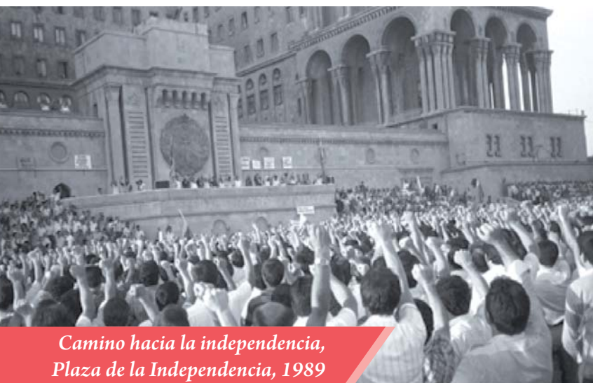
Camino hacia la independencia, Plaza de la Independencia, 1989

El presente artículo contiene un breve análisis de la trayectoria histórica cursada por Azerbaiyán durante 20 años posteriores a la restauración de la independencia. El autor señala que a principios de la independencia, Azerbaiyán se enfrentó con un serie de dificultades, siendo la principal de ellas la agresión de Armenia y recién con la llegada al gobierno de Heydar Aliyev en 1993, en país comenzó el fortalecimiento real de las bases del Estado, fue desarrollado y puesto en marcha la estrategia de política exterior, del desarrollo económico y de todas esferas de la vida, dirigida a la formación de un moderno estado democrático.