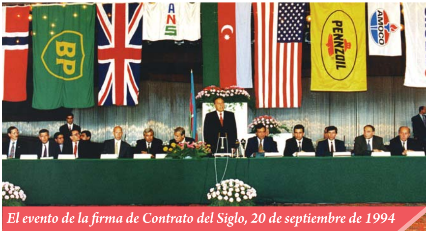
El evento de la firma de Contrato del Siglo, 20 de septiembre de 1994

esa u otras cuestiones de la reorganización realmente revolucionaria de la sociedad. Precisamente eso fue el factor principal que condujo al rápido cambio de las primeras autoridades políticas del país a comienzos de la independencia. Tanto Aiaz Mutalibov - primer presidente de independiente Azerbaiyán, como su sucesor Abulfaz Elchibey - se dieron rápidamente cuenta de su incapacidad a título de más altas autoridades del país, abandonando prontamente sus puestos por no poder soportar la carga de la responsabilidad que conllevaba. El conservadurismo extremo de equipo Mutalibov, como el extremo radicalismo del equipo de Elchibey, resultaron no ser aceptables para la población de Azerbaiyán.