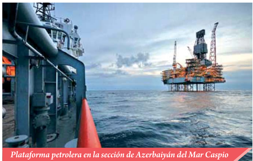
Plataforma petrolera en la sección de Azerbaiyán del Mar Caspio

principio de la autodeterminación de los pueblos. Paso a paso, el líder de Azerbaiyán convencía a los líderes de la sociedad internacional, dirigentes de otros países, representantes de las organizaciones internacionales que, el derecho de Azerbaiyán sobre la conservación de la integridad territorial, es un derecho santo e inalienable del pueblo azerbaiyano y que en este caso no corresponde de ninguna manera tratar de introducir la idea de violación de los derechos de la minoría nacional armenia. Esos esfuerzos proporcionaron resultados brillantes. En los documentos de todas organizaciones internacionales principales se ratifica la integridad territorial de Azerbaiyán. Precisamente en eso consiste el mérito de Heydar Aliyev, quién pudo defender la posición de Azerbaiyán en relación al conflicto armenio-azerbaiyano y a las cuestiones principales de la política mundial en reuniones de líderes de Europa y América, desde la tribuna de la ONU. Posteriormente, las bases de la política exterior de Azerbaiyán fueron desarrolladas por su sucesor, el presidente Ilham Aliyev, quién ratificó en