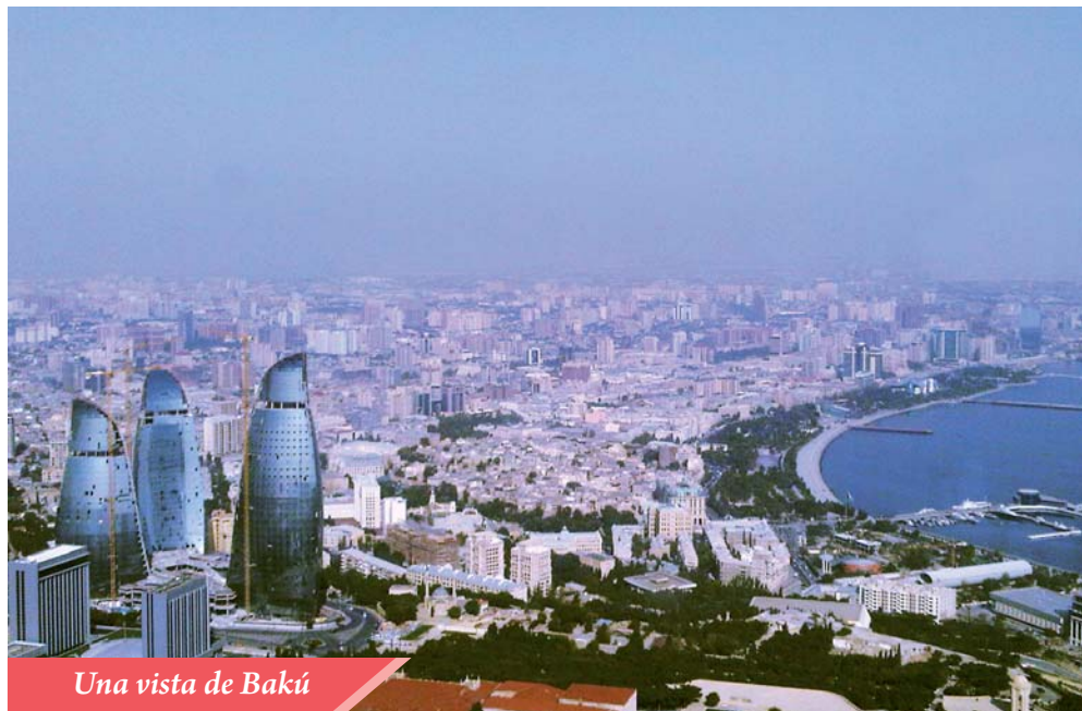
Una vista de Bakú

República, van a ser resueltos. La seguridad de eso debe a la histórica experiencia adquirida a través de muchos siglos, el optimismo y la sabiduría del pueblo azerbaiyano, su fe en el futuro feliz y el deseo de asegurar a las generaciones futuras la vida en un país libre, soberano y floreciente. ✿