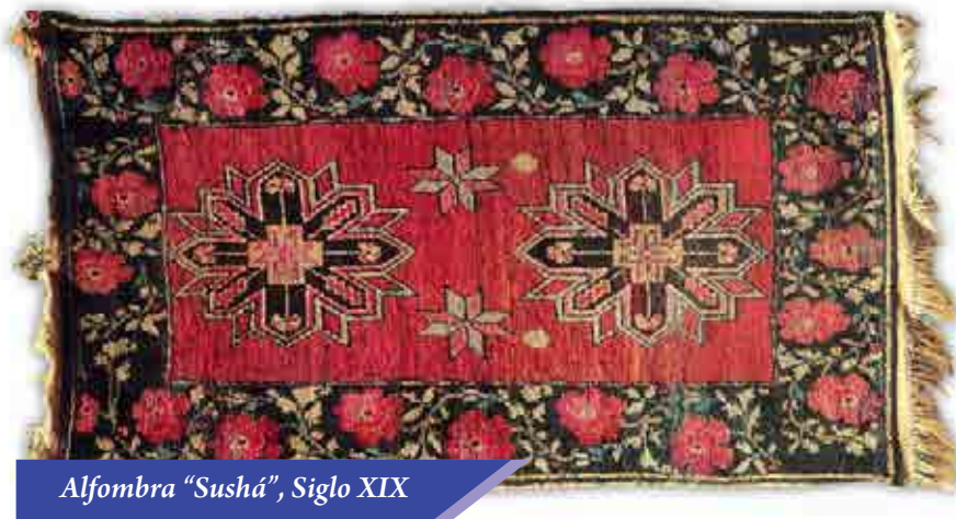
Alfombra "Sushá", Siglo XIX

mafrash (cofres de alfombras), mantas para caballos (chul), cojines de monturas (gajari), lazos, polainas, , las tejedoras de la aldeas dedicaban mucho tiempo a la producción de ese tipo de productos.