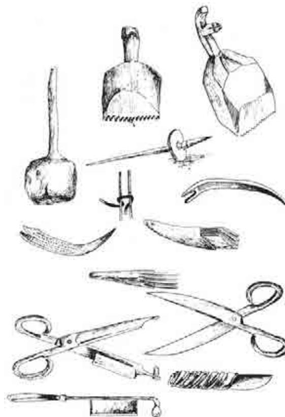
Instrumentos de tejido de alfombras

El rápido desarrollo del tejido de alfombras en Shushá y aldeas aledañas, fue producto de la influencia provocada por los países del exterior en los años 1879-1880 a raíz del gran interés que se despertó hacia las alfombras con dibujos antiguos. Precisamente, esa fue la razón por la cual las alfombras de Karabaj aparecieron en Europa y en América, preservándose en famosos museos del mundo. ❀