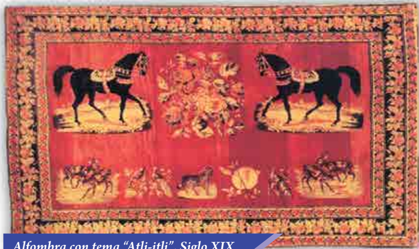
Alfombra con tema "Atli-itli", Siglo XIX

Por la composición de los dibujos las alfombras ornamentales de Karabaj se dividían