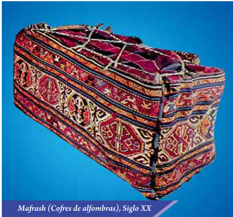
Mafrash (Cofres de alfombras), Siglo XX

naturales de Karabaj, la infinita belleza de su flora, la delicadeza de cada flor, de su capullo y follaje.