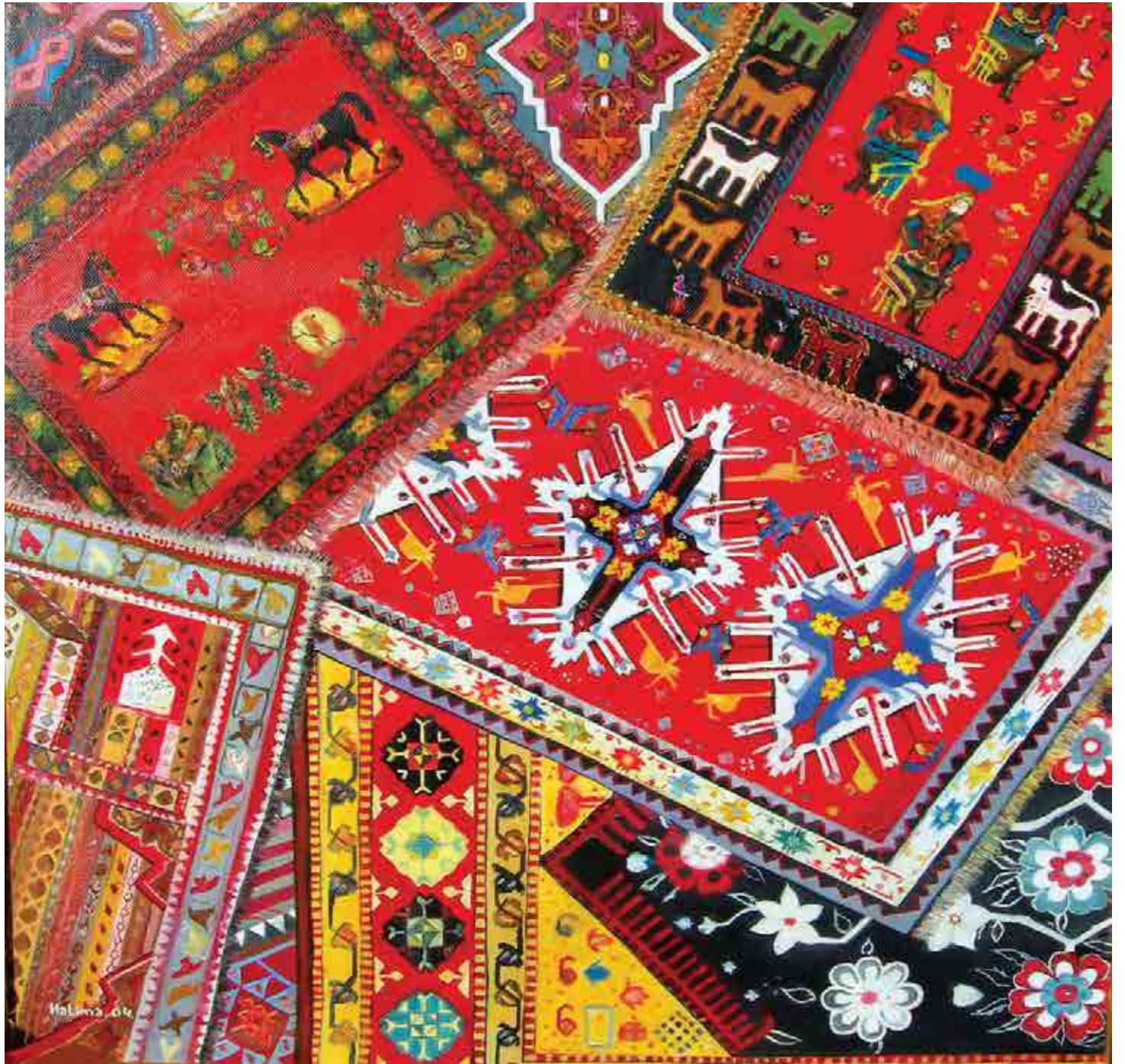
Alfombras de Karabaj