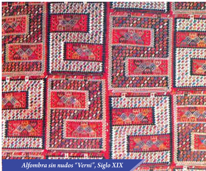
Alfombra sin nudos "Verni", Siglo XIX

Tomando en cuenta la gran demanda de los pobladores rurales de artículos tejidos tales como: bolsas de gran tamaño ("chual"), jurjun y heiba - sumaj reversible (bolsos),