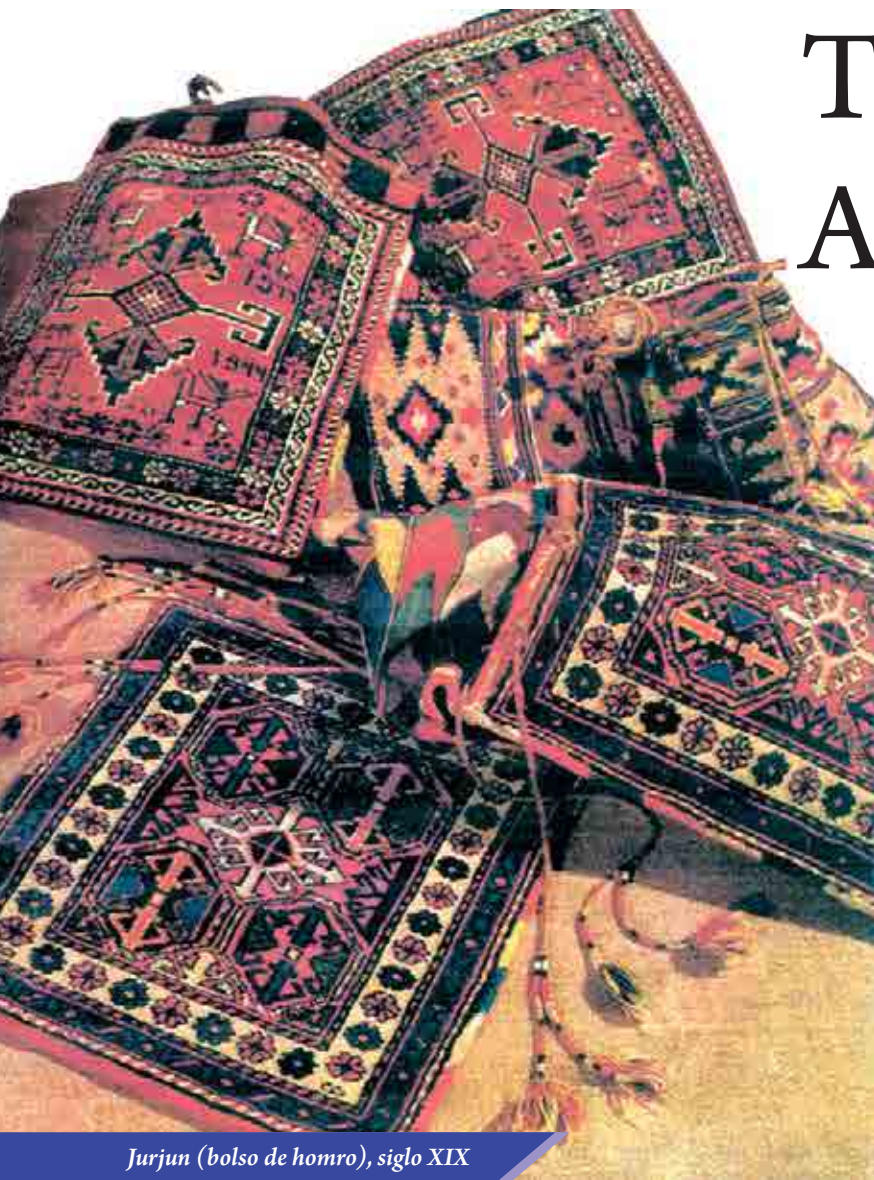
Jurjun (bolso de homro), siglo XIX

Uno de tipos de artesanía tradicionalmente desarrollados en Azerbaiyán que le proporcionó fama mundial fue el tejido de alfombras. Esta artesanía se desarrollaba en distintos centros regionales de producción, distinguiéndose unos de otros por la diversidad de sus productos, belleza de sus dibujos, intensidad de los colores, integridad de la composición u otros tantos valores artísticos.