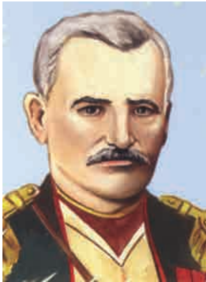
Mirze Fetali Ahundov

özellikle 1899 yılında yayımlanan "Ortaçağdaki Avrupa Destanlarında Doğu Temaları" monografisinde destanların ayrı-ayrı Avrupa destanları olduğunu, bu destanın Batı Asya ve Avrupa halklarına ait olduğunu ispat etmeye, hatta İbrani-Hıristiyan kutsal metinlerine dayandırmaya çalışmıştır. Buradan çıkan sonuca göre Slav, Fin, Alman, Fransız halklarının eski halk edebiyatındaki ilk destan motifleri Türk ve Moğollara aittir; böylece merkezi Asya halklarının halk edebiyatı destanlarının Avrupa'yı etkileme rolü Hun ve Atilla'ya aittir. Atilla'nın ve Hun Devleti'nin ortaçağdaki Avrupa destan edebiyatına olan etkisi o kadar büyüktür ki, bazı Alman edebiyat tarihçileri bu rolü "German" destanı ile Yunan destanındaki Agamemnon rolü ile mukayese ediyorlar. Rusların XII. yüzyıla ait milli destanı "İgor'un seferi" tamamıyla Rus ve Türk-Kıpçak savaşına adanmıştır. Bu destandaki en önemli nokta ise çok sayıda Türkçe kelimenin açıkça kullanılmasıdır. Güneydoğu Avrupa halkları olan Sırp, Yunan vs. halklarının diğer destanlarında da