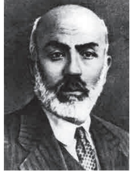
Mehmet Akif Ersoy

geçmeden bu bölge tüm dünyanın dikkatini çekti. Gedin'in coğrafi araştırmalarının etkisiyle Kozlov, Roborovsk ve Oldenburg'dan oluşan Rus araştırma ekibi, İngiliz araştırmacı Aurel Steyn (1900-1901, 1906-1908, 1913-1916), Japon Otanifa, Fransız Pelliot (1906 – 1909), Alman Grünveld (1902-1903, 1905-1907) ve Le Koka (1904-1906, 1913-1914) gibi araştırmacılar da bölgeye geldi ve bunların buldukları eşyalar dünya müzelerini doldurdu. Bu bulgulara Berlin Sanat Müzesi'nde bulunan freskler, kitabeler ve figürler de dahildir. Bu eserlerin ve diğer kaynakların yardımıyla biz bugün tarihteki Uygur kültürü hakkında bilgi ediniyoruz".