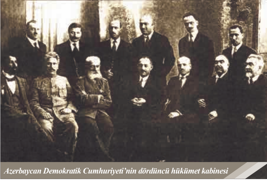
Azerbaycan Demokratik Cumhuriyeti'nin dördüncü hükümet kabinesi

Cumhuriyeti'ni tanımama, uluslar arası alandaki pozisyonunu zayıflatmak için askeri-politik baskı yapma, bölge içindeki devlet bütünlüğü direncini parlamentolarda üyeleri bulunan ve Bakü'de yasal olarak faaliyet gösteren Kafkas ve Bakü'deki Bolşevik organizasyonlar aracılığıyla yıpratma politikası hakimdi. Bu politika 1917-1921 yılları arasında hükmeden Rusya İmparatorluğunun bölgeye yönelik hedefinin bir parçasıydı. Rusya'da meydana gelen iç savaş, kızıl ordu terörü ve iç isyanların yaşandığı kaos sonucunda -ki bu olaylar herkesten önce Rus halkına darbe vurmuştur – Sovyet Devleti adıyla yeni ve çok yönlü bir imparatorluk kuruldu. Bu devlet farklı bir sosyal yapıda, yeni ideolojik ve politik hedefle şekillenmesine rağmen, devlet liderlerinin jeopolitik hedeflerinde bir değişiklik olmadı – daha önce elden çıkmış “kenar bölgeleri” tek elde toplamak ve her imparatorluk için geçerli olan “merkez” ile “bağımlı bölge” arasında sıkı ilişki formu kurmak öncelikli hedefti. Bolşevik Moskova'nın Azerbaycan Demokratik Cumhuriyeti'ne yönelik yürütülen politikalarının ilk başlangıç aşamasından itibaren bölgenin Petersburg'dan yönetilmesi gibi hedef mevcuttu.