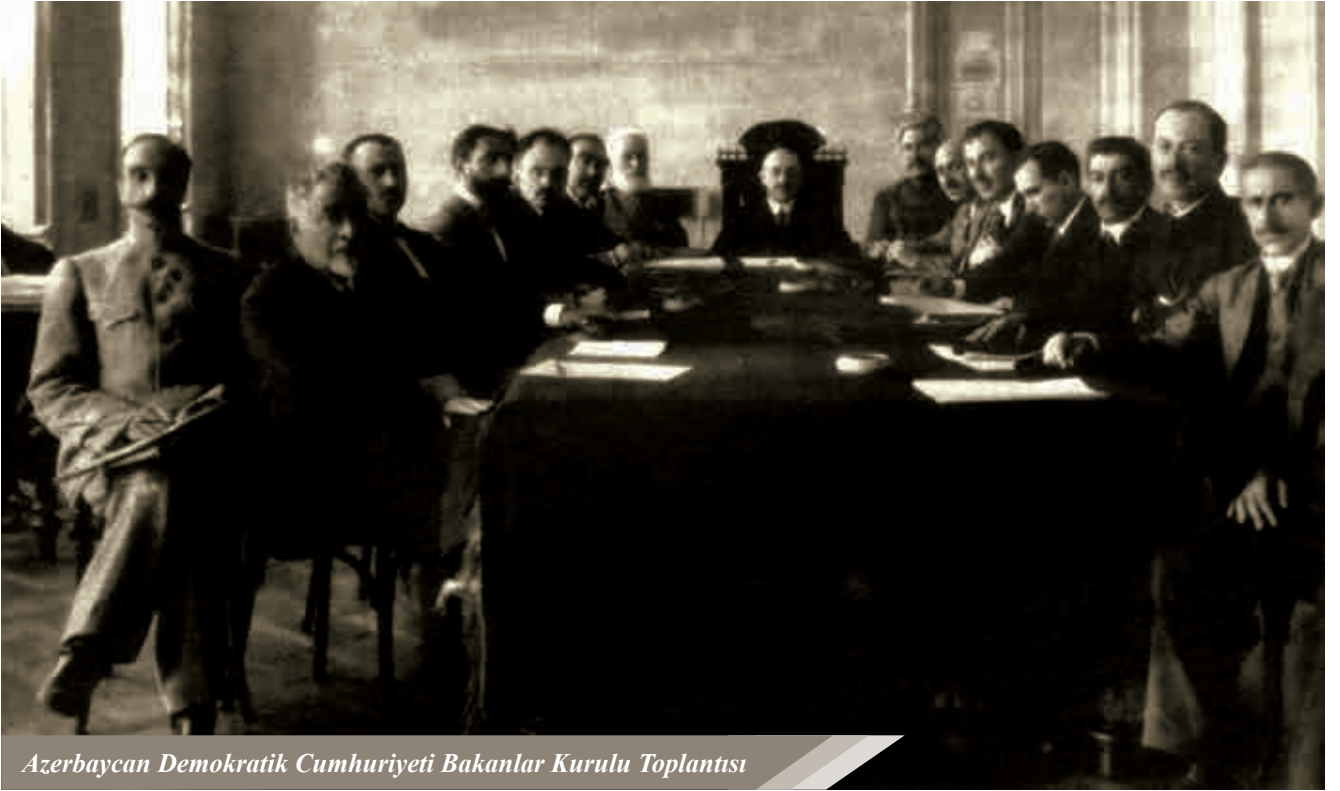
Azerbaycan Demokratik Cumhuriyeti Bakanlar Kurulu Toplantısı

bütün Kafkas halkları gibi Azerbaycan için de iri politik projelerin gerçekleştirilmesi ve varlığının sağlanması için bir şans oldu. Bu konuda Azerbaycan Demokratik Cumhuriyeti liderlerinden birisi: "bu süreç gelecek politik-kültürel ideallerin oluşturulmasına, onların pekiştirilmesine, dini ve tarihi geleneklerimizin korunmasına vesile oldu" (1, sayfa 16-17). Kafkasların Rusya'nın politik merkezlerinden ( Moskova ve Petrograd ) ayırma ve bağımsız olma süreci, birkaç etabı aştı ve Nisan 1818 tarihinde Kafkas Federatif Cumhuriyeti'nin kurulmasıyla sonuçlandı.