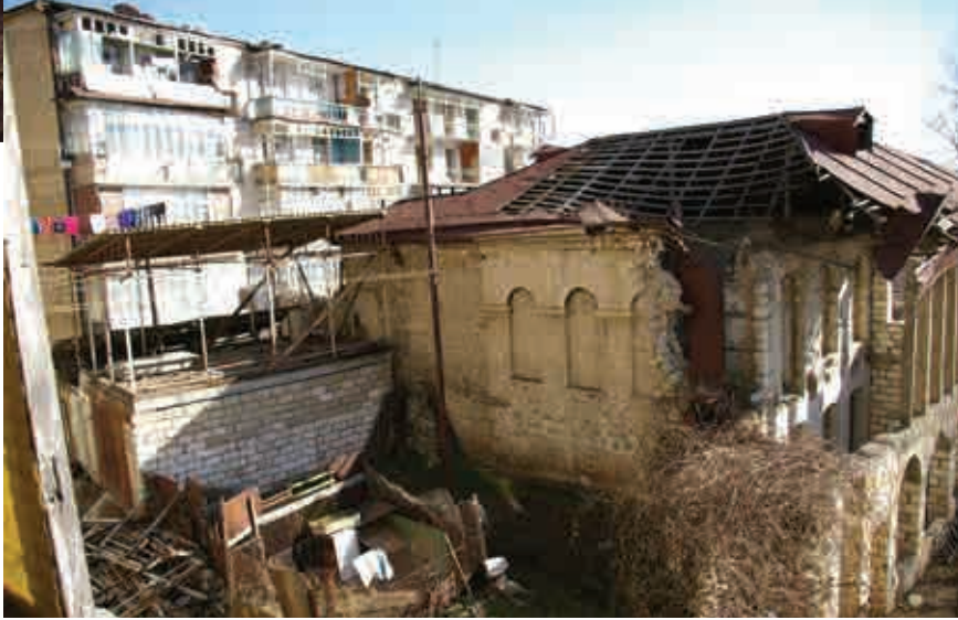
Şuşa şəhri (işgaldən sonra)

nemlerine ait eşya ve eserlerin yurtdışına çıkartılmasıdır. Bu tarihi değerler Avrupa'ya götürülmekte ve "Ermeni kültürünün örnekleri" olarak lanse edilmektedir. İşgal edilmiş topraklarda büyük kültürel-tarihi değer taşıyan tarihi müzeler ve içindeki eserler, ayrıca birkaç nadir eşya yok edildi veya yeni "Ermeni Kültürü Müzesi"nde yer almaktadır. Azerbaycan Cumhuriyeti Kültür Bakanlığının müzedeki eserlerin envanter belgeleri mevcuttur.