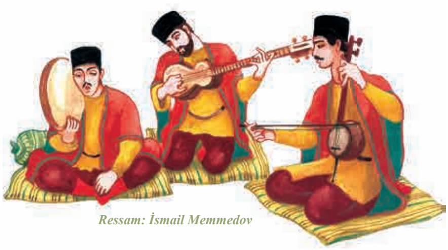
Ressam: İsmail Memmedov

nata merakı olan kendi isteğine göre gecelere gelirdi ve böylece gerçekten muğam sanatının değerini anlayanlar toplanırdı.