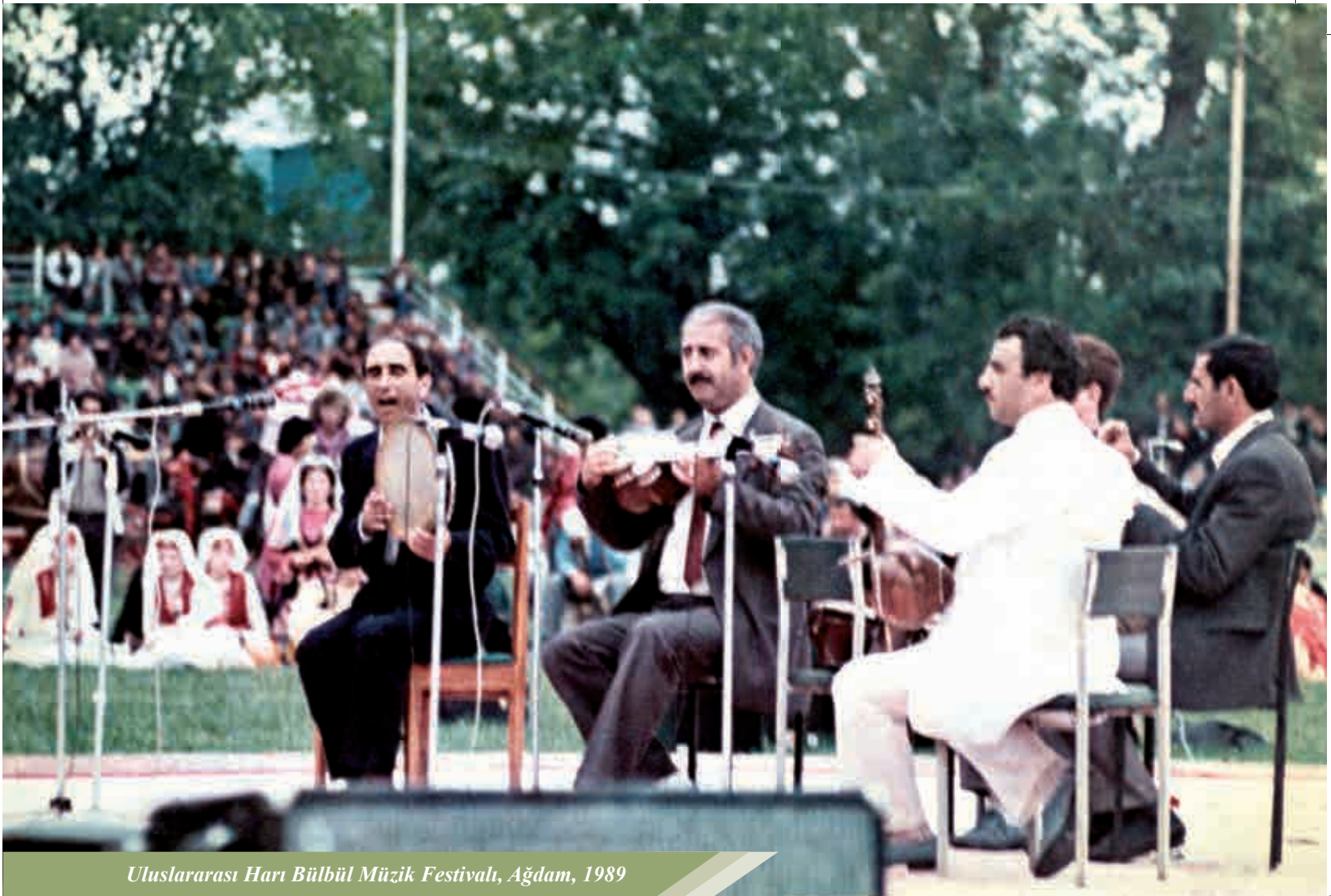
Uluslararası Harp Bülbül Müzik Festivali, Ağdam, 1989

şifresel olarak çözen bilgiler tarafından izah edilebilir. Muğam sanatçılarının hepsinde bulunan satırları gizemli yapma kabiliyeti, çocukluk yaşlarından itibaren gelişmeye başlar ki bu gizem, gazeller yazılırken kullanılır ve daha çok muğamın müzikal taleplerine yakındır. Muğam sanatçılarının hiçbirisi kaç tane gazeli ezbere bildiğini net olarak söyleyemez, ancak yeri geldiğinde onlar konusuna göre gazelleri ezbere okur.