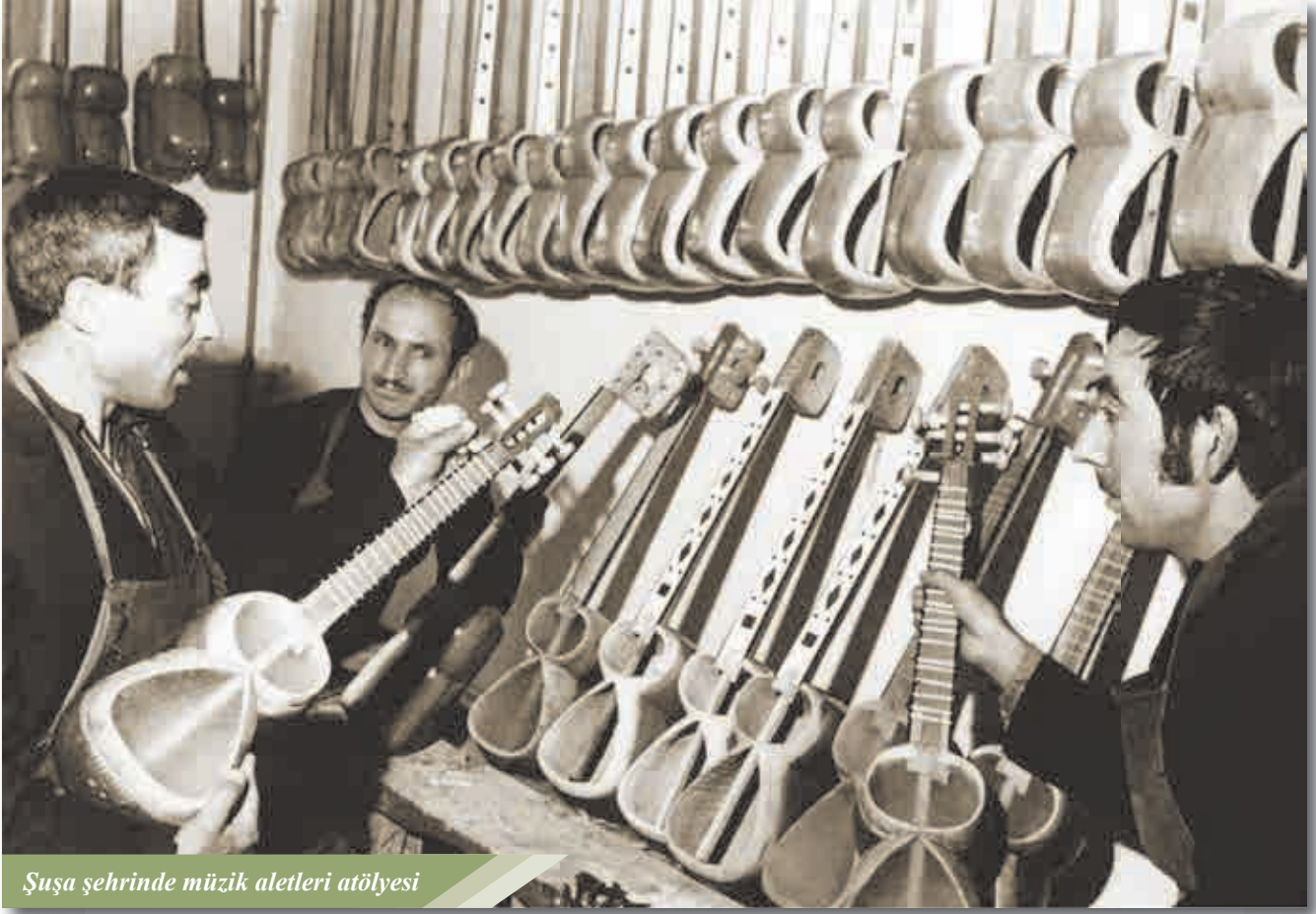
Şuşa şehrinde müzik aletleri atölyesi

şirketleri ve "Premier Rekord" adlı Macar şirketi tarafından da kaydı yapılıyordu. Sovyetler döneminde Muğam sanatının önemli plakları Aprelev ve Nogin fabrikaları tarafından üretildi.