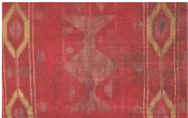
Фрагмент знамени Шекинского ханства. НМИА, фонд оружия и знамён, инв. № 451

П о Гюлистанскому (1813 г.) и Туркменчайскому (1828) договорам Азербайджан был разделен между Российской империей и Ираном. И если ханы в Южном Азербайджане пусть номинально, но сохраняли власть на своих родовых землях, а также атрибуты власти, то в Северном Азербайджане царизм проводил целенаправленную политику уничтожения или