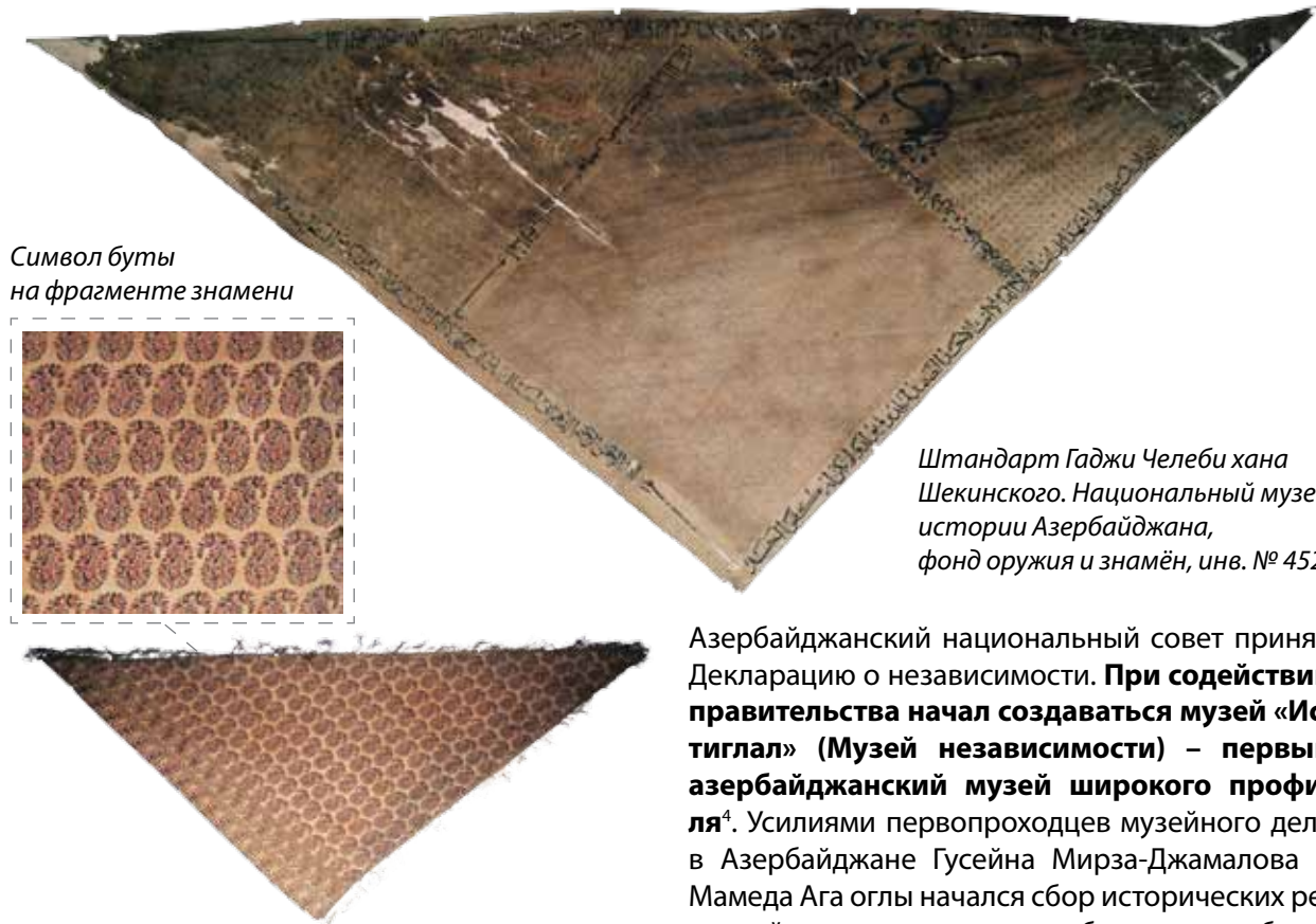
Символ буты на фрагменте знамени