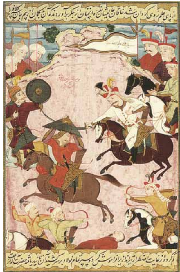
Миниатюра XVI века, знамя Шаха Исмаила I Хатаи

Деревянное древко длиной 228 см отполировано и покрыто черной краской. На древко надевается составное навершие из трех частей, высотой 52 см и шириной 12 см. На нижнюю конусообразную втулку надевается шар. Верхняя часть навершия завершается полым листом с зазубренными краями.