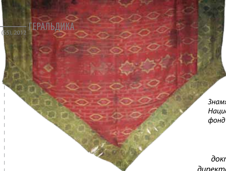
Знамя Шекинского ханства. Национальный музей истории Азербайджана, фонд оружия и знамён, инв. № 451