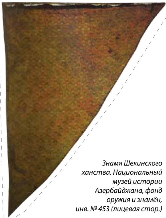
Знамя Шекинского ханства. Национальный музей истории Азербайджана, фонд оружия и знамён, инв. № 453 (лицевая стор.)