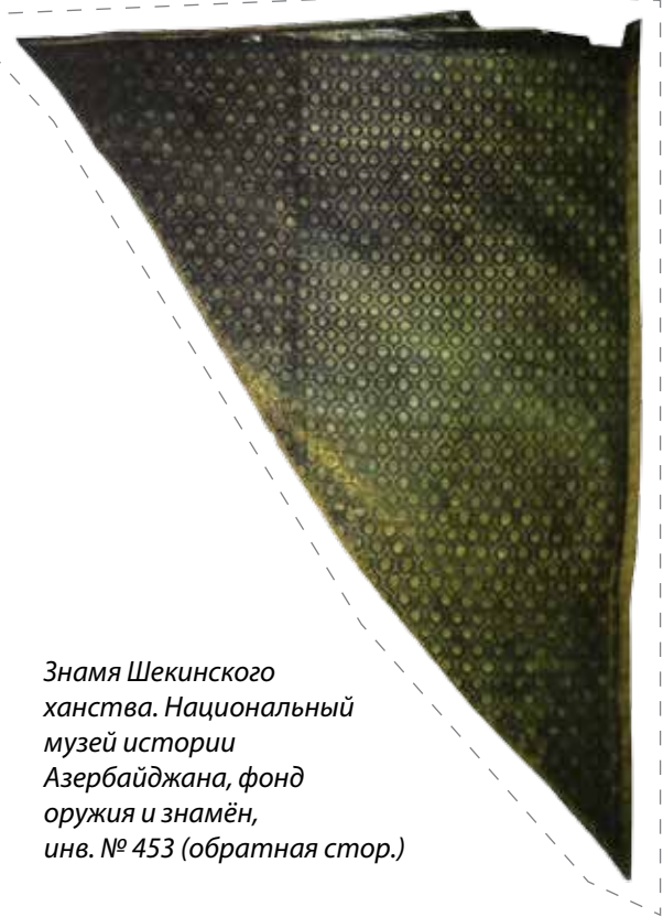
Знамя Шекинского ханства. Национальный музей истории Азербайджана, фонд оружия и знамён, инв. № 453 (обратная стор.)

В «Путеводителе по Кавказскому военно-историческому музею» довольно подробно описана история знамени, объясняющая наличие надписей на санскрите и фарси (обычно надписи на знамёнах азербайджанских ханств бывают на арабском языке). Отмечается, что знамя изготовлено в Индии в 1606 году Гаджи Гусейном, однако было захвачено Надир шахом Афшаром в его индийском походе 1737 года 7 . Видимо, знамя было передано одному из отрядов Надир шаха, скорее всего после соответствующей «обработки» (стерты надписи на санскрите, нанесены надписи на персидском и арабском языках, вписано имя Надир шаха) 8 . Трудно сказать, каким обра-