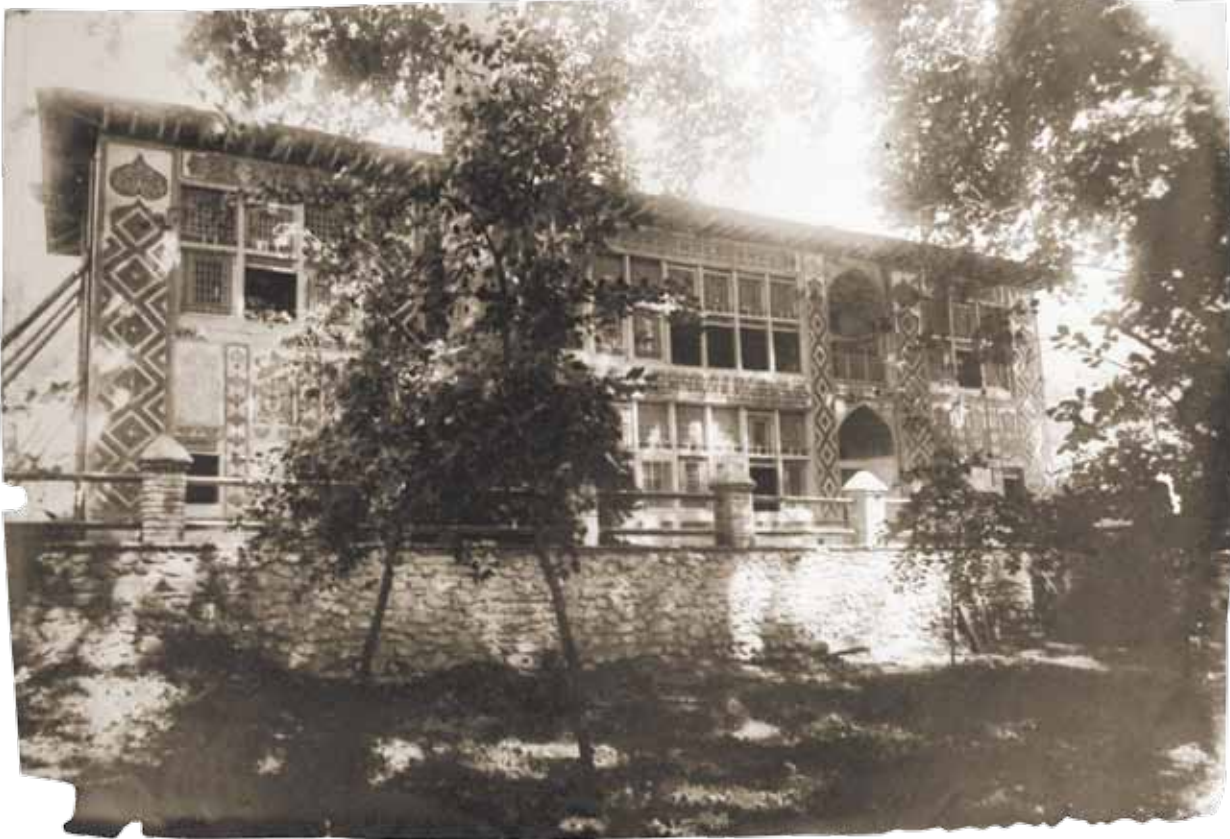
Фасад Дворца шекинских ханов. Национальный музей истории Азербайджана, фонд документальных источников, инв. № 2013