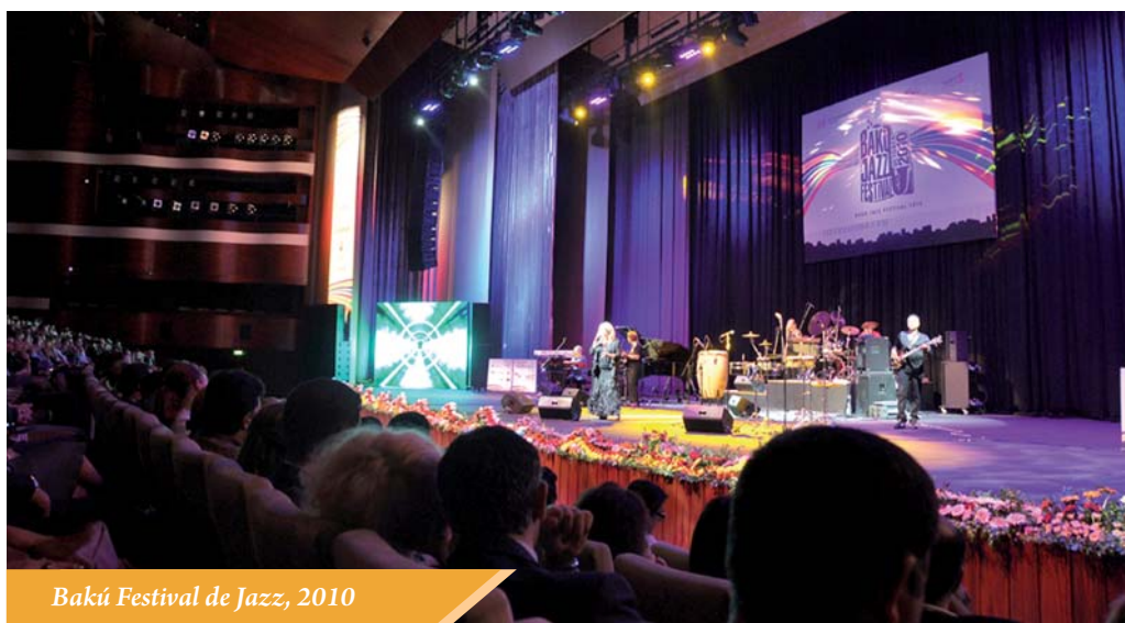
Bakú Festival de Jazz, 2010

En el invierno de cada año, a mediados de diciembre, llegan a Bakú los mejores representantes del arte musical mundial, para una vez más rendirle homenaje a la memoria del gran maestro Mstislav Rostropovich en su tierra natal. El Tradicional Festival Internacional de Música de Mstislav Rostropovich es uno de los más prestigiosos y esperados, tanto por los residentes de Bakú, como por los invitados de la capital de Azerbaiyán. Cabe resaltar, que la tradición en la realización de este tipo de festival fue promovida por iniciativa del Maestro Rostropovich, cuando en el año 2006 en el gran Festival Internacional, fue conmemorado el centenario aniversario del eminente compositor del siglo XX Dimitri Shostakovich, quién fue un gran amigo de la música de Azerbaiyán.