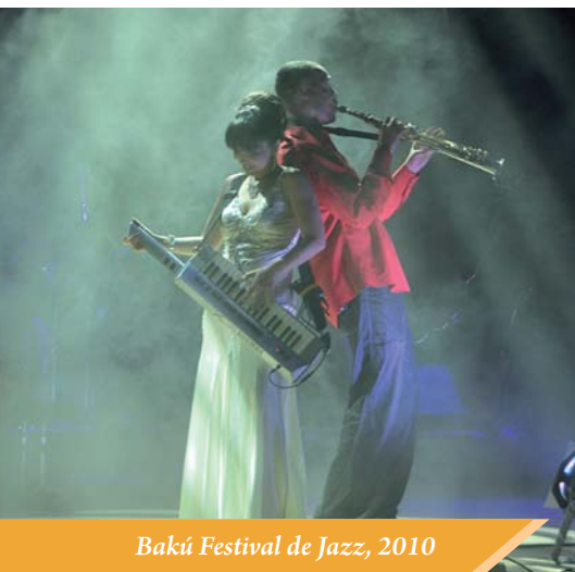
Bakú Festival de Jazz, 2010

del Festival, se incluyeron espectáculos, conciertos de música orquestal, presentaciones de conjuntos y de solistas de intérpretes azerbaiyanos e internacionales, ejecutados en las mejores salas de la capital, en la Ciudad de Sumgait y también en la patria de U. Hajibeyov –la ciudad Agjabadi-. En el Festival también participaron numerosos invitados del extranjero: El Coro de Cámara "Orfeón (Turquía), el cuarteto "Tango" (Singapur), el Conjunto "Amaltea" (Suiza), la Orquesta Sinfónica Juvenil de la CEI (dirigida por V. Spivakov), los solistas A. Gindin, S. Kudriakov, A. Saikin (Rusia), D. Lively, J. Veen (Países Bajos), N. Rexroth (Alemania), A. Bancas, N. Kogan (Canadá), directores de orquesta A. Markin (Rusia) y I. Hajiev (Canadá).