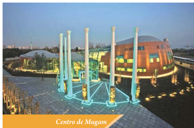
Centro de Mugam

Los invitados y participantes del festival fueron maestros-vocalistas e instrumentistas de distintos países como Egipto, Estados Unidos, Turquía, Canadá, India, Francia, Irak, Uzbekistán, Irán, China, Perú y Ecuador. En el marco del Festival se celebró también otro simposio bajo los auspicios de la UNESCO y el Segundo Concurso Internacional de jóvenes intérpre-